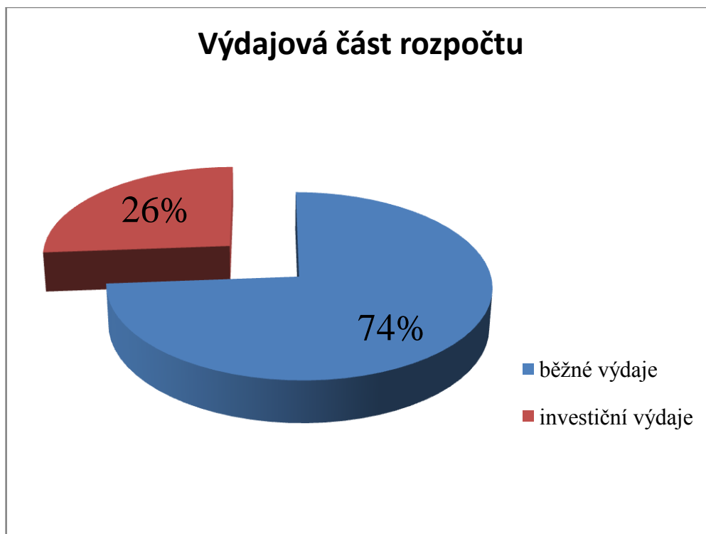
Graf 2: Výdajová část skutečného rozpočtu pro rok 2013

Schválený rozpočet počítal s celkovými výdaji ve výši 39 948 190 Kč, ve skutečném rozpočtu se výdaje podepsaly v částce 50 006 498 Kč (bez položky převody mezi účty). Do výdajové stránky rozpočtu na konci roku město zahrnuje položku převody mezi účty a to ve výši 13 580 100 Kč. O tuto částku se skutečný rozpočet roku 2013 navýšil a měl hodnotu 63 586 598 Kč. Tento převod mezi účty příjmů a výdajů, byl jedním z hlavních důvodů navýšení výdajové stránky skutečného rozpočtu. Město člení výdaje dle rozpočtové skladby na běžné výdaje (třída 5) a investiční výdaje (třída 6). Při vypracování výdajové části městského rozpočtu se vychází z analýzy výdajů let minulých, z dlouhodobých závazků a uzavřených smluvních vztahů. Rozpočet výdajů vychází z rozpočtového výhledu na rok 2013. Na rozpočtu výdajů se podepsaly povodně, které město postihly v roce 2013 a zničily část místních komunikací.