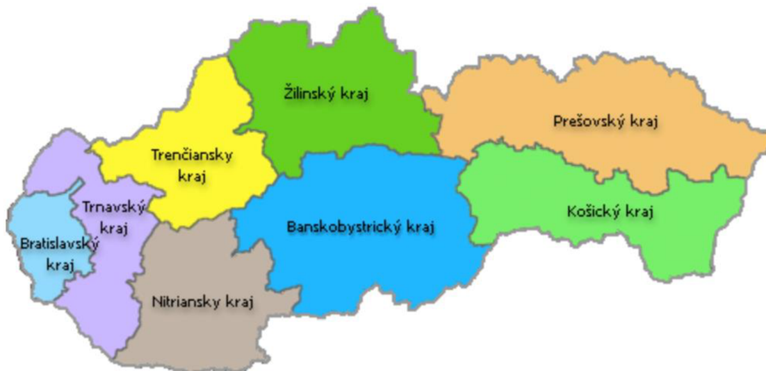
Obrázek 1: Slovenské kraje