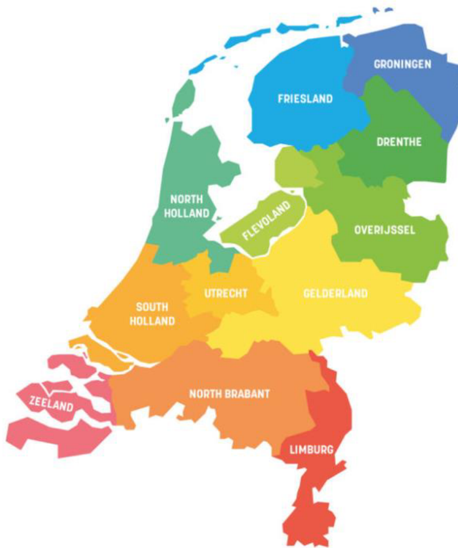
Obrázek 2: Nizozemské provincie

Periferními provinciemi Nizozemí jsou Zeeland, Limburg a Groningen, což je dáno zejména jejich polohou.