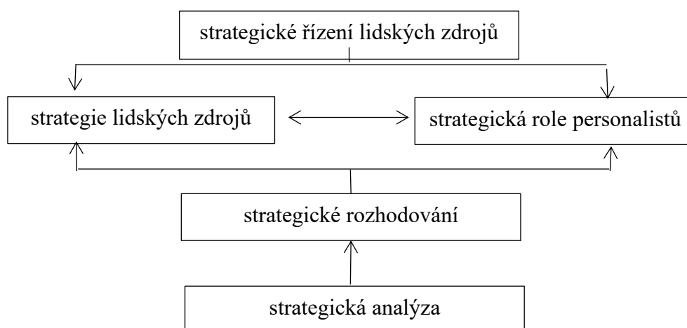
Schéma 1: Model strategického řízení lidských zdrojů

Vytvoření strategického plánu a realizace podnikatelského plánu s obsahem financování a získání zdrojů by měla být počáteční aktivita každé začínající organizace. Každý podnikatel by měl umět vytyčit strategie firmy, to tvoří základ pro veškeré další plánování, rozhodování a realizaci operativních cílů. Velmi často se setkáváme s názory podnikatelů, že na vytvoření strategického plánu není čas. Tím se určitě dostávají do jistého prodlení, které je při neustálém chodu firmy velmi těžké dohnat. Tato rozhodnutí mohou dlouhodobě ovlivnit výkonnost firmy. Vytvoření působivého strategického plánu není rozhodně jednoduché, zejména pak jeho reálné uskutečnění v praxi směrem k dosahování požadovaných výsledků (Srpková a kol., 2011, str. 160-161).