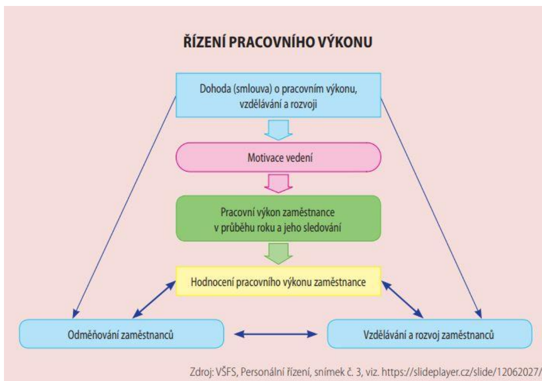
Obrázek 1: Řízení pracovního výkonu

S ohledem na dodržování stanovených zákonů o vedení organizace či spolupráce se zaměstnanci je vytvoření firemní strategie věcí velmi individuální. Každá organizace může vytvořit svou firemní strategii zejména s ohledem na typ podnikání, vnější a vnitřní vlivy na organizaci, na dosažení požadovaných cílů a na fungování všech lidí zainteresovaných do organizace. V dalších podkapitolách rozeberu nejdůležitější nástroje vedoucí k úspěšnému rozvoji vztahu mezi zaměstnanci a vyšším managementem.