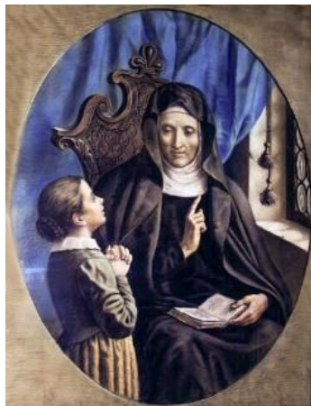
Obrázek č. 5 Svatá Angela Merici