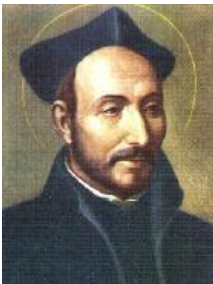
Obrázek č. 1 Ignác z Loyoly