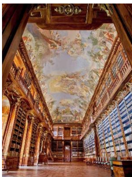
Obrázek č. 7 Strahovský klášter-Filosofický sál knihovny