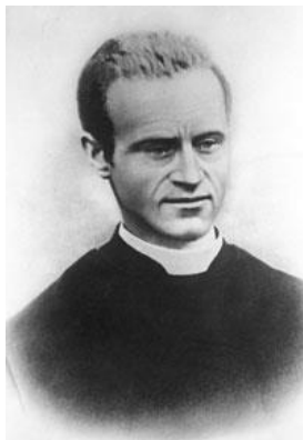
Obrázek č. 3 Václav Klement Petr

Zakladatelem ryze české mužské kongregace byl český rodák Václav Klement Petr. Podle jeho příjmení Petr se ujalo zkrácené pojmenování kongregace petrini. Buben uvádí, že se Václav Klement Petr narodil 16.1. 1856 v Sušici (Buben, 2018, s. 200). Byl třetím synem v rodině kožešnického mistra. Rodina žila v dobrých poměrech. Nejstarší bratr se připravoval na převzetí otcova podniku, prostřední bratr se připravoval na dráhu notáře a nejmladší Václav studoval na klasickém gymnáziu v Klatovech, které vedli benediktini. Po skonu jeho maminky jej jeho strýc v kněžské službě povzbuzoval ke studiu teologie a dráze kněze. Touto cestou se Václav Klement Petr dal a začal v českobudějovickém semináři studovat (Tamtéž, s. 200). Jak dále Buben zmiňuje hned v prvním roce v semináři studium přerušil a nastoupil dobrovolně na jeden rok na vojnu. Během vojenské služby byl vážně zraněn a málem přišel o oko. Po návratu do semináře se u něj v třetím a čtvrtém roce studia začala projevovat závažná choroba (kašlal krev). Jeho zdraví se zlepšilo a byl po ukončení svých studií 18.7.1880 vysvěcen na kněze (Tamtéž, s. 200). Po svém vysvěcení se Václav Klement Petr věnoval kněžské službě kaplana v Blovicích. Po 2,5 letech byl jmenován biskupem Janem Valeriánem Jirsíkem do funkce vicerektora kněžského semináře v Českých Budějovicích (Buben, 2018, s. 200).