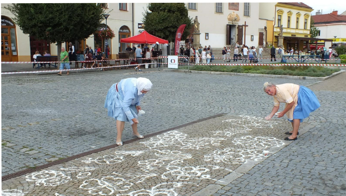
Obrázek 6: Malování tradičních ornamentů z písku a mouky.

Dostupné z: https://www.regionslovacko.cz/ .