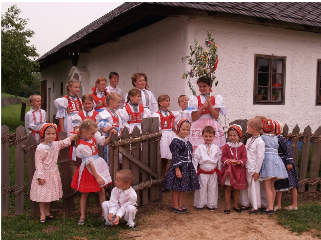
Obrázek 8: Dětský folklorní soubor Kyjovánek z Kyjova.