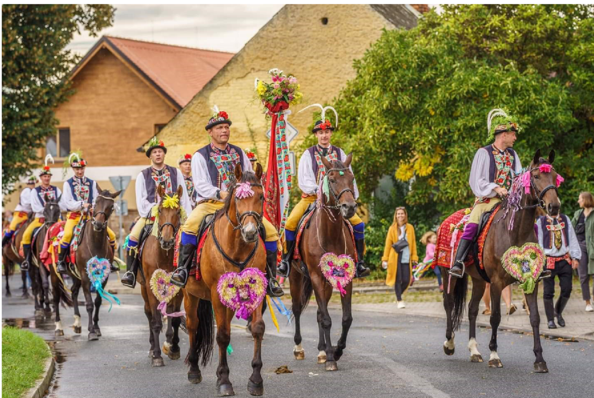
Obrázek 3: Skoronská jízda králů (družina jezdců).