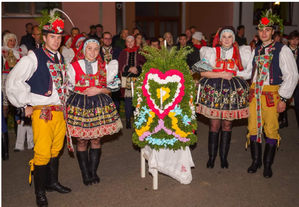
Obrázek 1: Krojované hody na Slovácku (stárci a stárky s tradičním hodovým věncem).