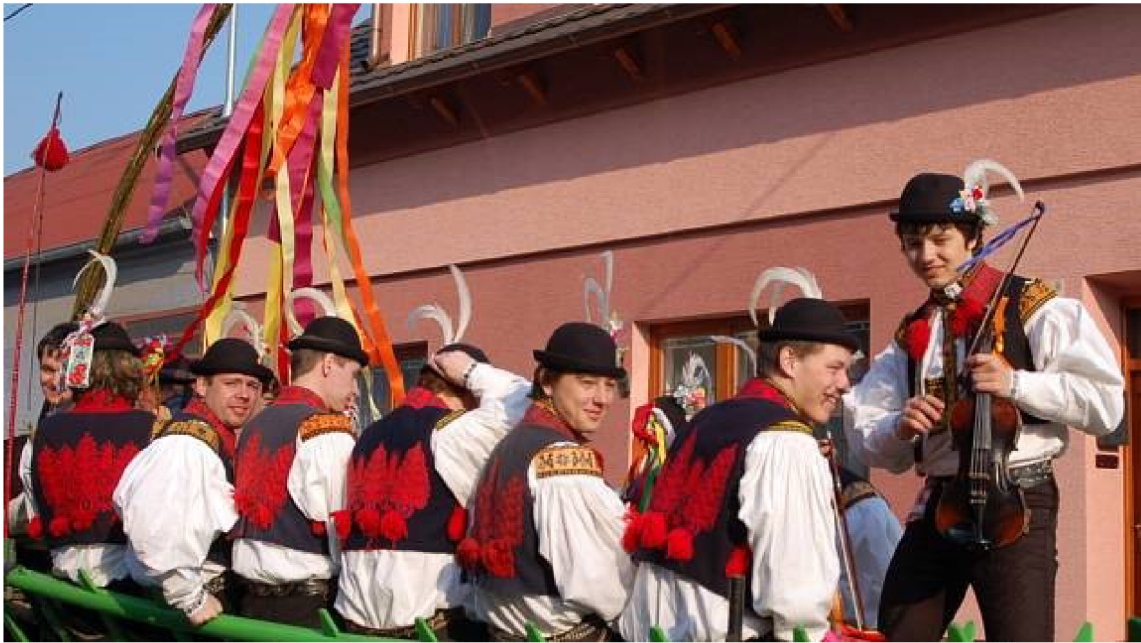
Obrázek 7: Velikonoční obchůzka.