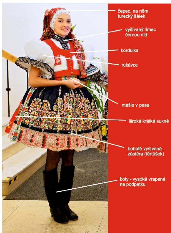
Obrázek 2: Ukázka tradičního kyjovského kroje. Zdroj: Informační centrum města Kyjova. Kyjov [online]. Dostupné z: https://www.mestokyjov.cz/informacni-centrum-mesta-kyjova/ds-1153 .