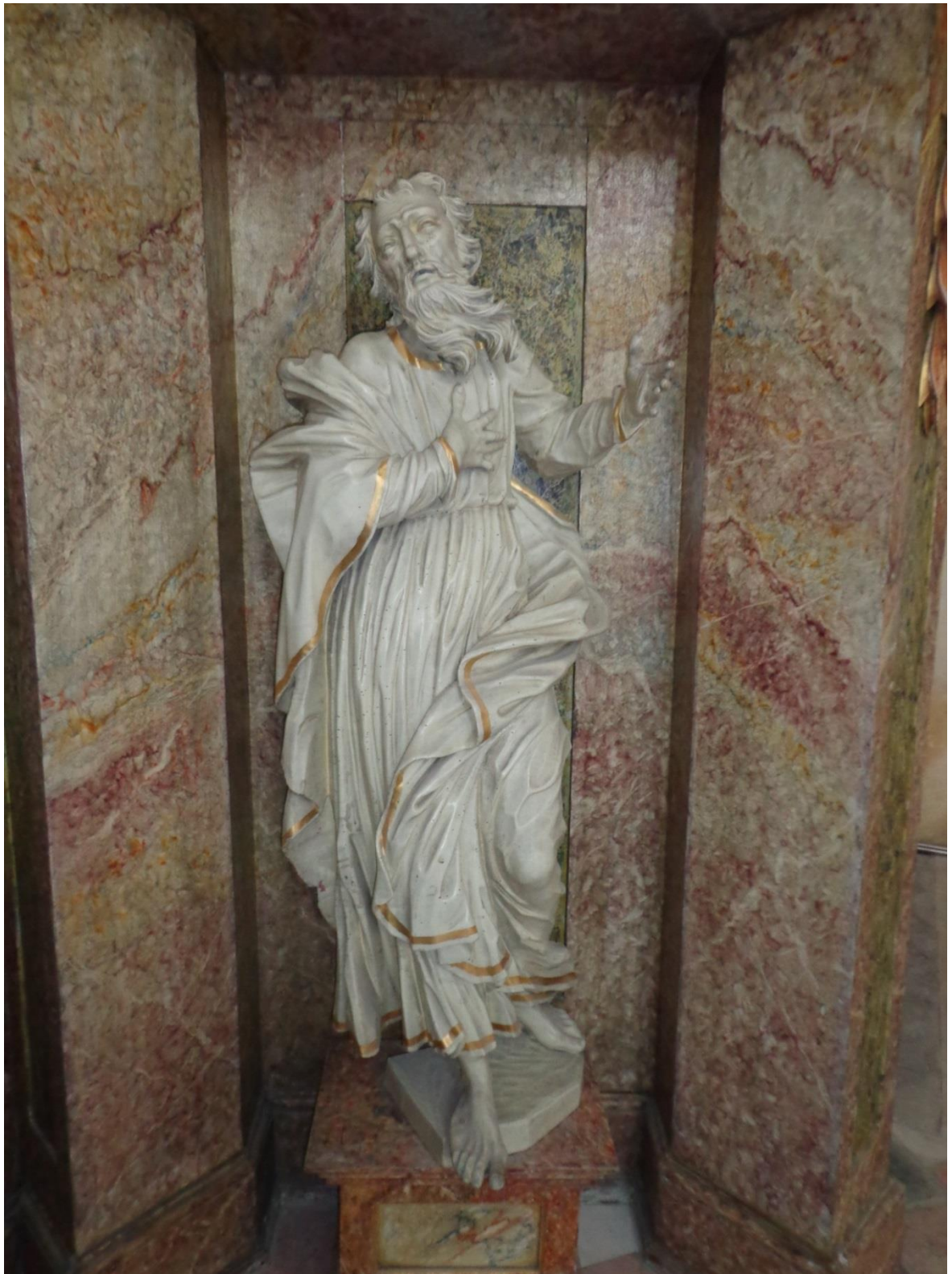
[19] Sv. Pavel, Branná