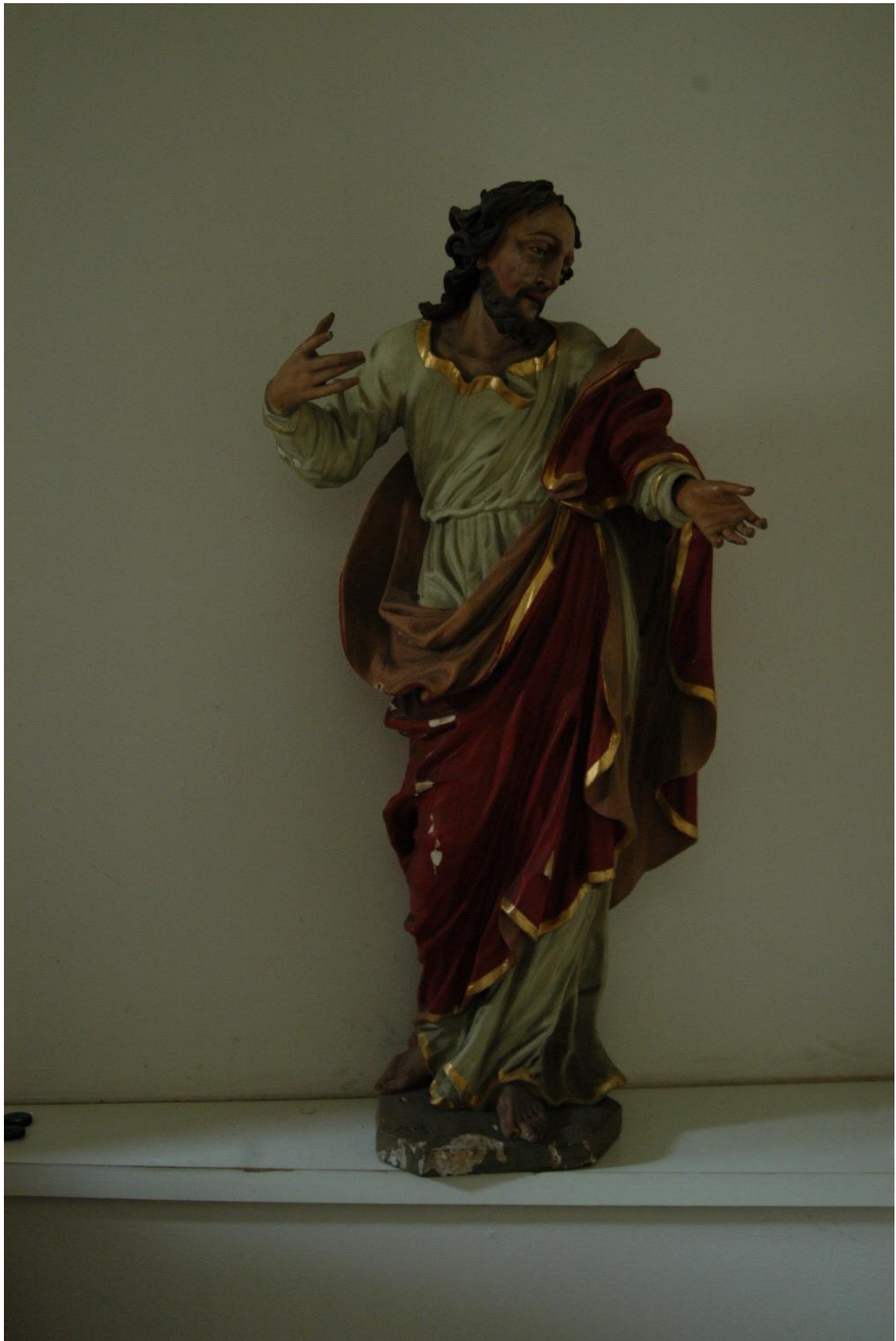
[16] Kristus, Staré Město pod Sněžníkem