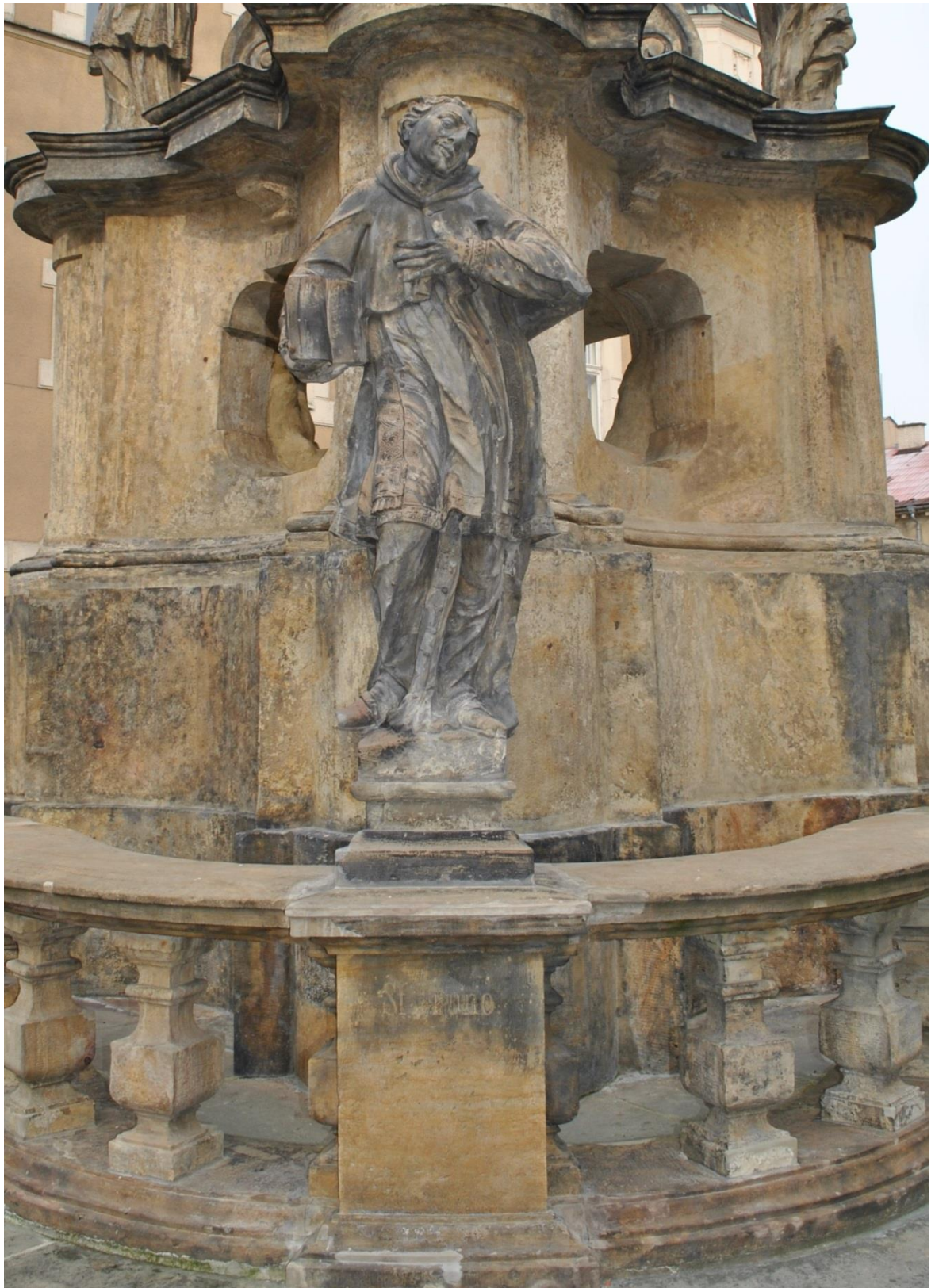
[8] Sv. Karel Boromejský