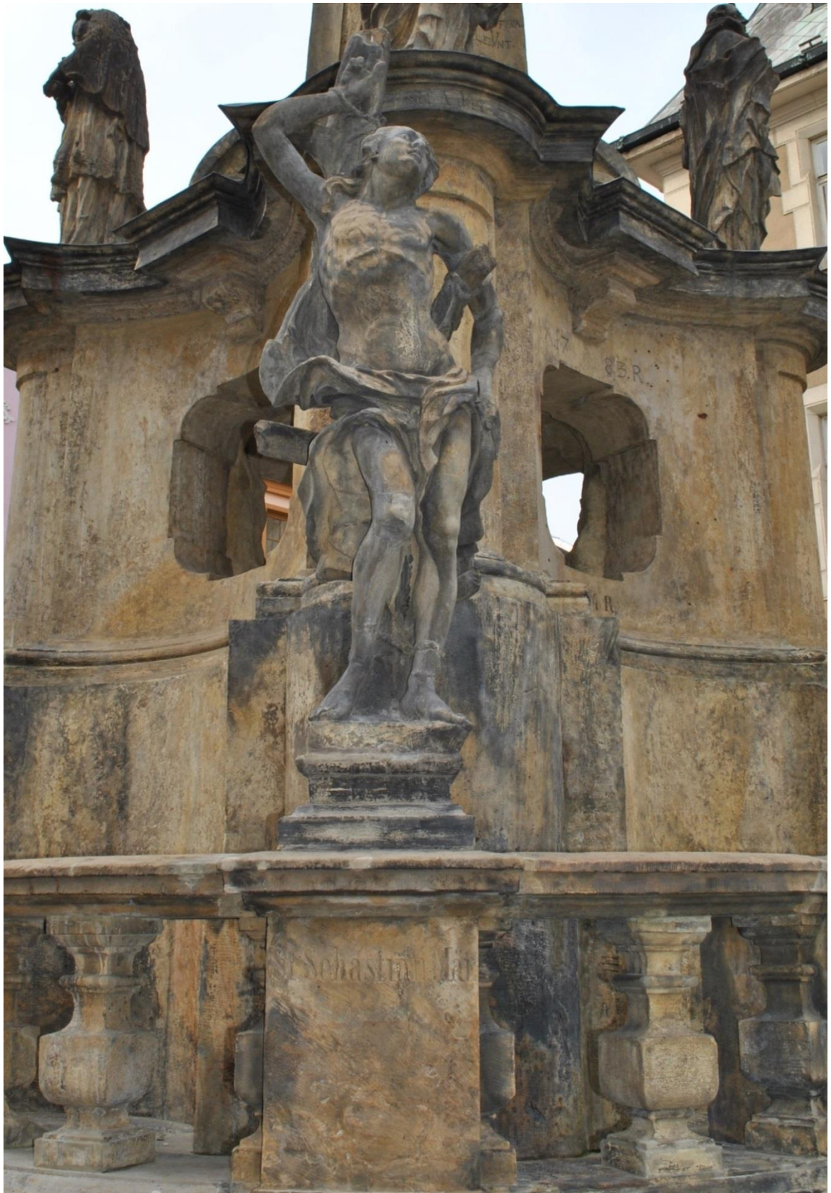
[5] Sv. Šebestián