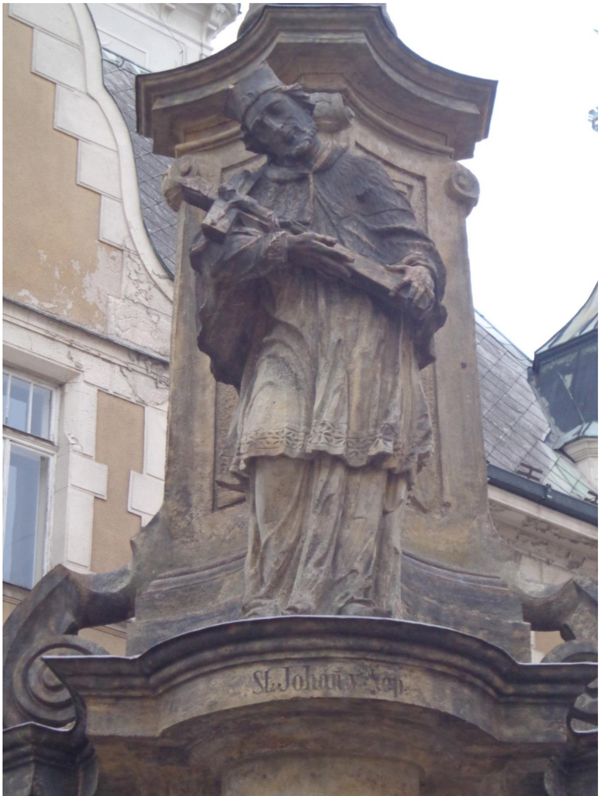
[13] Sv. Jan Nepomucký