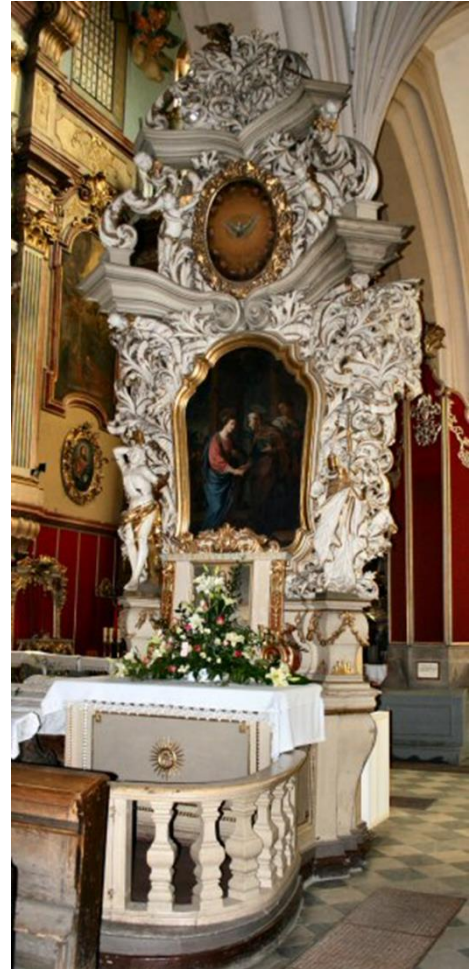
[28] Oltář Navštívení