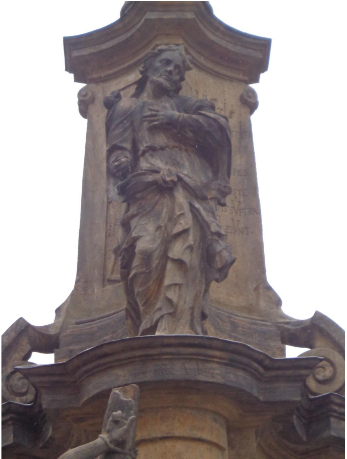
[9] Sv. Josef