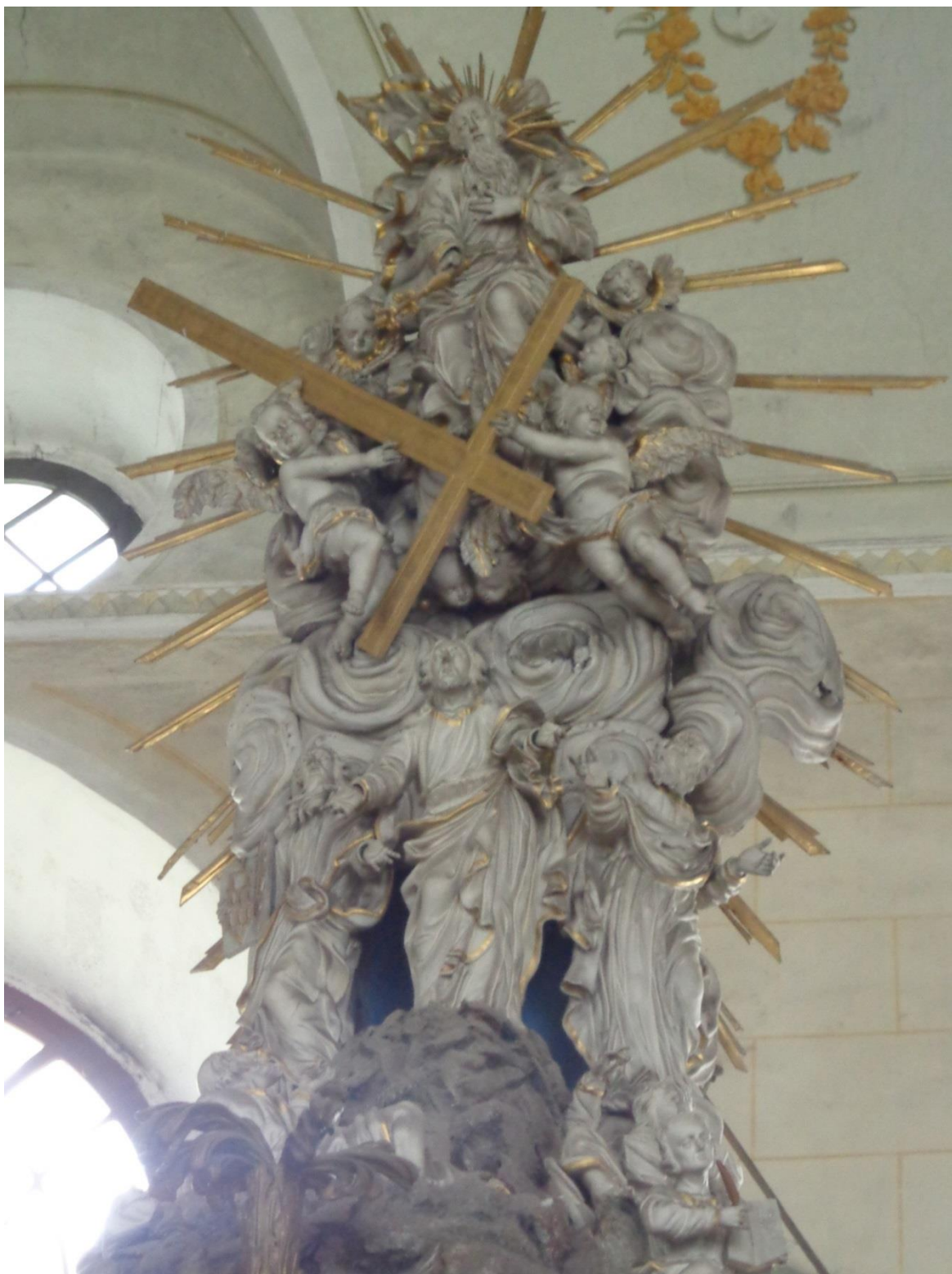
[20] Kristus na kazatelně, Branná