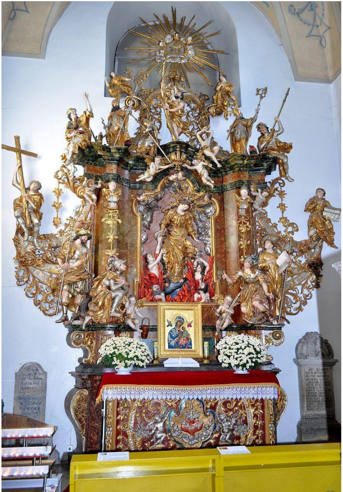
[32] Oltář Čtrnácti sv. pomocníků, Dušníky