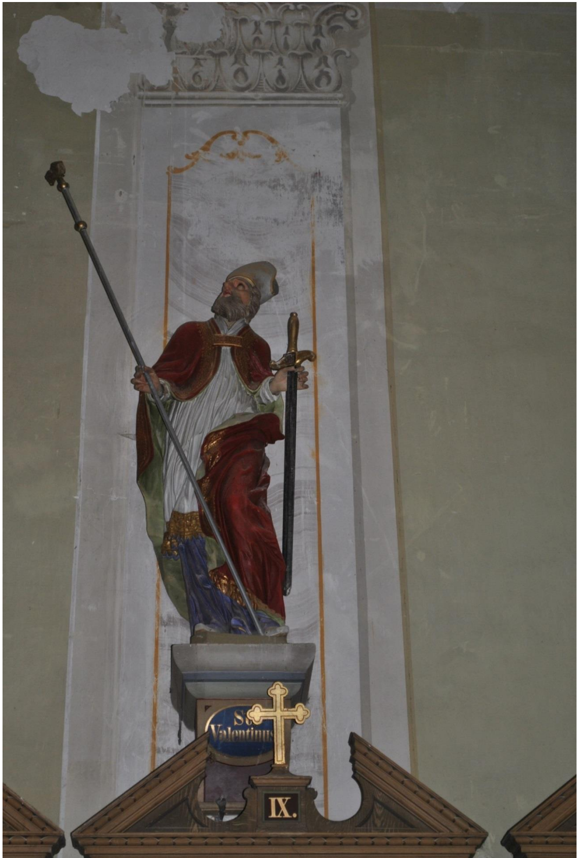
[23] Sv. Valentin, Konradow