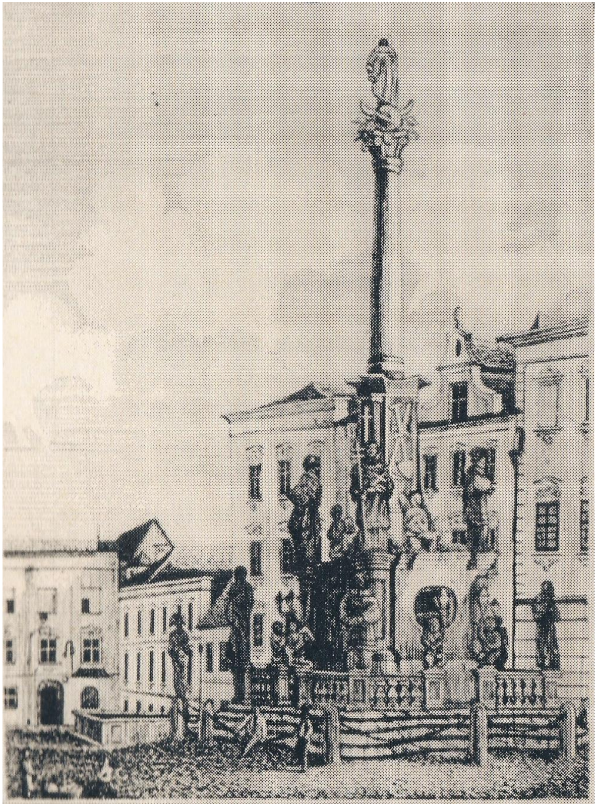
[3] Kresba mariánského sloupu v Šumperku z roku 1840