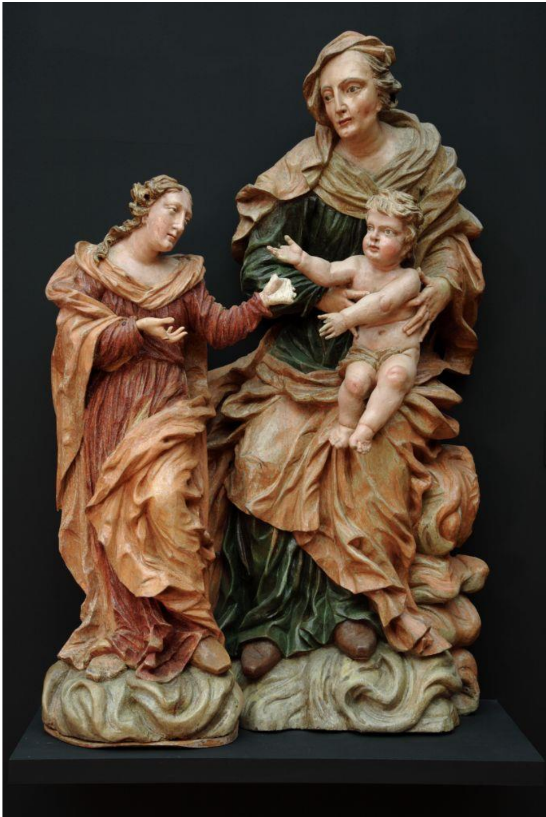
[15] Sv. Anna Samotřetí, Staré Město pod Sněžníkem