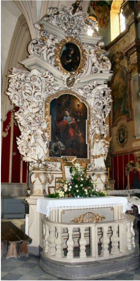
[27] Oltář sv. Barbory