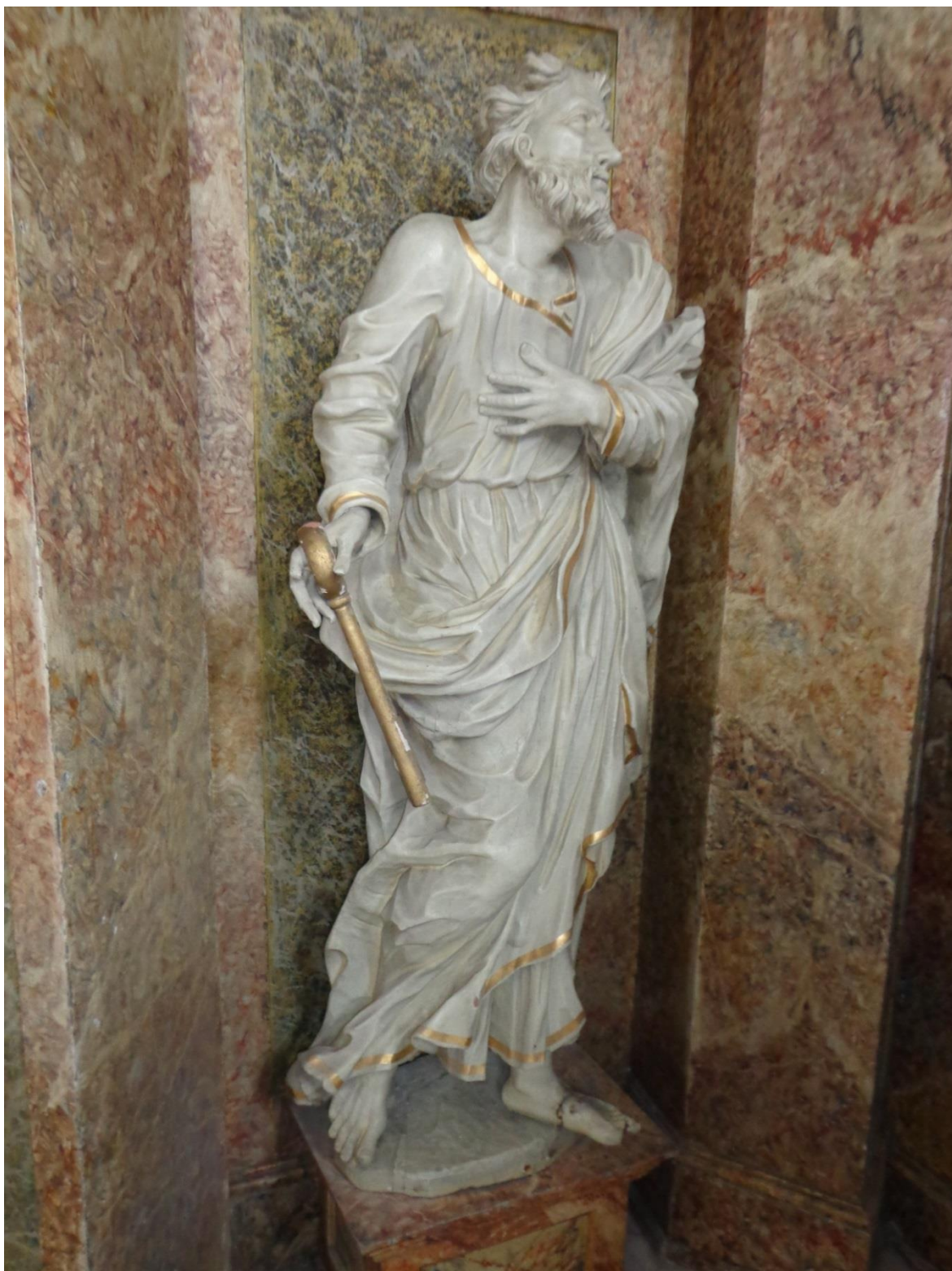
[18] Sv. Petr, Branná