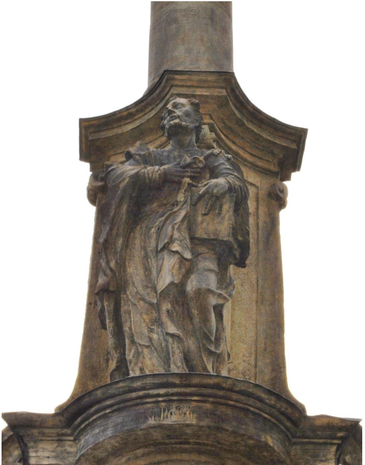
[10] Sv. Petr