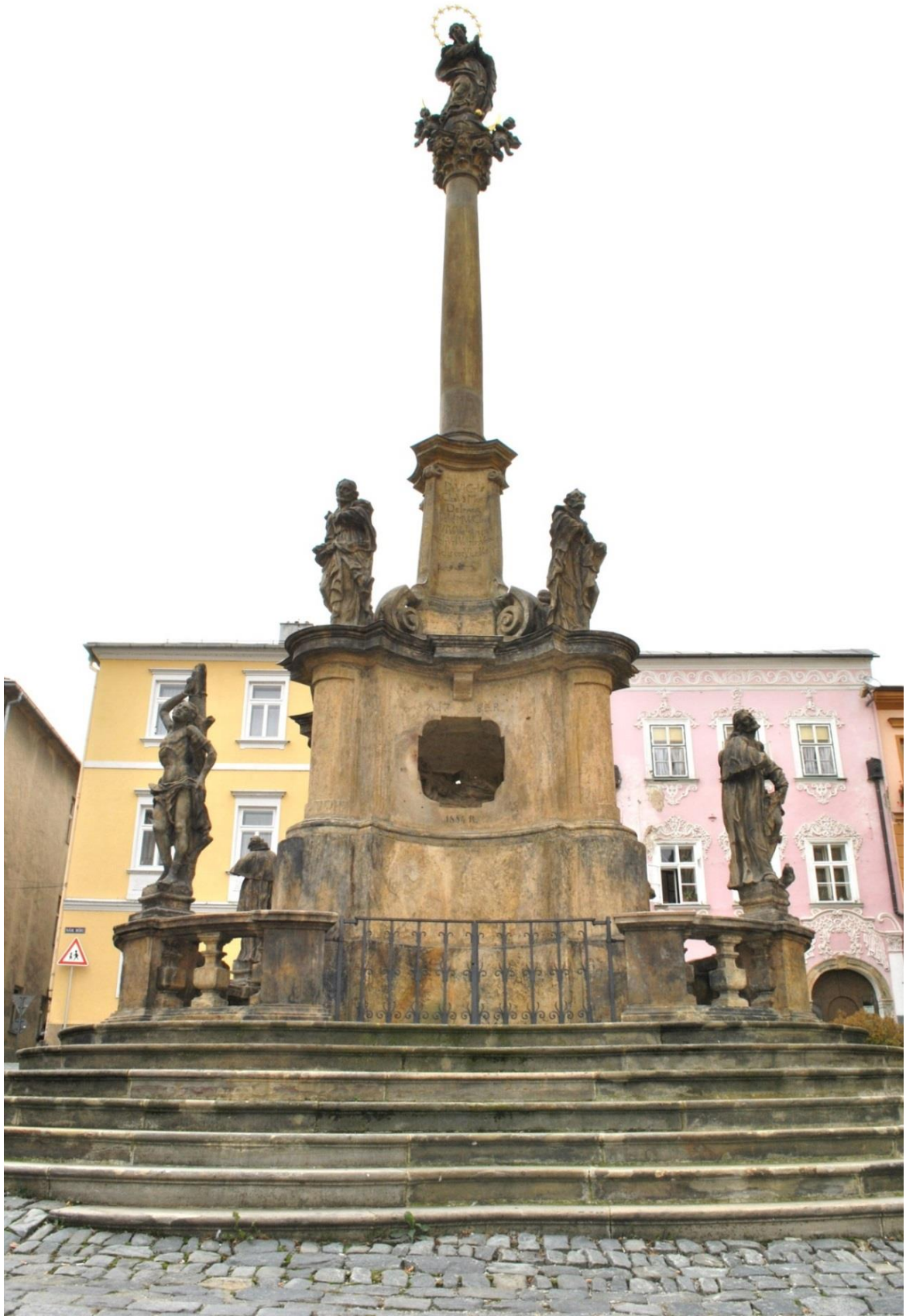
[2] Mariánský sloup, Šumperk