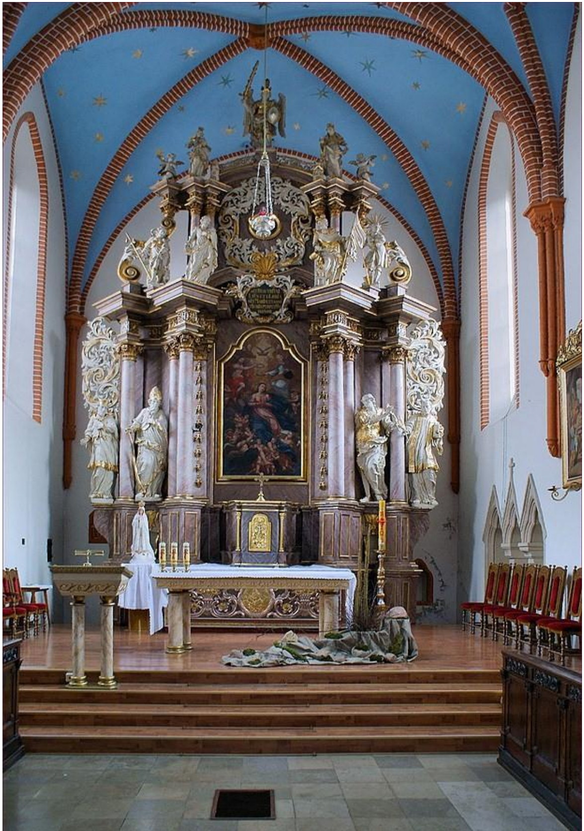
[34] Hlavní oltář, Grodkow