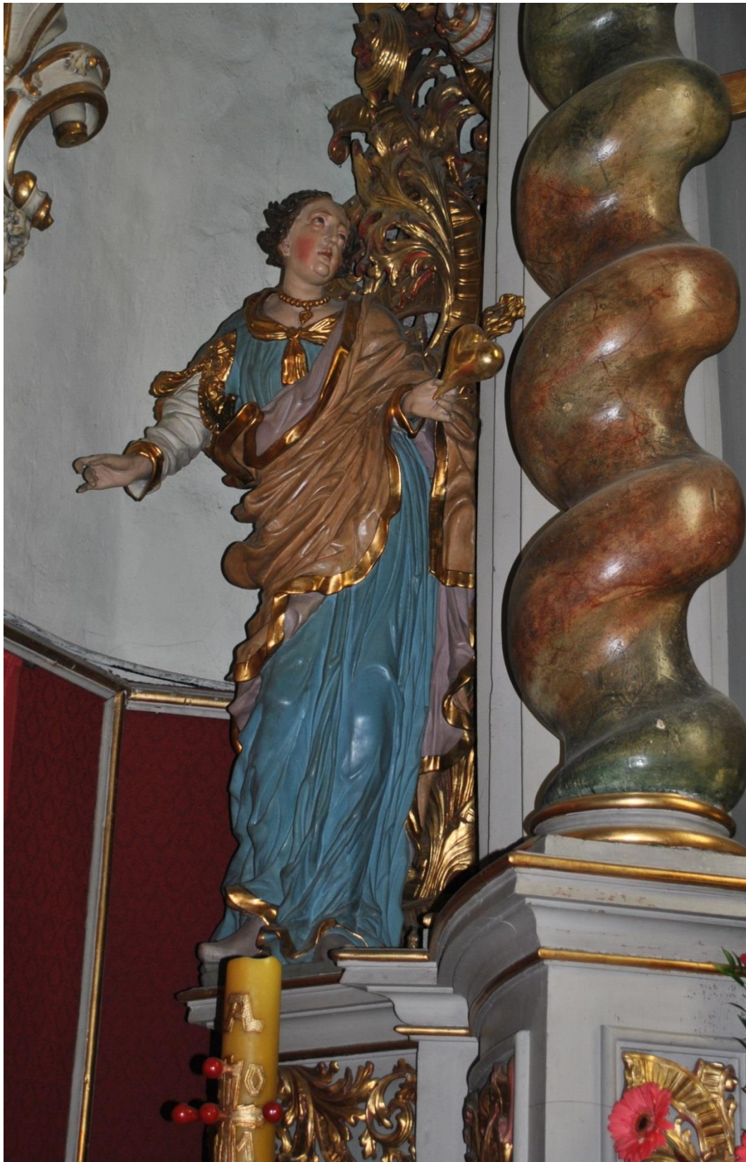
[26] Sv. Dorota z oltáře sv. Ignáce z Loyoly