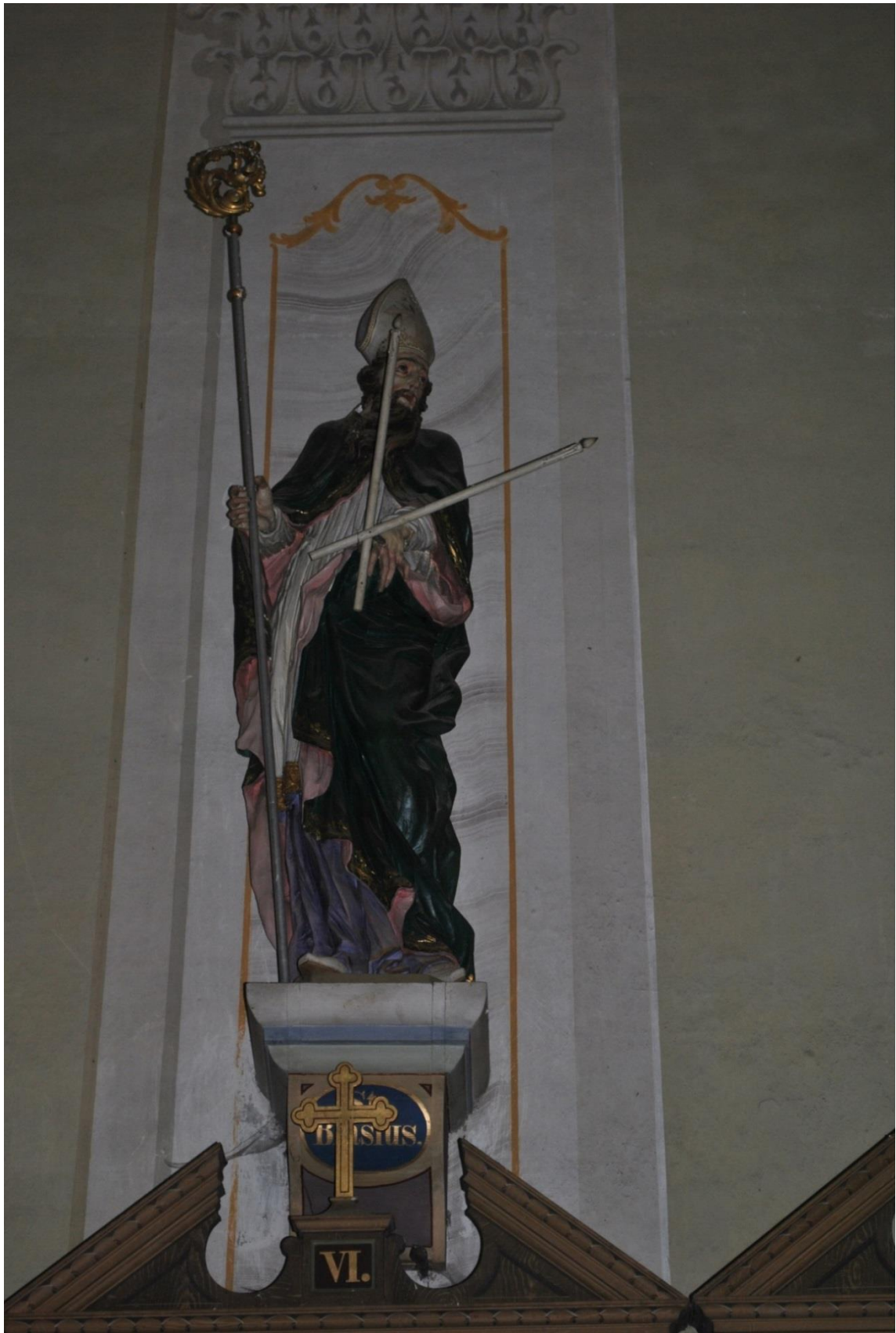
[22] Sv. Blažej, Konradow