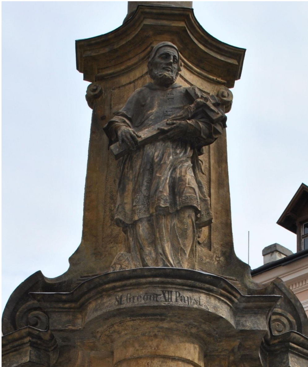
[11] Sv. Pius V.