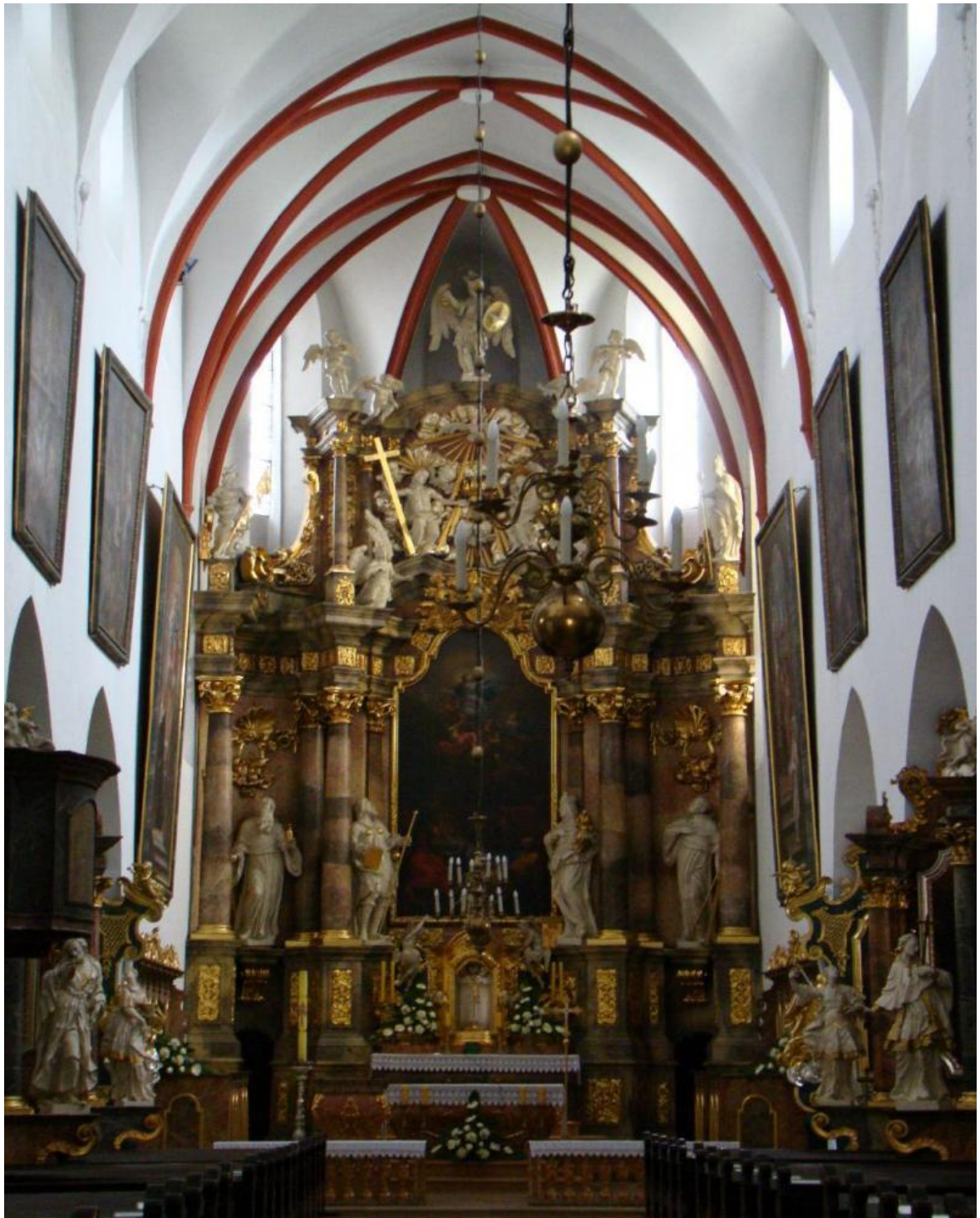
[35] Hlavní oltář, Jemielnice