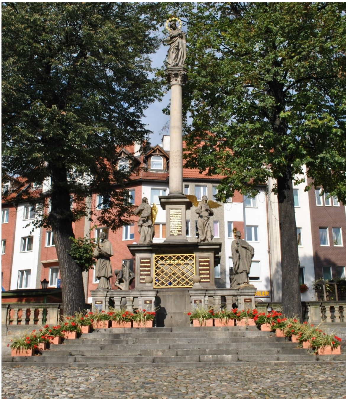
[1] Mariánský sloup, Kladsko