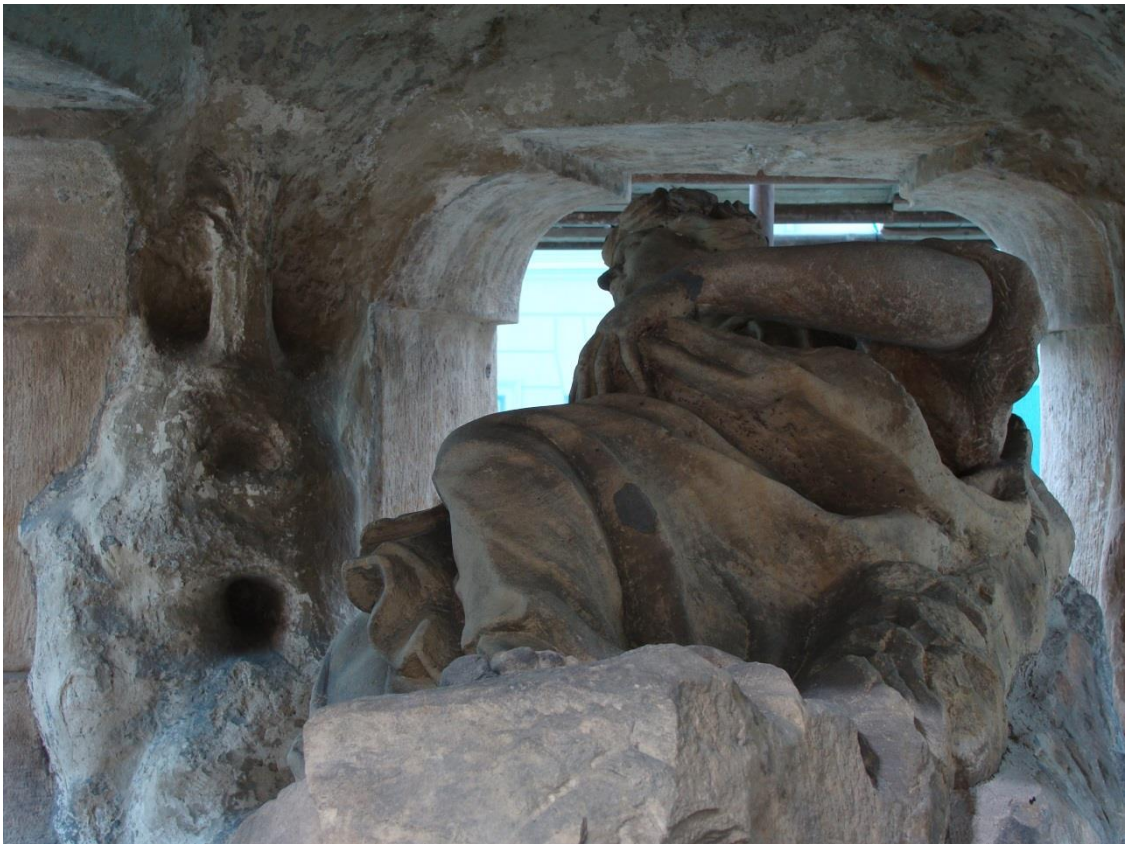
[4] Sv. Rozálie Palermská