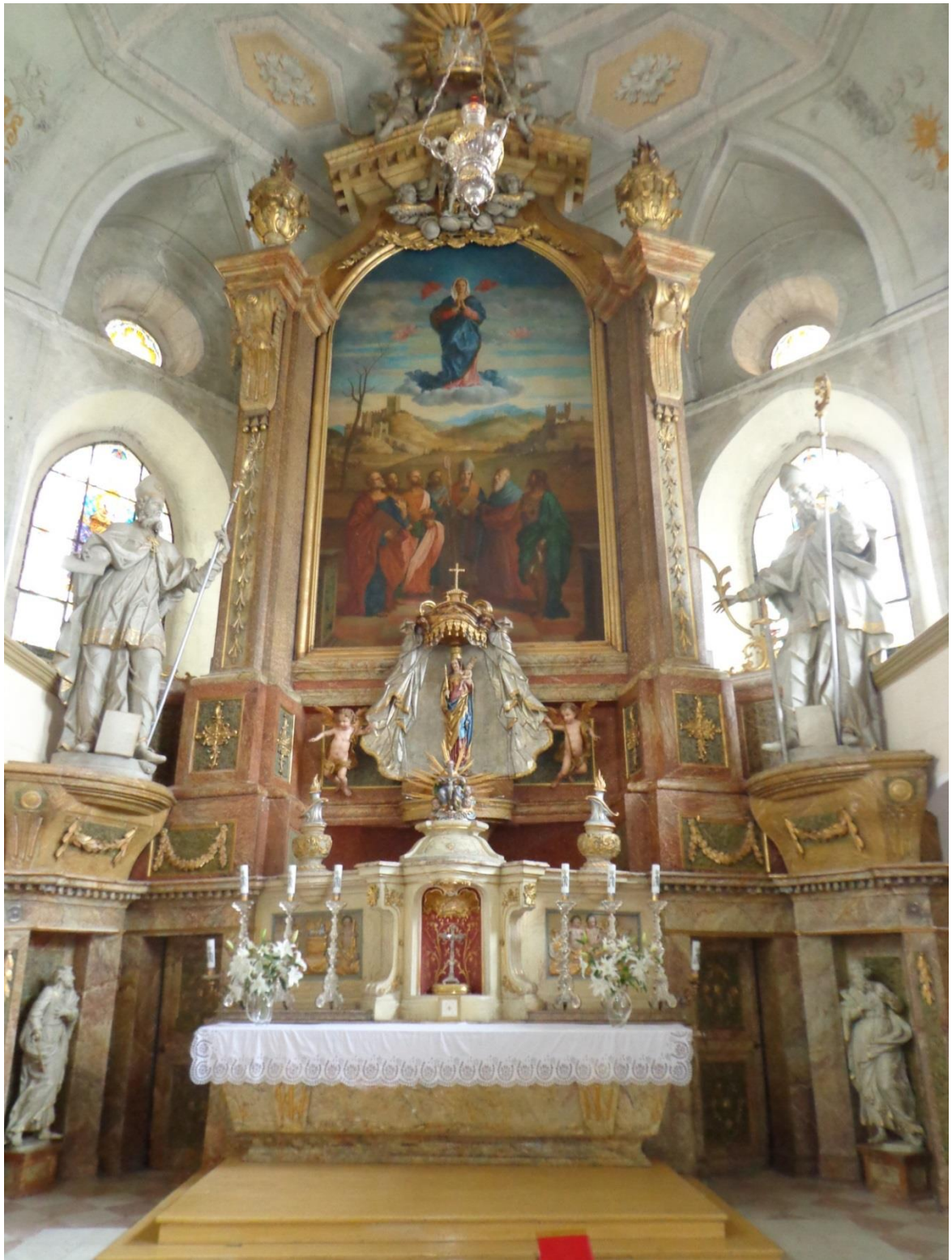
[17] Hlavní oltář, Branná