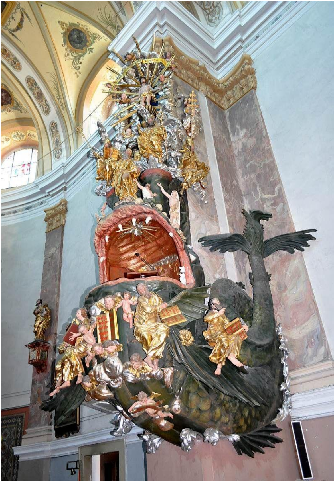
[33] Kazatelna ve tvaru velryby, Dušníky