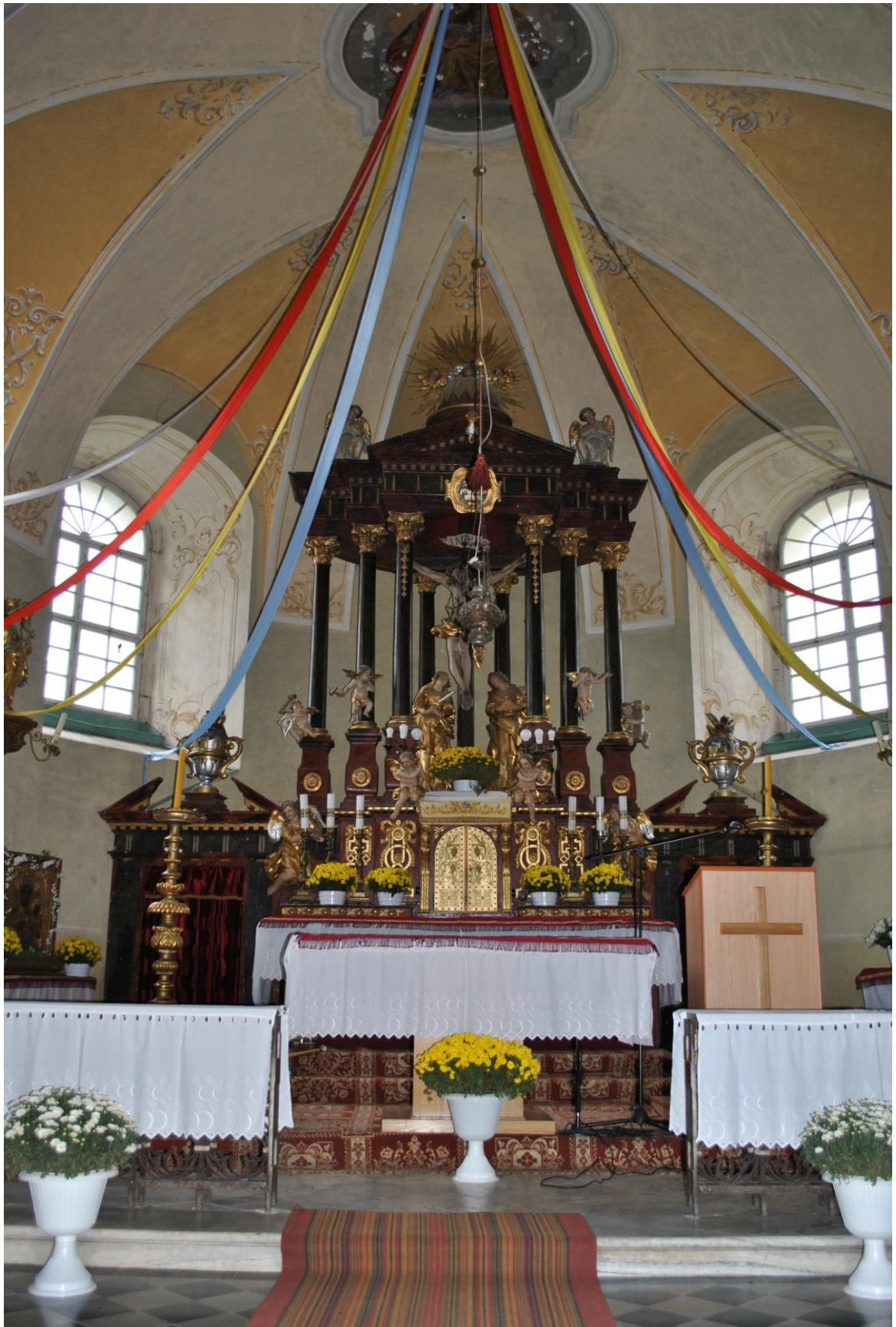
[21] Hlavní oltář, Konradow