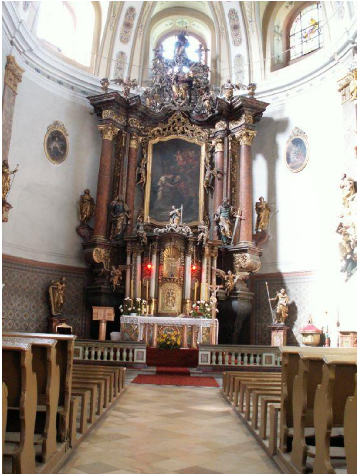
[31] Hlavní oltář, Dušníky