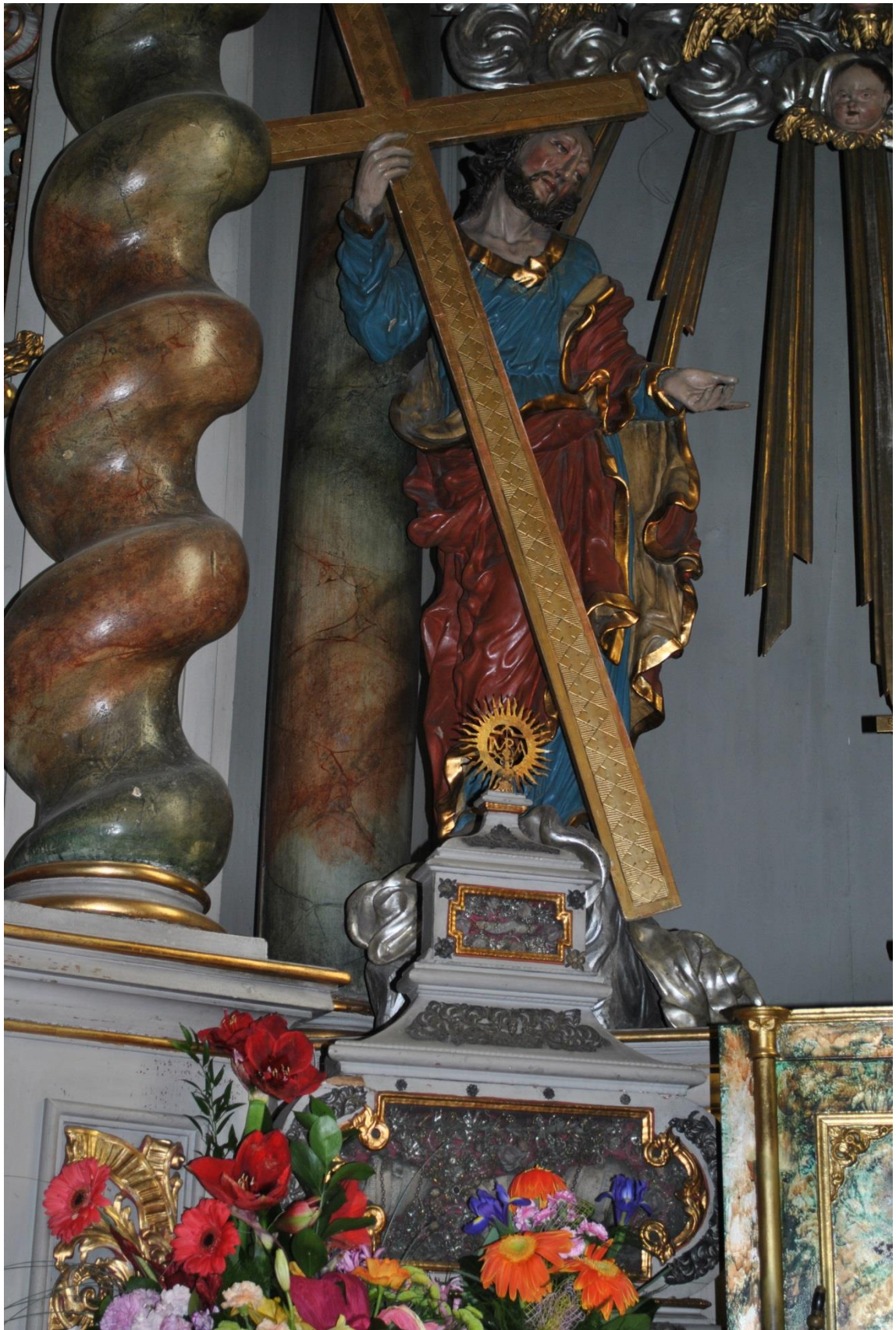
[25] Kristus z oltáře sv. Ignáce z Loyoly