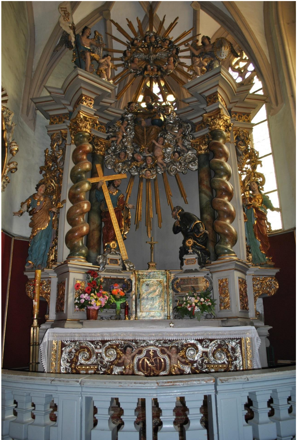
[24] Oltář sv. Ignáce z Loyoly, Kladsko