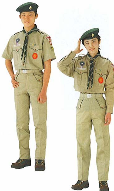
obr. 4: Kroj japonských skautů 146

V současné době český krojový řád 147 explicitně popisuje pouze košili a její příslušenství, všechno ostatní jsou doplňky závislé na volbě jednotlivce. Není tak předepsaná žádná pokrývka hlavy nebo kalhoty, respektive sukně. U všeho existují pouze doporučení, u pokrývek hlavy tradiční klobouky, kšiltovky, lodičky, barety a v případě vodních skautů bonbónky a brigadýrky ke slavnostním krojům, kalhoty a sukně, které jsou také pouze doporučené a ne předepsané, by měly být voleny jednobarevné a ideálně hnědé, černé nebo u vodních skautů modré. Opasek je standardizovaný do té míry, že existuje jednotná spona s psí hlavou, jménem organizace a heslem, a pěší skauti nosí opasky zelené nebo hnědé (kožené) a vodní skauti bílé. Jednotlivé věkové kategorie se liší barvou šátku a šňůrky s píšťalkou. Rozlišení kategorií podle šátků přestává být v poslední době aplikovatelné kvůli velkému množství slavnostních, zahraničních a jiných šátků, které se běžně nosí. Rozdíly mezi krojem skautů a skautek byl popsán v podkapitole 5.1.1.