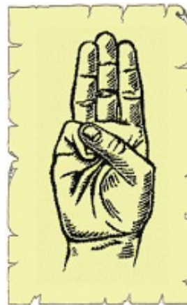
obr. 2 Skautský pozdrav

Skautský pozdrav je možné vidět na obrázku č. 2. 55 Tři vztyčené prsty představují tři body skautského slibu, palec přes malíček symbolizuje ochranu slabšího silnějším. Skautské znamení se provádí zvednutím pravé ruky, v lokti ohnuté do pravého úhlu směrem vzhůru, do výše ramen a pozdravem. Druhou variantou pozdravu je tzv. skautské salutování, kdy se ruka s pozdravem přiloží k čelu. 56