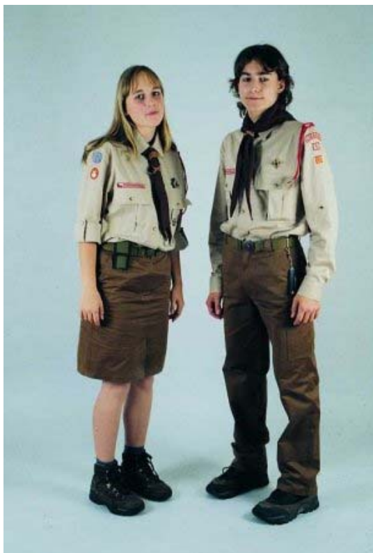
obr. 3: Kroj českých skautů 145