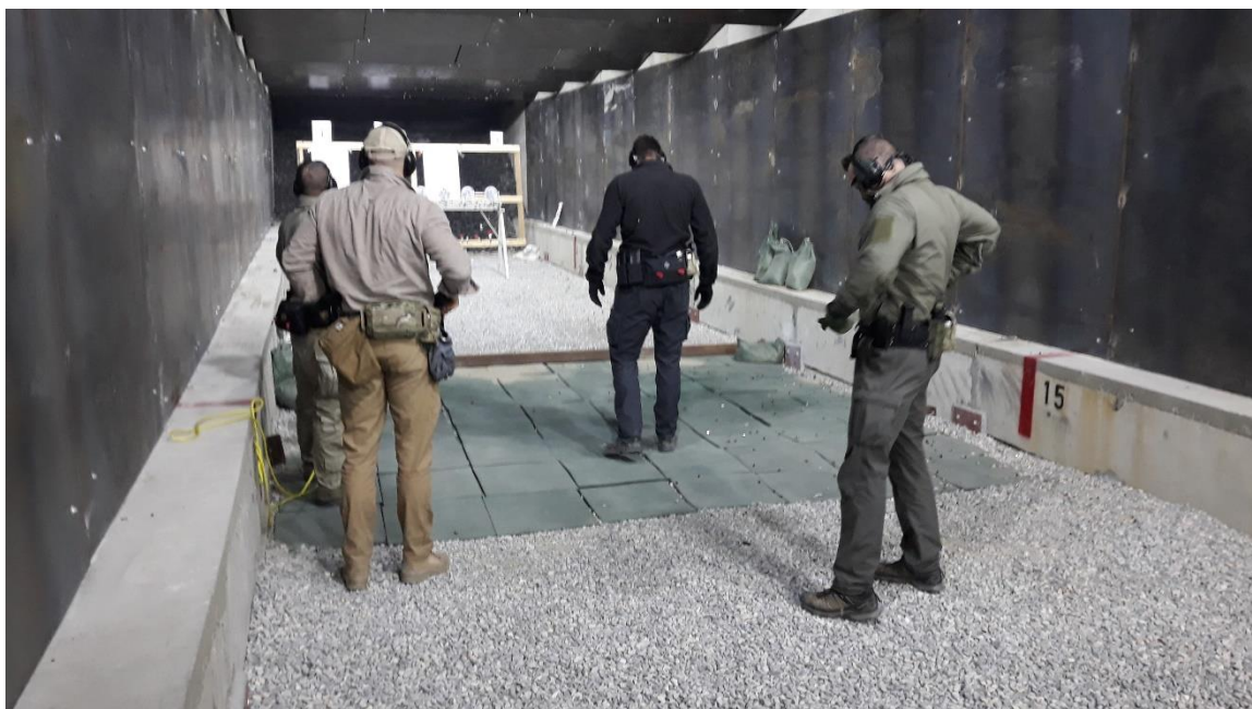
Obrázek 9: Střelecká příprava.

Téma 3/4 změna polohy 39 se stejně jako předešlé téma týká jak krátké zbraně (pistole) tak zbraně dlouhé (útočná puška). Cílem výcviku je seznámit cvičící s různými polohami, které je vhodné využít při střelbě na místě i za pohybu. Zvláště při činnosti ochranného týmu mohou nastat chvíle, kdy je třeba vést účinnou střelbu nejen ve stoje či kleče, ale například využít krytu vozidla v nejvyšší možné míře, a přesto vést efektivní střelbu. Základní trojici poloh tvoří poloha ve stoje, vkleče a vleže, a to jak při střelbě z pistole, tak při střelbě z útočné pušky. Další polohy, které je možné využít jsou kombinací těchto tří, a to především s ohledem na typ překážky či krytu odkud je střelba vedena.