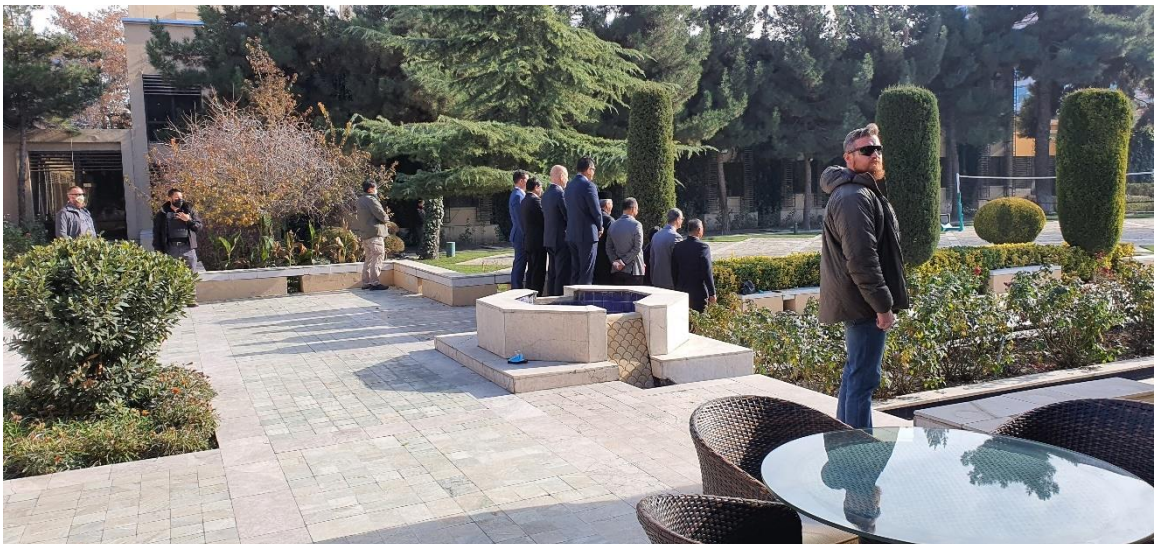
Obrázek 3: Ochranný tým KAMBA.

Ochrana osob je velmi specifickou a odborně náročnou činností. V rámci Vojenské policie AČR se ochranou osob zabývají dvě oddělení, Oddělení ochrany a doprovodů, a Oddělení ochrany osob. Přesto, že Vojenská policie disponuje specialisty na ochranu osob, vzhledem k počtu příslušníků v jedné rotaci KAMBA, bylo rozhodnuto, že bude probíhat výběrové řízení na obsazení míst v každé rotaci. Díky tomuto kroku dostali příležitost zúčastnit se výběrového řízení i příslušníci VP, kteří do té chvíle neměli s ochranou osob žádnou zkušenost. Je tedy logickým krokem, že je třeba se zaměřit na kvalitní výběr osob, který může být docílen pouze profesionálně sestaveným výběrem.