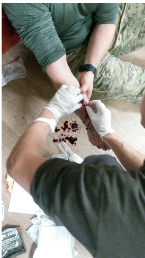
Obrázek 10: Zdravotní příprava.

Zdravotní příprava je další v řadě tematických okruhů, které je třeba úspěšně zvládnout v rámci přípravy jednotky KAMBA. Samotná příprava je rozdělena do 4 témat.