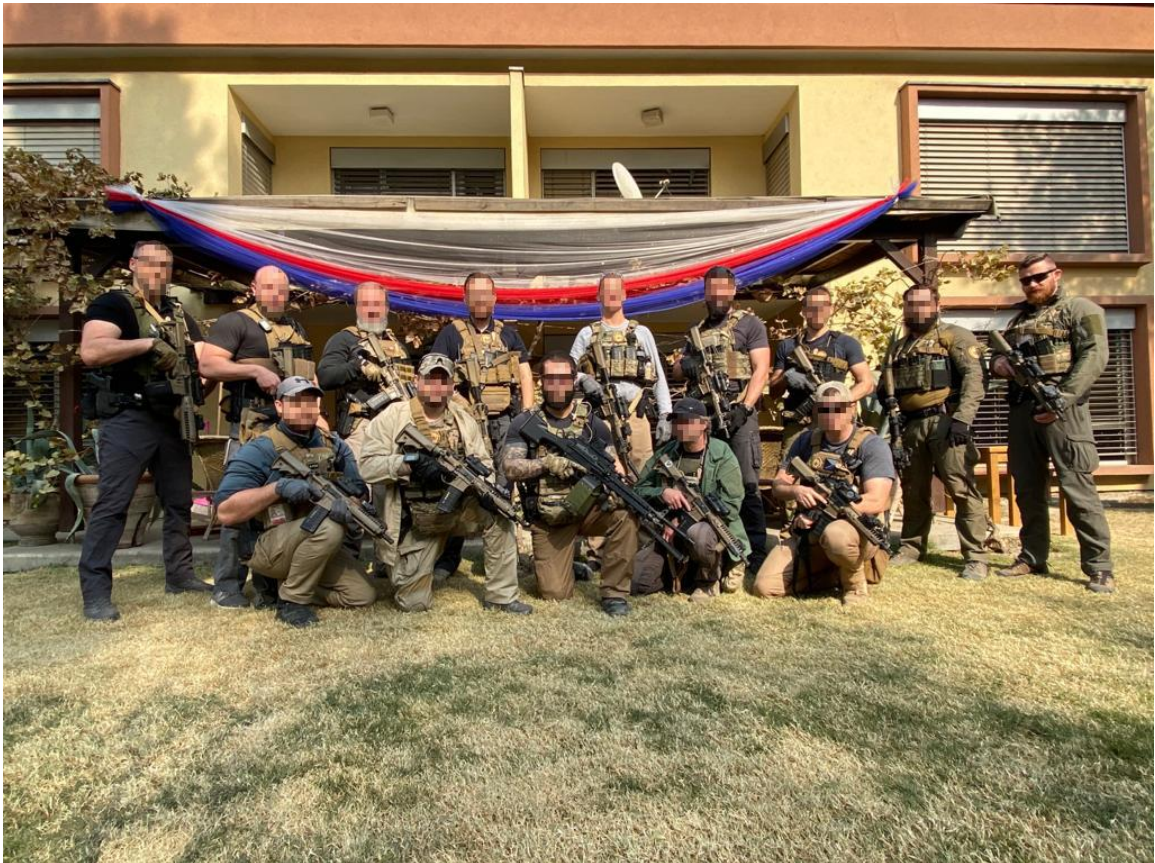
Obrázek 1: 9.jVP KAMBA.

Bezpečnostní situace v řadě zemí vyžaduje, aby zastupitelským úřadům v těchto zemích byly přiděleny ochranné týmy. Tyto týmy jsou převážně tvořeny příslušníky ozbrojených sil (policie, armáda) země, které úřad náleží. Není však výjimkou, že bezpečnost pracovníků a celého úřadu zabezpečují i soukromé subjekty. Zastupitelský úřad ČR v Kábulu byl až do evakuace a uzavření tohoto úřadu v roce 2021 zabezpečován od roku 2017 příslušníky Vojenské policie Armády České republiky. Název jednotky byl vytvořen jako zkratka slovního spojení Kábulská ambasáda, tedy KAMBA.