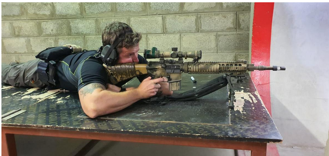
Obrázek 6: Odstřelovací puška MK 12.

Střelecká příprava v rámci přípravy jednotky před nasazením tvoří velkou část dotace výcvikových hodin. Na základě této skutečnosti je třeba zajistit pro jednotku dostatečné počty munice pro všechny zbraně a zbraňové systémy, které jsou využívány při výcviku. Pro jednotku KAMBA byly stanoveny počty munice následovně: 64 400 ks Nb 9x19 FMJ 8G NATO (pistole, HK MP5), 48 450 ks Nb 5,56x45 (útočná puška), 6 600 ks Nb 7,62x51, M80/M62, 100PA (kulomet Minimi), 60 ks granát URG-86, 170 ks Nb 40x46 HEDP (podvěs, vrhač granátů), 170 ks Nb 40x46 HEDP (podvěs, vrhač granátů), 16 ks RG smoke DM, 331 ks DA 25 B, OR, M, ZL, ČV (dýmovníčka), 95 ks zapalovač třecí TZ-M, 30 ks výbuška V5, 2B, 236 ks elektrický pyrotechnický iniciátor okamžitý EPIO, 5 100 ks 5,56x45 CV (útočná puška), 600 ks Nb 7,62x51 CV (Minimi), 1 490 ks Nb 5,56 mm FX Toxfree, 3 200 ks Nb 9 mm FX Toxfree, 1 000 ks Nb 7,62 mm CV 43 (Sa-58), 20 ks náložka 200 G TNT, 50 ks zápalnice UNIKORD 50 m a 30 ks rozbuška ženijní. 17