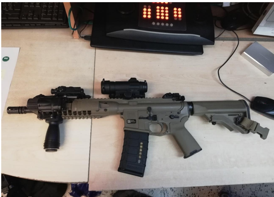
Obrázek 5: Útočná puška M6A2.

Zbraně pro výcvik ve střelecké přípravě dělíme dle účelu využití na zbraně, které bude využívat ve střelecké přípravě jednotlivců, jednotka a zbraně pro výcvik v taktické přípravě schopné využívat simulační munici. Každý příslušník jednotky je vybaven po celou dobu výcviku: zbraní Pi GLOCK 17 s taktickou svítilnou GTL 10 + 3 ks zásobníků a zbraní PU 5,56 mm typu M4A3 nebo M6A2, včetně zaměřovačů + 6 ks zásobníků. Jednotka jako organizační celek je vybavena: 2 ks PG CZ 805 G1R 40x46, 1 ks granátomet M32 A1 40x46, 6ks Pi GLOCK 26, 3 ks KUL 7,62x51 mm NATO 3 RAIL, 4 ks Sa HK MP5 A3 a 2 ks OPU 5,56 mm MK12. Pro výcvik v taktické přípravě je jednotka vybavena: 20 ks Pi GLOCK 17 T, 8 ks samopal HK MP5 + FX konverze, 8 ks PU 5,56 mm M4A3 + FX konverze, 2ks Sa vz.58, 1 ks Pi Sign. vz.24, 12 ks nástavec pro střelbu cvičnými náboji k PU 5,56 mm. 16