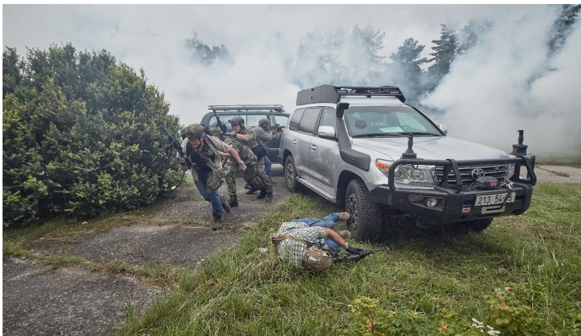
Obrázek 15: Certifikace jednotky KAMBA.

První z možných modelových situací je „ Attack on VIP in the building “. 67 Scénářem této situace je doprovod VIP osoby na jednání v budově lokální vojenské akademie. V průběhu jednání v jedné z budov akademie dojde k útoku střelnou zbraní na chráněnou osobu a ochranný tým. Očekávaná reakce ochranného týmu: a) odstavení útočníka/ů od chráněné osoby a jeho/jejich eliminace, b) velitel ochranného týmu po zhodnocení výše rizik vydá rozkaz k ukončení činnosti (jednání), zajištění safe house/room, přivolání vozidel k budově, opuštění akademie a návratu na ambasádu, c) proběhne koordinovaná činnost řidičů s ochranným týmem při přistavení vozidel, d) provede se přesun VIP osoby do přistavených vozidel. Jako další kritérium se vyhodnotí informační tok během řešení krizové situace, a to od velitele ochranného týmu směrem k řidičům, a dále komunikace velitele týmu směrem ke stále směně „Alfa“. Při komunikaci s „Alfou“ nesmí být v hlášení opomenuto udání polohy incidentu, stav VIP osoby a ochranného týmu a následný průjezd kontrolních bodů.