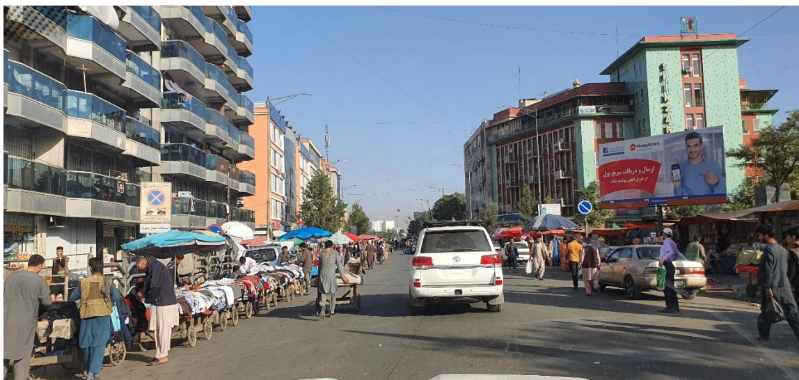
Obrázek 14: Hlavní a doprovodné vozidlo.

Pohyb této sestavy vozidel má svoje specifika, kterým se věnuje téma 4/3 technika jízdy hlavního a doprovodného vozidla. 52 Doprovodné vozidlo poskytuje, jakýsi komfort jízdy pro hlavní vozidlo (VIP) a při vzniku mimořádné situace mu poskytuje vhodným způsobem ochranu. V první řadě je třeba metodicky vysvětlit pohyb dvou vozidel za použití modelů, kdy získají řidiči představu, co bude obsahem praktického výcviku. Praktický výcvik je ve svém počátku prováděn na k tomu vhodné ploše, která je mimo běžný provoz. Jedná se převážně o vojenské výcvikové prostory, opuštěné letištní plochy nebo komerčně využívané plochy pro výcvik v řízení vozidel. Právě zde se řidiči naučí techniku jízdy na krátkou vzdálenost za hlavním vozidlem, „vykrývání“ VIP vozidla při průjezdu křižovatkou, zastavení a pozice vozidel při příjezdu a odjezdu z místa určení, využití doprovodného vozidla v koloně popojíždějících vozidel pro zabezpečení plynulého průjezdu VIP vozidla. Následně si řidiči vyzkouší získané dovednosti v běžném provozu za dodržení pravidel silničního provozu. Druhou částí praktického výcviku techniky jízdy dvou vozidel je nácvik řešení krizových situací. Tento výcvik probíhá pouze ve vojenských výcvikových prostorech z důvodu bezpečnosti. Vždy se jedná o perfektní spolupráci obou řidičů, kdy jeden reaguje na činnost druhého.