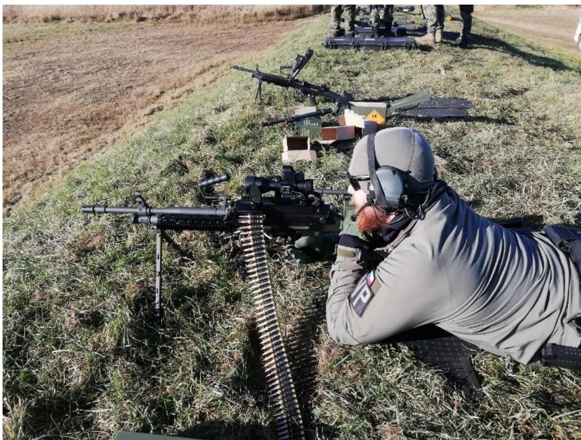
Obrázek 8: Střelecká příprava.

Téma 2 základy a pravidla střelby 34 , jsou témata, která jsou z větší části splněna ve fázi individuální přípravy, tedy ve chvíli, kdy příslušník jednotky KAMBA provádí výcvik u své organické jednotky.