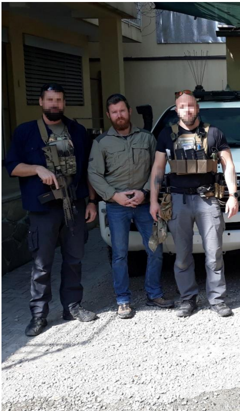
Obrázek 2: Příslušníci ochranného týmu.

police AČR v počtu 15 osob, 10 příslušníků tvořilo dva ochranné týmy a zbylých 5 osob pak logistické zabezpečení jednotky KAMBA. Vojenská policie převzala operační úkol od 601.skupiny speciálních sil z Prostějova, kteří na ambasádě působili od února roku 2010, kdy tento nelehký úkol převzali od Útvaru rychlého nasazení PČR. V rámci přípravy na předání proběhly tři rotace, kdy jednotka byla složena jak z příslušníků 601.skss tak příslušníků Vojenské policie. V tomto období měli možnost vybraní příslušníci VP načerpat zkušenosti a informace z předešlých let, kdy měla na starosti tento úkol 601.skss. Zajímavostí byl status členů ochranného týmu v místě nasazení. Všichni členové ochranného týmu byli v zemi na diplomatická víza, při vstupu do země se prokazovali diplomatickým pasem a byla jim propůjčena nejnižší diplomatická hodnost „ attaché “. Ochranný tým nebyl součástí mise NATO na území Afghánistánu a nepodléhal velení mise RS (Resolute Support). Díky těmto skutečnostem byl ochranný tým odkázán zabezpečovat si veškeré své potřeby nezbytné pro chod jednotky pouze a jen vlastními silami. Právě tato specifika nasazení byla důvodem pro stanovení výběru osob vhodných pro zařazení do jednotky KAMBA.