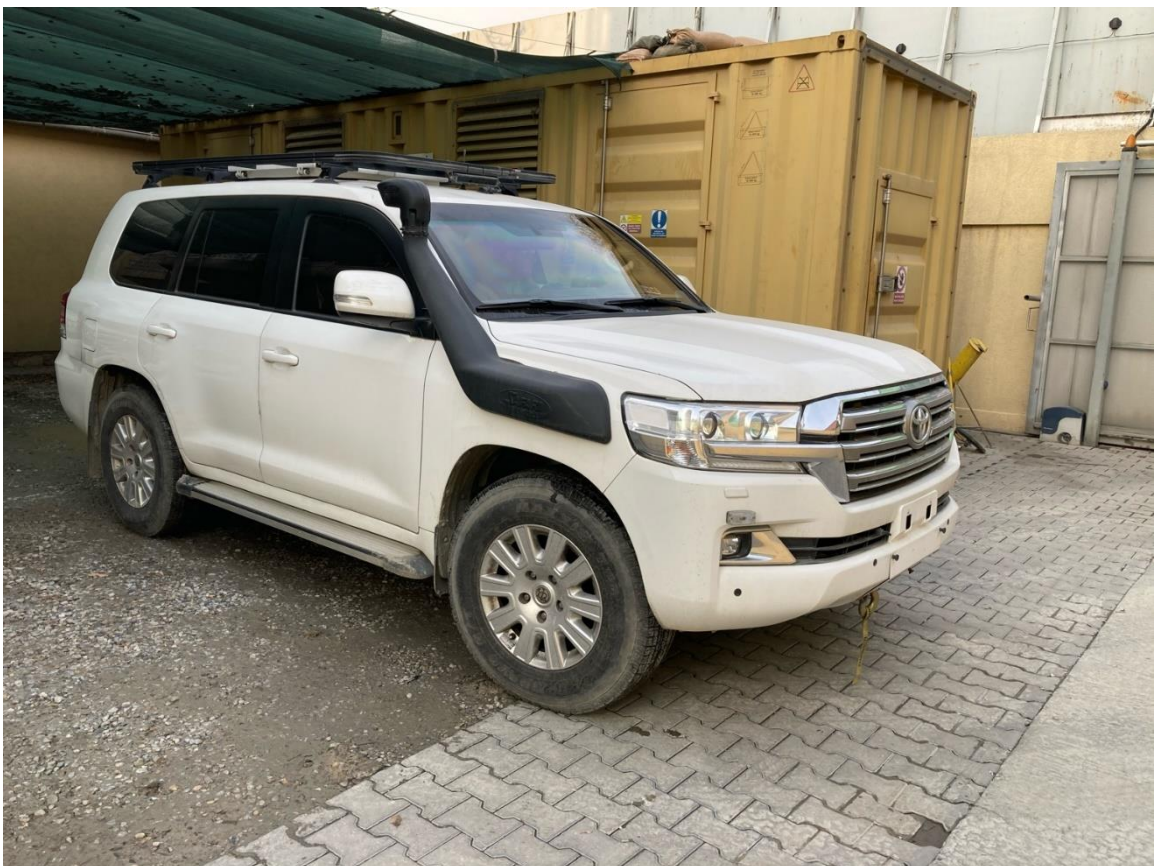
Obrázek 4: Vozidlo Toyota LC 200.

Pro jednotku KAMBA byla vyčleněná vozidla: 4x Toyota LC 100/200 (2 ks v pancéřovém provedení), 1x Toyota Hilux, 1x Škoda Octavia, 1x VW Carevelle/Transporter a 1x VW Crafter. 15