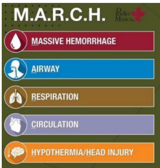
Obrázek 11: M.A.R.C.H.