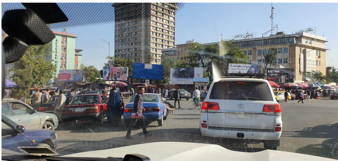
Obrázek 13: Doprava v místě nasazení.

Téma 3 školení před výjezdem do zahraničí (specifika řízení vozidel v prostoru nasazení) 49 si klade za cíl seznámit řidiče s aktuální situací v místě nasazení s využitím zkušeností řidičů předchozích rotací. Jelikož pojetí silničního provozu oproti zvyklostem a pravidlům řízení vozidel v evropských zemích je velice odlišné, je třeba využít všech dostupných prostředků pro seznámení a vytvoření představy silničním provozu v místě nasazení. Jako velice vhodná metoda se osvědčilo studium záznamu palubních kamer, které jsou ve vozidle umístěny. Společně s komentářem osoby, která již v ochranném týmu působila na pozici řidič-ochránce dokážeme vytvořit reálný pohled na situaci kterou můžeme očekávat.