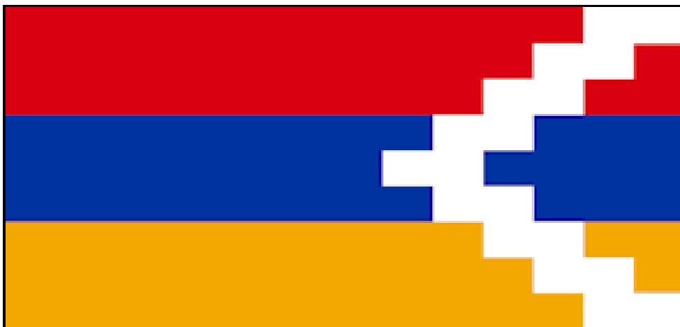
Obr.1 Vlajka Náhorně-karabašské republiky