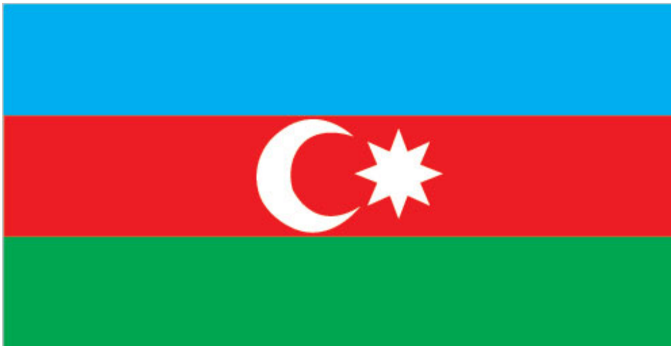
Obr. 4 Vlajka Ázerbájdžánu