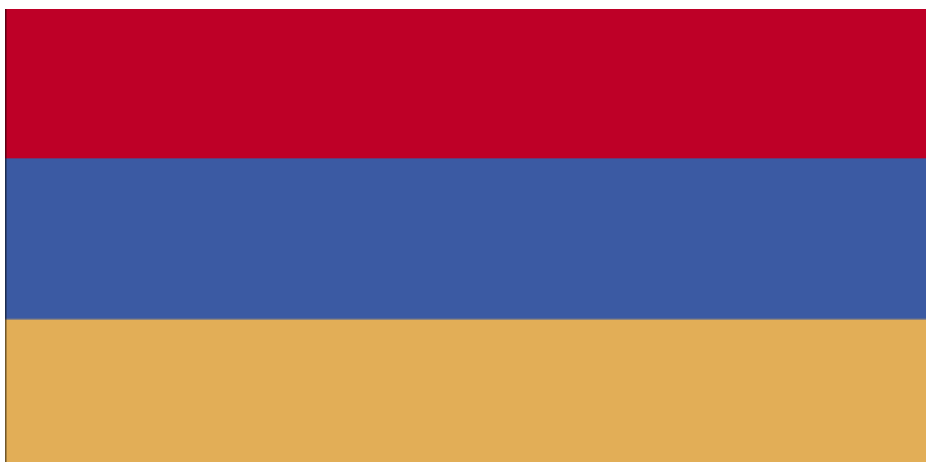
Obr. 5 Vlajka Arménie