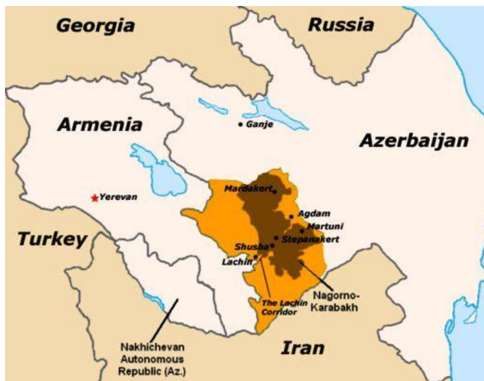
Obr. 2 Poloha Náhorniho Karabachu a okupované území Ázerbájdžánu Armény

http://www.globalsecurity.org/military/world/war/nagorno-karabakh.htm