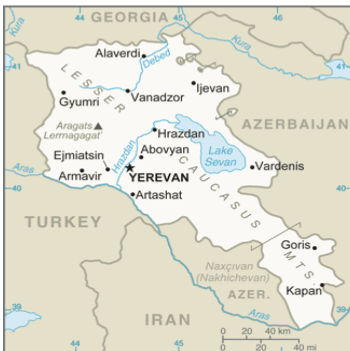
Obr. 6 Poloha Arménie

https://www.cia.gov/library/publications/the-world-factbook/geos/am.html