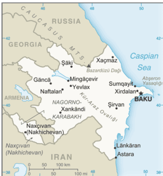
Obr. 4 Poloha Ázerbájdžánu

https://www.cia.gov/library/publications/the-world-factbook/geos/aj.html