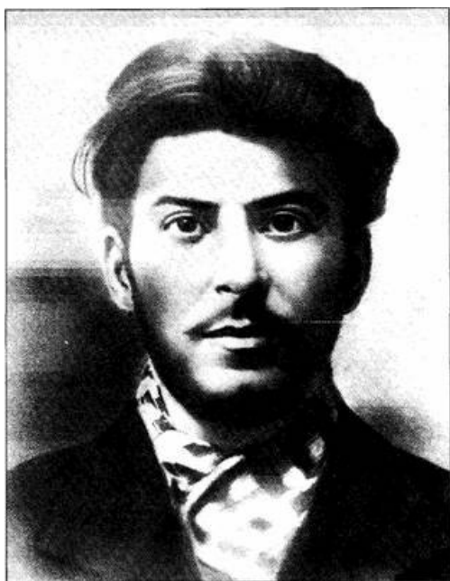
Portrét z doby Stalinova prvního zatčení