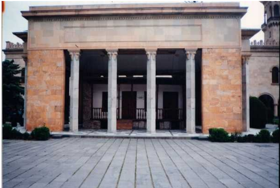
Mramorová konstrukce nad Stalinovým rodištěm v Gori