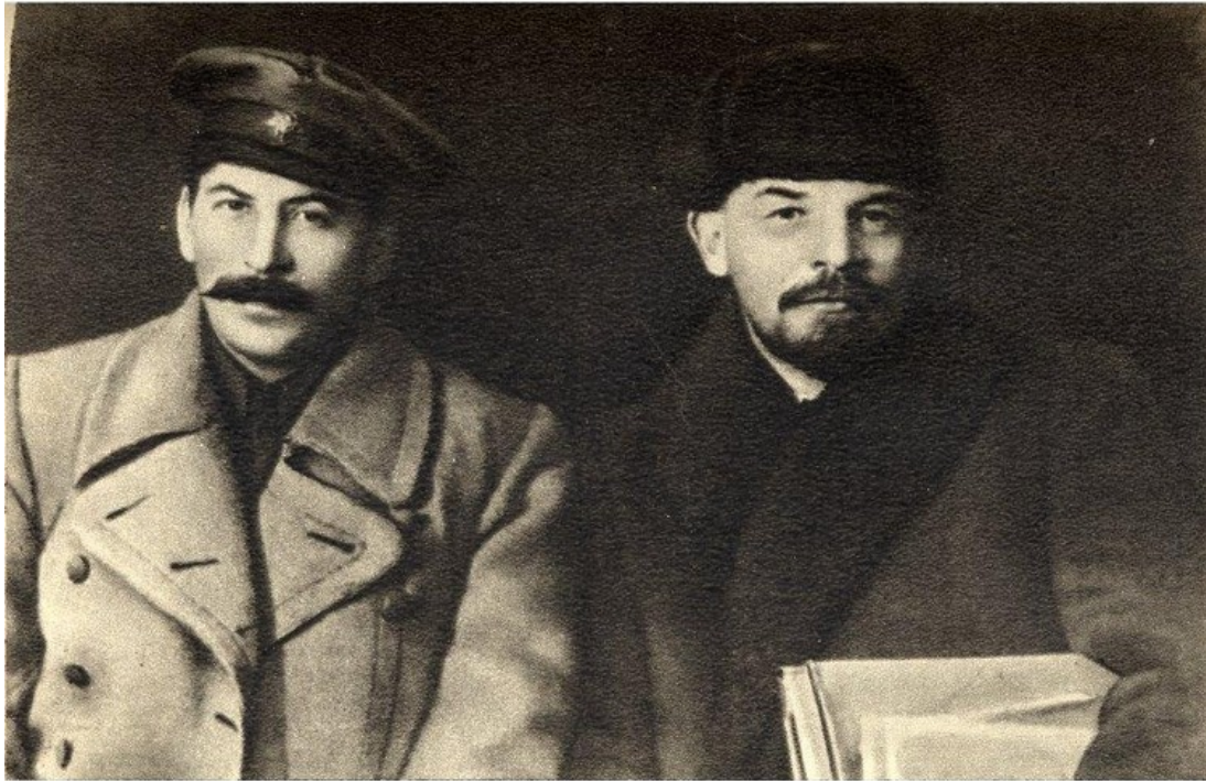
Stalin s Leninem za jejich revolucionářské éry