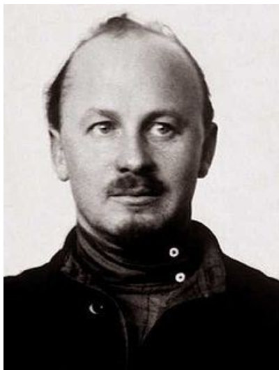
Nikolaj Ivanovič Bucharin