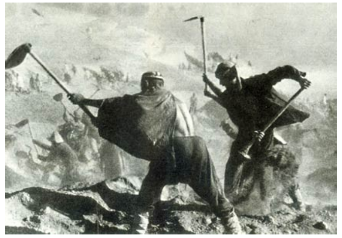
Podmínky v pracovních táborech byly ošřesné, pro miliony to znamenalo smrt