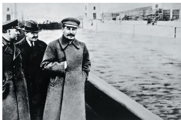
Takto mizeli Stalinovi blížci z historie: Fotografie s Nikolajem Ježovem a stejná bez něj