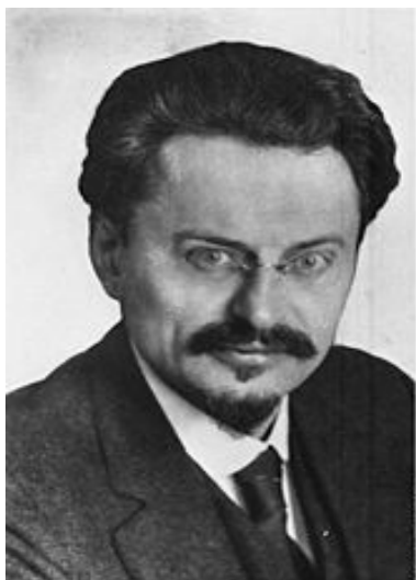
Le v Davidovič Trockij