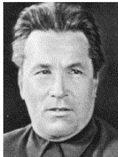
Sergej Mironovič Kirov