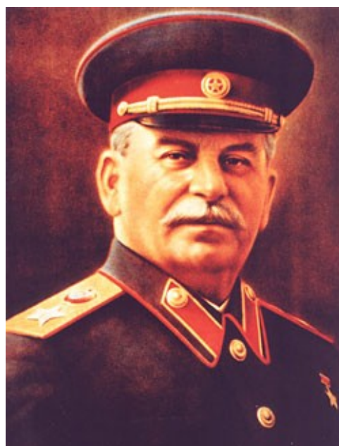
Jeden z posledních Stalinových portrétů