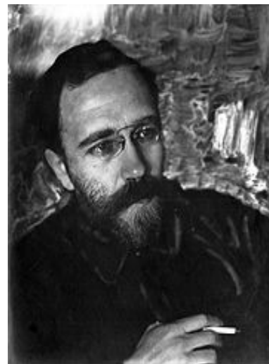
Lev Borisovič Kameněv