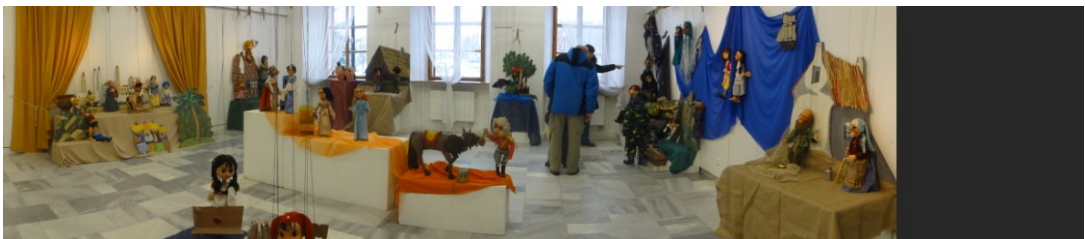
Panoramatický pohled na výstavu