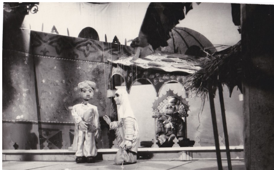
Fotografie ze hry Drak pocházející z 50. let