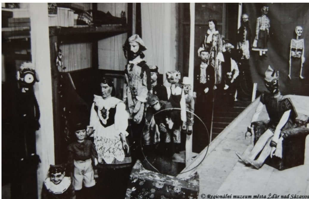
Fotografie zachycující uložení loutek v Sokolovně