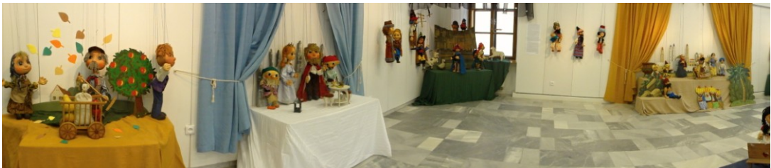
Panoramatický pohled na výstavu