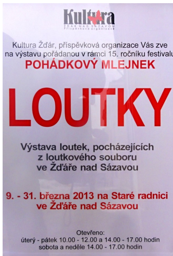
Plakát na výstavu loutek