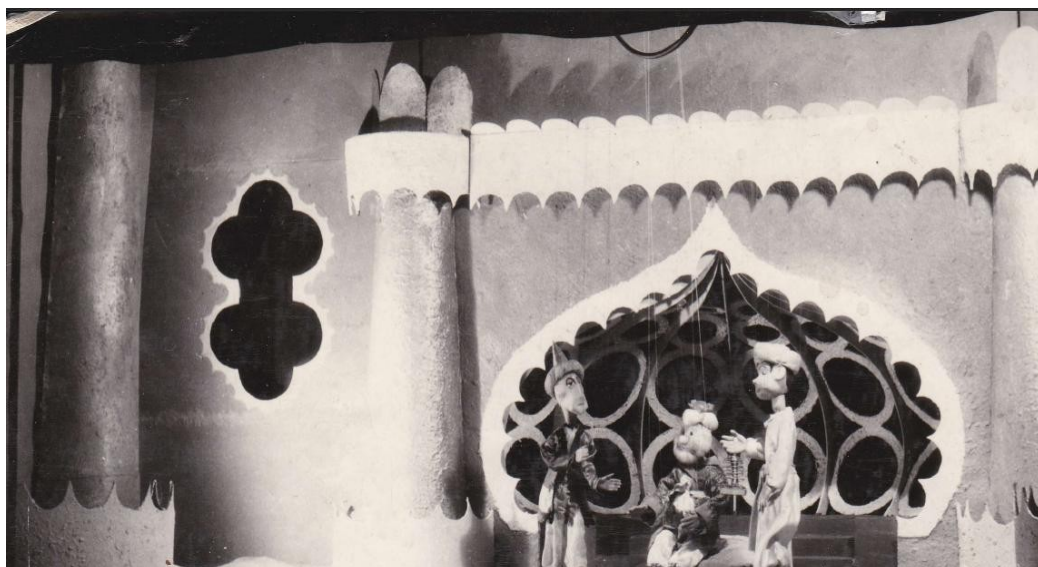
Fotografie ze hry Drak pocházející z 50. let