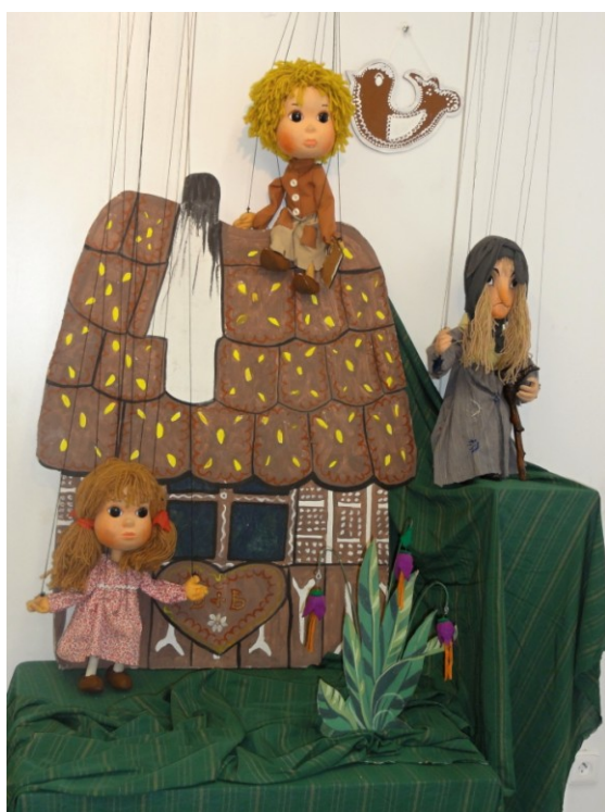
Soubor marionet pro pohádku Perníková chaloupka