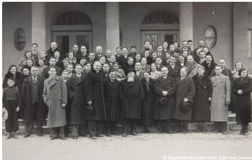
Účastníci loutkářské školy Sokolské Župy Havlíčkovi v Městě Žďáře v roce 1936