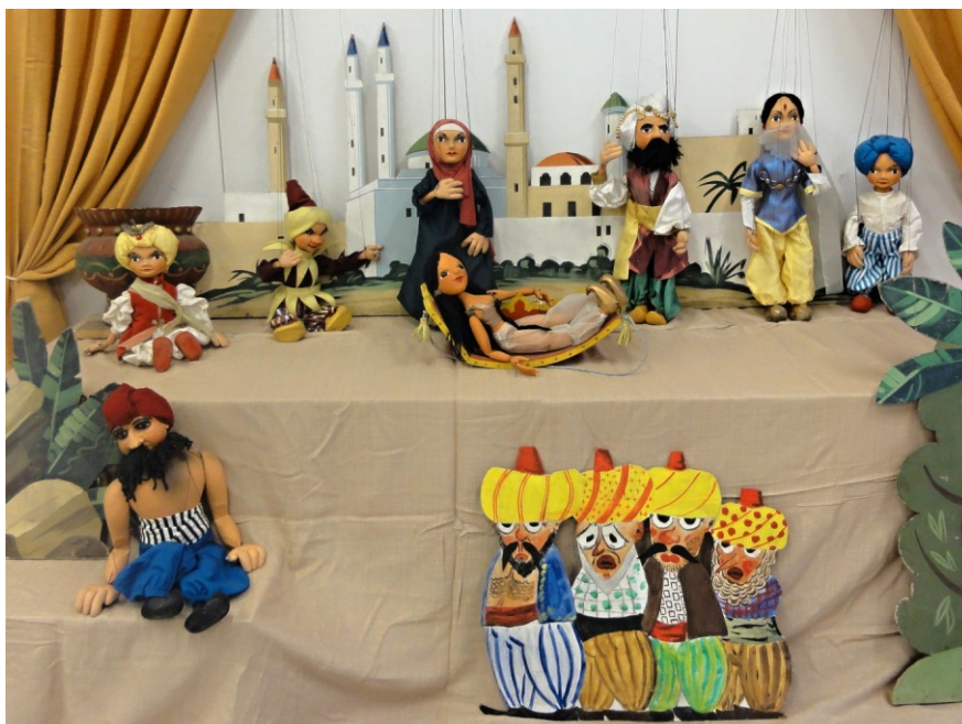
Soubor marionet pro pohádku Šuki a Muki čili Čarovné bačkory