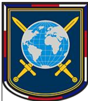
Obrázek 2: Logo ředitelství mezinárodní policejní spolupráce 33