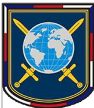
Obrázek 2: Logo ředitelství mezinárodní policejní spolupráce 33