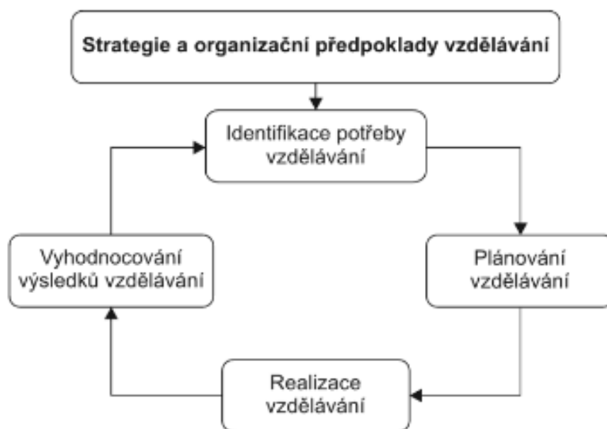
Obrázek 1 Cyklus systematického vzdělávání zaměstnanců