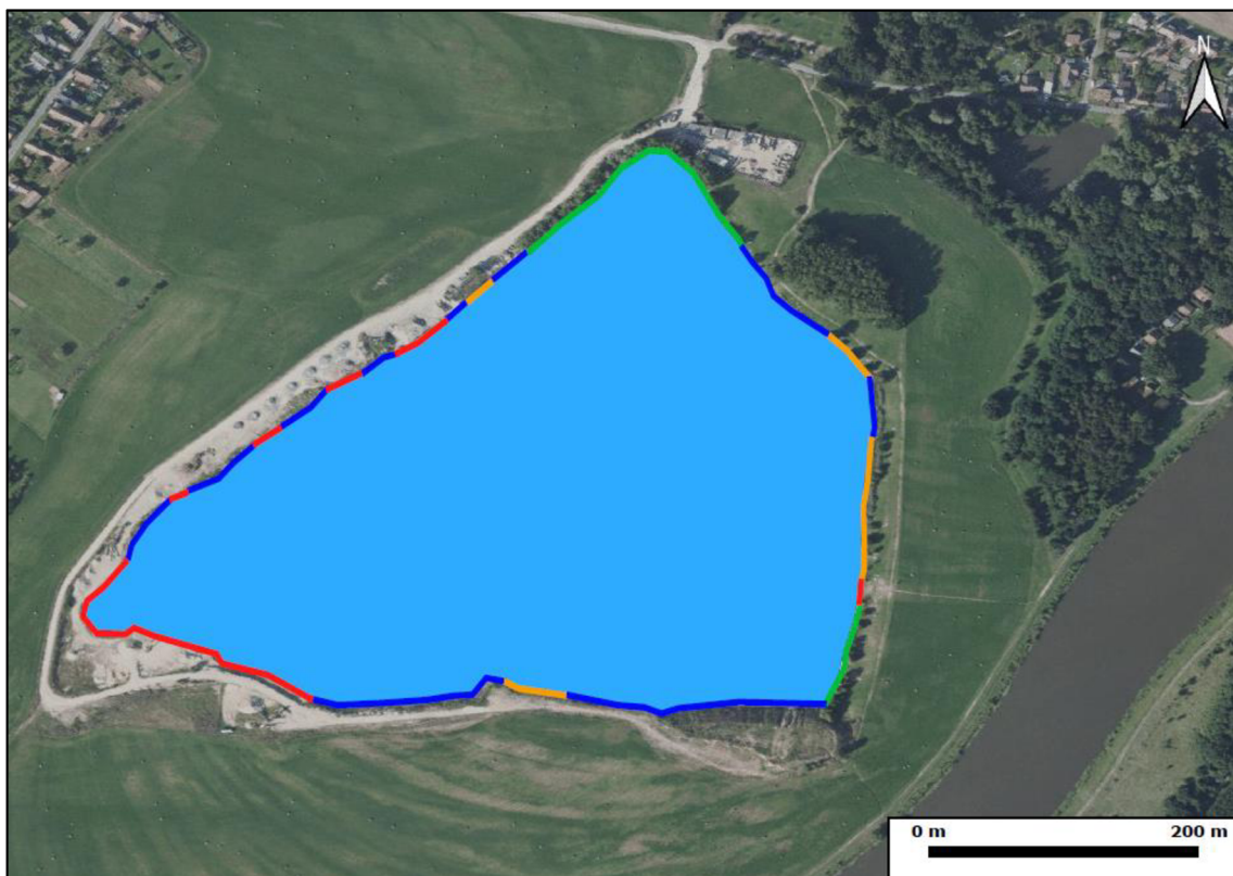
Obrázek 3 Vizualizace pískovny Kostomlátky v programu QGIS. Barevně jsou znázorněny délky jednotlivých porostů a holé země. Zelenou barvou je vyznačena délka dřevinné vegetace, oranžovou křovinná vegetace, modrou porost trávy a červenou holá země (obrázek byl vytvořen pomocí programu Inkscape).