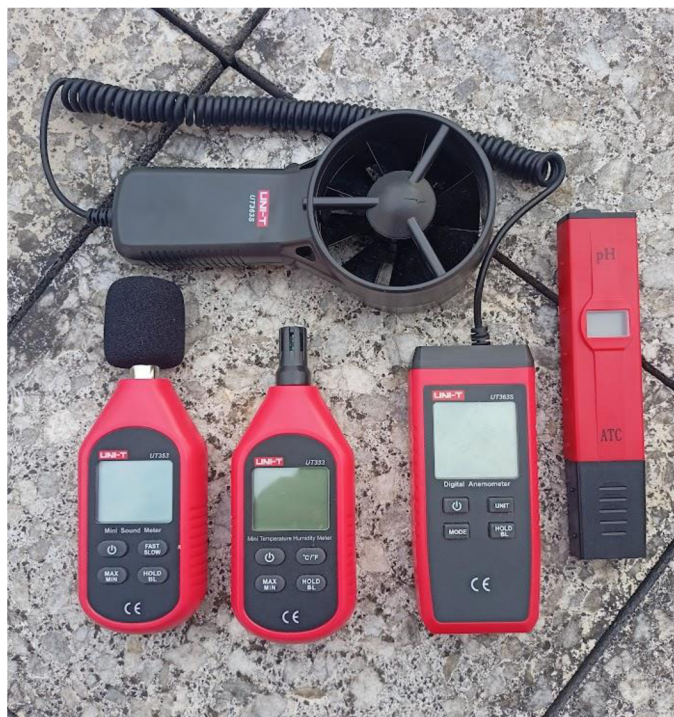
Obrázek 2 Přístroje použité k měření proměnných prostředí (zleva: UNI-T UT 353, UNI-T UT 333, UNI-T UT 363S, pH metr ATC pH-2011).

U vodního prostředí byla sledována hodnota pH, která byla měřena pH metrem ATC pH-2011 (Obrázek 2). Dále byla měřena plocha a obvod vodních ploch a šířka koryta řeky. Byla také zjišťována přítomnost a počet různých nevodních prvků ve vodě, jako jsou ostrůvky, kůly nebo budky. Na vodní hladině byl pozorován výskyt vodních rostlin a u břehů vodních ploch byl sledován výskyt rákosu.