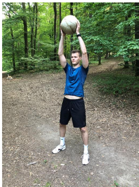
Obrázek 16. Podřepy s medicinbalem