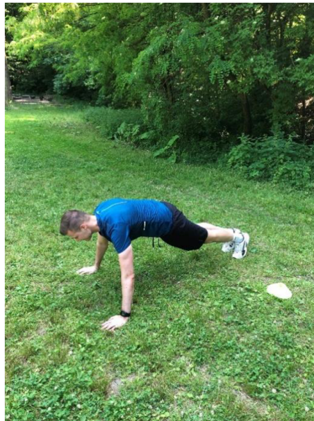
Obrázek 4. „Angličáky“