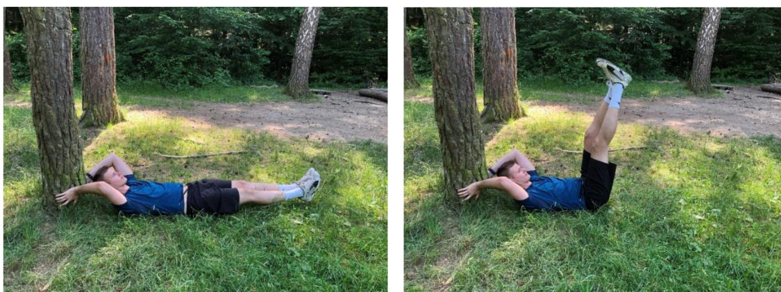
Obrázek 12. Přednožování v lehu

Výchozí polohou je leh, rukama se chytíme za hlavou stromu (Obrázek 12). Po zahájení cviku zvedáme propnuté nohy nahoru do pravého úhlu s trupem. Potom nohy opět pokládáme směrem zemi tak, aby zůstali asi 15 cm nad povrchem. Cvik stejným způsobem opakujeme. Je důležité, aby po čas cvičení zůstala bedra v kontaktu se zemí. To můžeme zajistit lehkým přizvednutím hlavy.