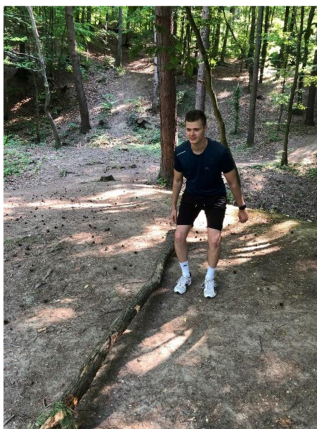
Obrázek 10. Přeskoky přes překážku