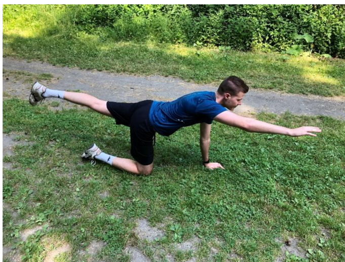
Obrázek 7. Vzpažení, zanožení ve vzporu klečmo