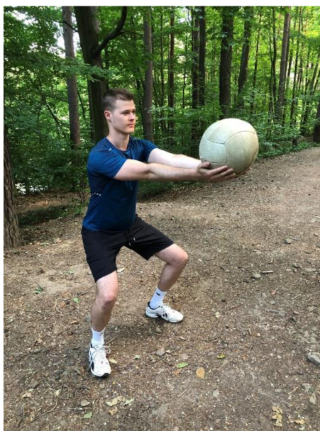
Obrázek 21. Výdrž v podřepu s medicinbalem