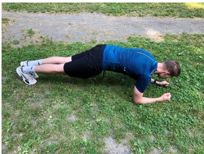
Obrázek 6. „Prkno“