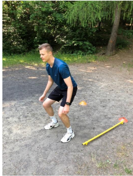
Obrázek 1. Skoky do dálky