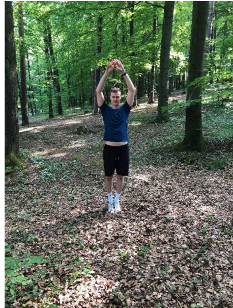
Obrázek 13. „Skákající panák“