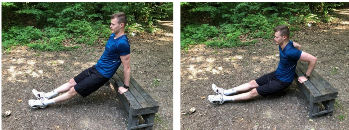
Obrázek 18. Tricepsově kliky na lavičce

Výchozí polohou je vzpor vzadu ležmo, ruce na lavičce, paty se dotýkají země. Hýždě posuneme mírně před lavičku (Obrázek 18). V této pozici začneme provádět mírný klik nebo až klik. Během tohoto pohybu dbáme na to, aby nám lokty neuhýbaly do stran a cvik jsme prováděli kontrolovaně. Jakmile se dostaneme těsně nad zem, zvedáme se zpět do výchozí pozice.