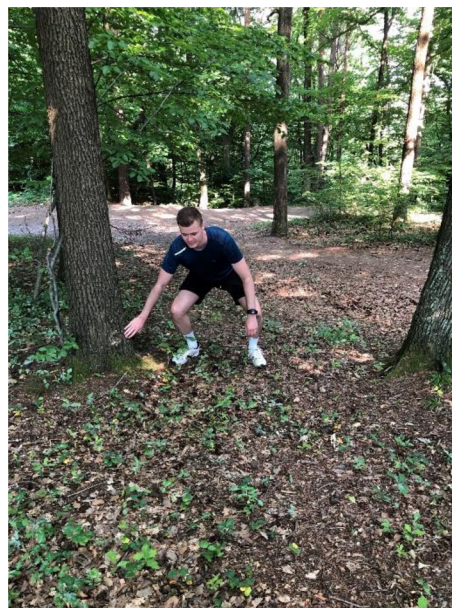
Obrázek 14. Výpady stranou v podřepu