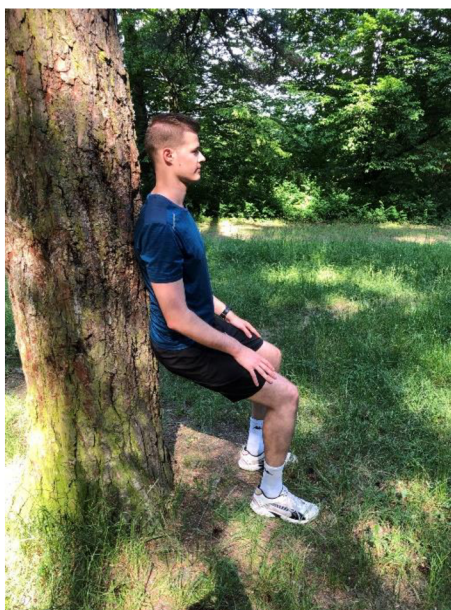
Obrázek 9. Výdrž v podřepu s oporou zad