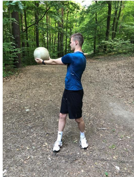
Obrázek 20. „Ruský vrut“