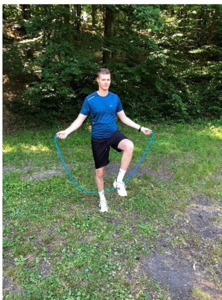
Obrázek 2. Skoky přes švihadlo s „vysokými koleny“