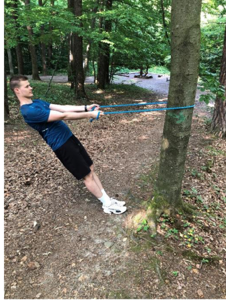
Obrázek 15. „Bicepsové přitahy“ s pomocí švihadla