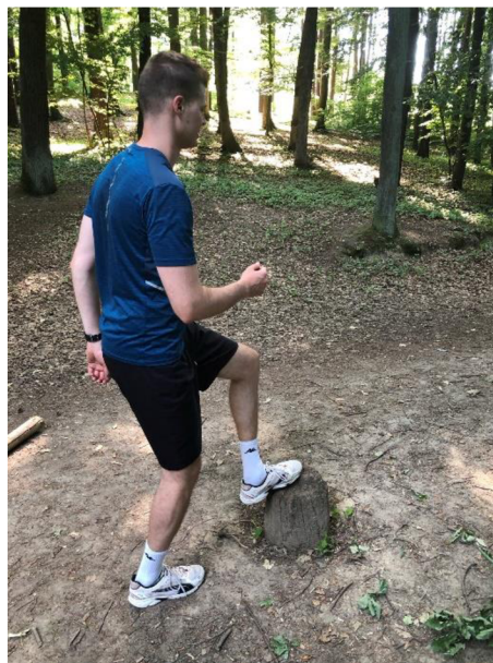
Obrázek 19. Našlapování na pařez