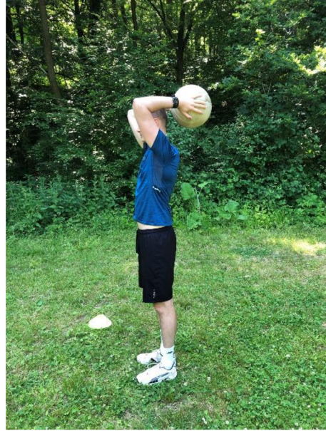
Obrázek 5. „Tricepsová extenze“