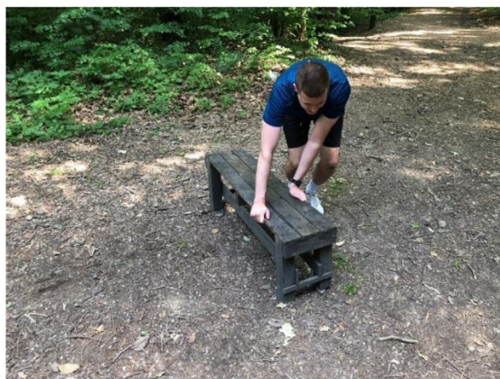
Obrázek 17. Přeskoky snožmo přes lavičku