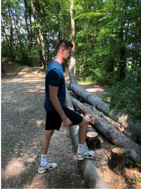
Obrázek 8. Výstup na kládu