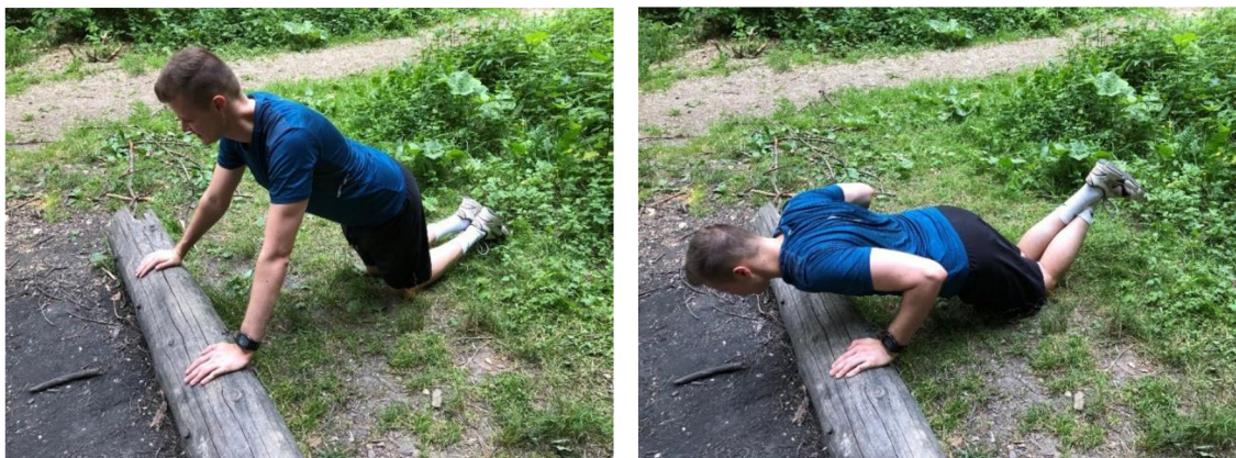
Obrázek 11. Kliky

Výchozí polohou je vzpor ležmo / vzpor klečmo, ruce na kládě (Obrázek 11). Z výchozí pozice začneme dělat kliky. Lokty svírají s trupem úhel asi 45°. Záda jsou rovná a břicho zpevněné, aby nedošlo k prohnutí a „zabíraly“ pouze paže.