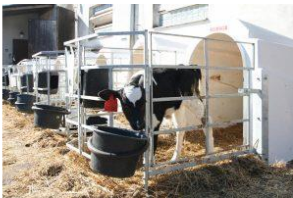
Obrázek 4.4: Individuální ustájení telat