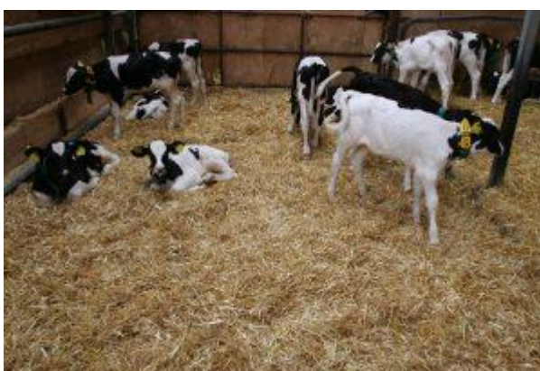
Obrázek 4.5: Skupinové ustájení telat