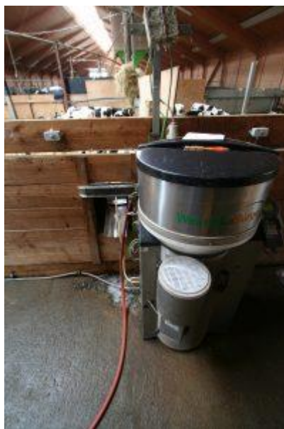
Obrázek 4.1: Mléčný krmný automat pro telata

Mléčné krmné automaty jsou považovány za dobrý způsob napájení telat šetřící pracovní sílu a umožňující telatům přirozenější chování v podobě sání spojeného s uspokojením sacího reflexu. V konvenčním chovu mléčného skotu se telata často krmí pouze dvakrát denně, což vede k velikosti jedné krmné dávky mléka 4 l nebo více na jedno krmení. Tento management krmení mléka kontrastuje s přirozeným kojením telete ustájeného s matkou. Ve skupinovém ustájení telat s mléčným krmným automatem mají telata umožněný volný přístup k automatu, což vede ke konzumaci až 7 - 10 menších dávek ve kterých je rozdělená celková denní krmná dávka mléka (De Passillé et al., 2011). Podávání mléka telatům je fyziologické a zároveň lze určit individuální krmnou dávku v různě velkých porcích a časových intervalech podle nároků jednotlivých telat založených na jejich živé váze a věku. Mléčný krmný automat podává telatům velkou denní dávku mléka rozdělenou do více menších krmných dávek. Tento systém zkrmování umožňuje přirozenější chování při krmení (Jensen a Weary, 2013; Medrano-Galarza et al., 2017; Bøe a Færevik, 2003; Hepola, 2003; Strapák et al., 2013).