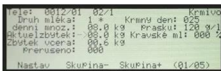
Obrázek 4.2: Monitor krmného automatu s jednotlivými údaji o krmení

Po vstoupení telete do mléčného automatu je naskenován radiofrekvenční identifikační štítek, umístěný na obojku nebo v uchu telete. Tím jsou do počítače zaznamenány jednotlivé ukazatele informující o charakteru podávané dávky a o chování telete při krmení. Mezi tyto ukazatele řadíme typ podávaného mléka, průběh krmení mléka (počáteční příděl mléka (l/d), maximální příděl mléka (l/d), zbylé množství mléka do maximálního přídělu, maximální velikost podávané dávky a minimální doba mezi jednotlivými návštěvami)), způsob odstavu (věk na začátku odstavu, délka období odstavu (dny)) a věk při úplném odstavení (Morrison, Jannelle L. et al., 2022).