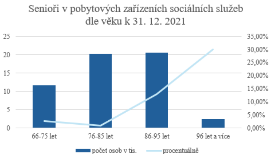
Obrázek 2: Senioři v pobytových zařízeních sociálních služeb dle věku k 31.12.2021 (vlastní tvorba)

V grafu je znázorněn počet seniorů, kteří žijí v pobytových zařízeních (zdroj: ČSÚ, 2022 [online]).