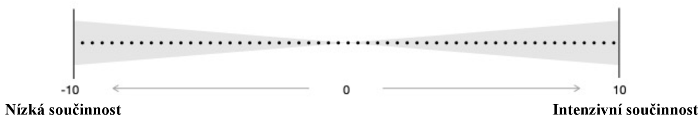
Obrázek 6: Hodnotící stupnice – součinnost zákazníka

U kritéria „rozsah projektu“ je nutné si položit otázku „ Je zákazník schopný a ochotný pravidelně spolupracovat s projektovým týmem, validovat výstupy a poskytovat rychlou zpětnou vazbu nebo naopak předpokládáme, že zapojení zákazníka v průběhu projektu bude velmi nízké? “