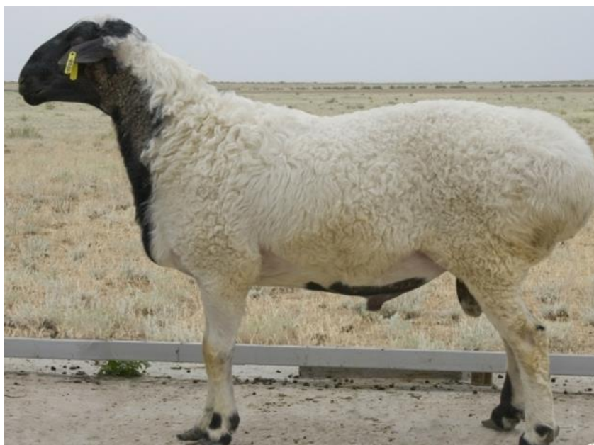
Obr. č. 4 Kalmycká ovce s tlustým ocasem [23]

Kalmycké ovce s tlustým ocasem se vyznačují vysokým růstem, silnými mohutnými kostmi, vysokými končetinami a hrubší vlnou ve srovnání s ovci s tlustým ocasem chovanými na severním Kavkaze, na Ukrajině, v Kazachstánu, Burjatsku a Mongolsku. U kalmyckých ovčí, na rozdíl od jiných ovčí s tlustým ocasem, sestával nejen ocas z tlustého tukového polštáře, ale také zadní stehna jsou vyplněna tukem. Tvorba tuku navíc začala vrstvou z bederní části, přecházela do tlustého ocasu a šla dolů do hlezenního kloubu. Zadní část jejich hlav byla holá a silně konvexní. Ovce mají dobře vyvinutý hrudní koš a jsou na jednom z prvních míst v hloubce hrudníku. Křížová kost je rovná, šířka těla je dostatečná; nohy jsou silné, s dobře vyvinutými šlachami. Navzdory velké velikosti těla ovčí plemene Kalmyk vypadají vizuálně docela kompaktně a elegantně. [10]