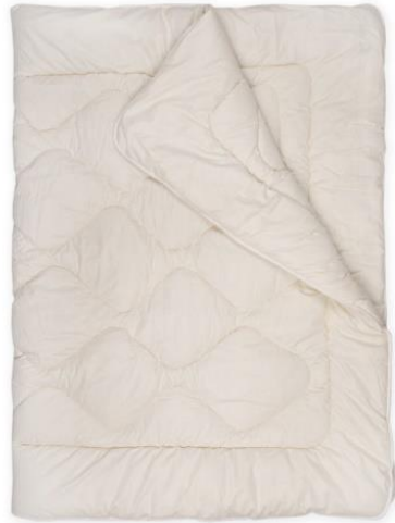
Obr. č. 7 Přikrývka z ovčí vlny merino [26]