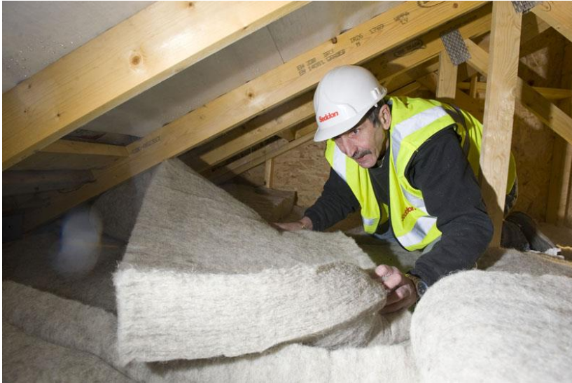
Obr. č.6 Izolace z ovčí vlny [25]