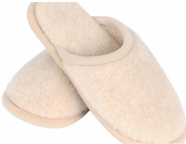
Obr. č.11 Domácí pantofle z vlny merino [30]

-Merino vlna je všestranný materiál bohatý na užitečné vlastnosti, vhodný k nošení pro lidi všech věkových kategorií. Materiál poskytuje komplexní blahodárny účinek na tělo a dodává nejen pocit tepla a pohodlí, ale má také příznivý účinek na tělo jako celek. [18]