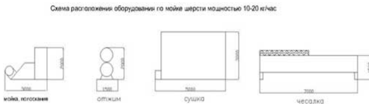
Schéma č. 2 Technologické uspořádání zařízení pro praní vlny 10-20 kg / hod

Celkové náklady na komplexní linku na zpracování vlny jsou 1.989.574 rublů. Dá se zakoupit za lepší cenu na počkání online přes čínský e-shop: https://asia-business.ru .