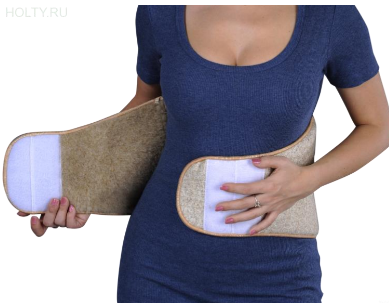
Obr. č. 8 Zdravotnický bederní pas [27]

Bez nadsázky tedy můžeme říci, že pás z ovčí vlny je po staletí nejspolehlivější a osvědčenou možností prevence a léčby nemocí spojených se zánětlivými změnami kloubů. [17]