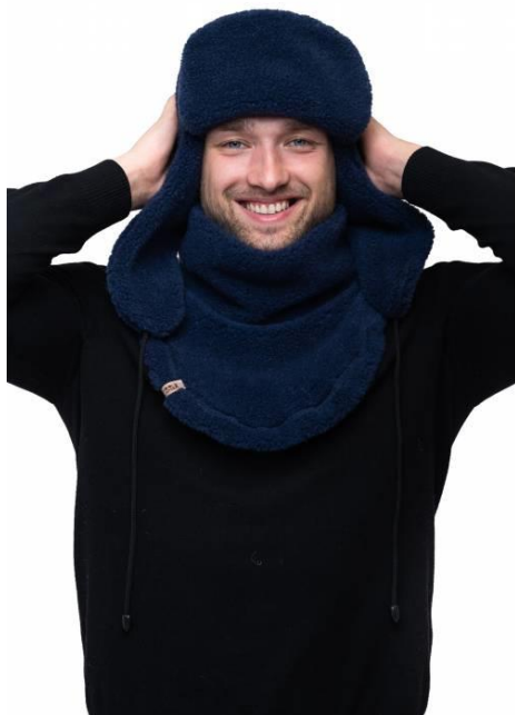
Obr. č. 10 Čepice a šála z ovčí vlny [29]