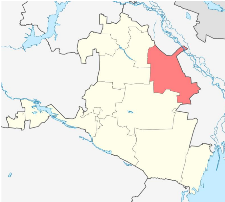
Obr. č. 3 Geografická poloha okresu [22]