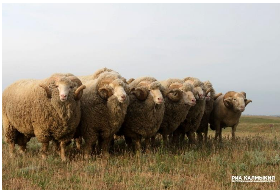
Obr. č. 5 „Černozemelskij merinos“ [24]

Dlouhodobá selekční a šlechtitelská práce skončila vytvořením nového domácího plemene ovcí jemné vlny a v souladu s rozhodnutím Státní komise Ruské federace pro testování a ochranu chovatelských výsledků ze dne 29. září 2017 ( patentové klasifikace odkazuje na směr produktivity vlny).