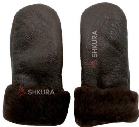
Obr. č. 9 Zimní rukavice - palčáky z ovčí vlny a kůže [28]

Jsou v Rusku hodně aktuální kvůli silným mrazům v zimě.