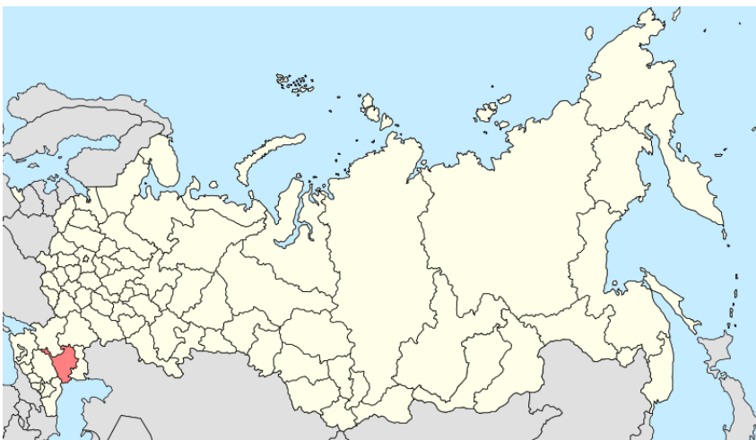
Obr. č. 2 Geografická poloha Kalmycka [21]

Kalmycká republika; Kalmycko je republikou Ruské federace. Nachází se severně od Kaspického moře. Její rozloha je 75 000 km 2 (přibližně jako Česká republika), počet obyvatel je ale jen 289 400.[6] Je jediným evropským regionem s převahou buddhistů. [5]