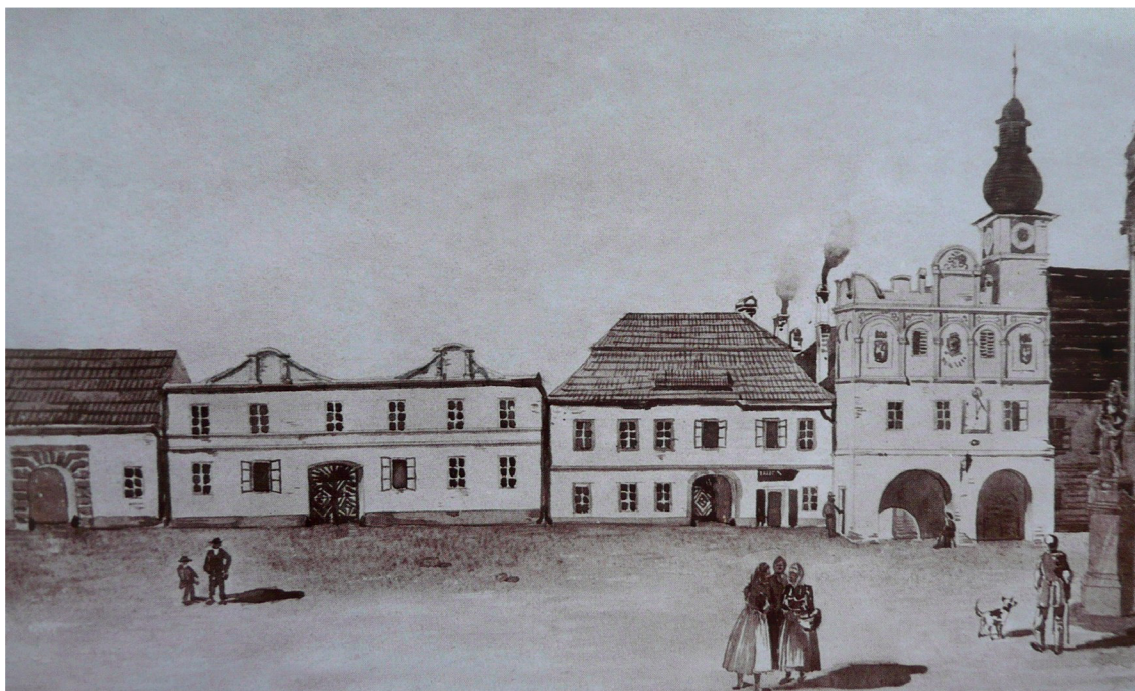
Obr. 10: Západní strana Volyňského náměstí, polovina 19. století