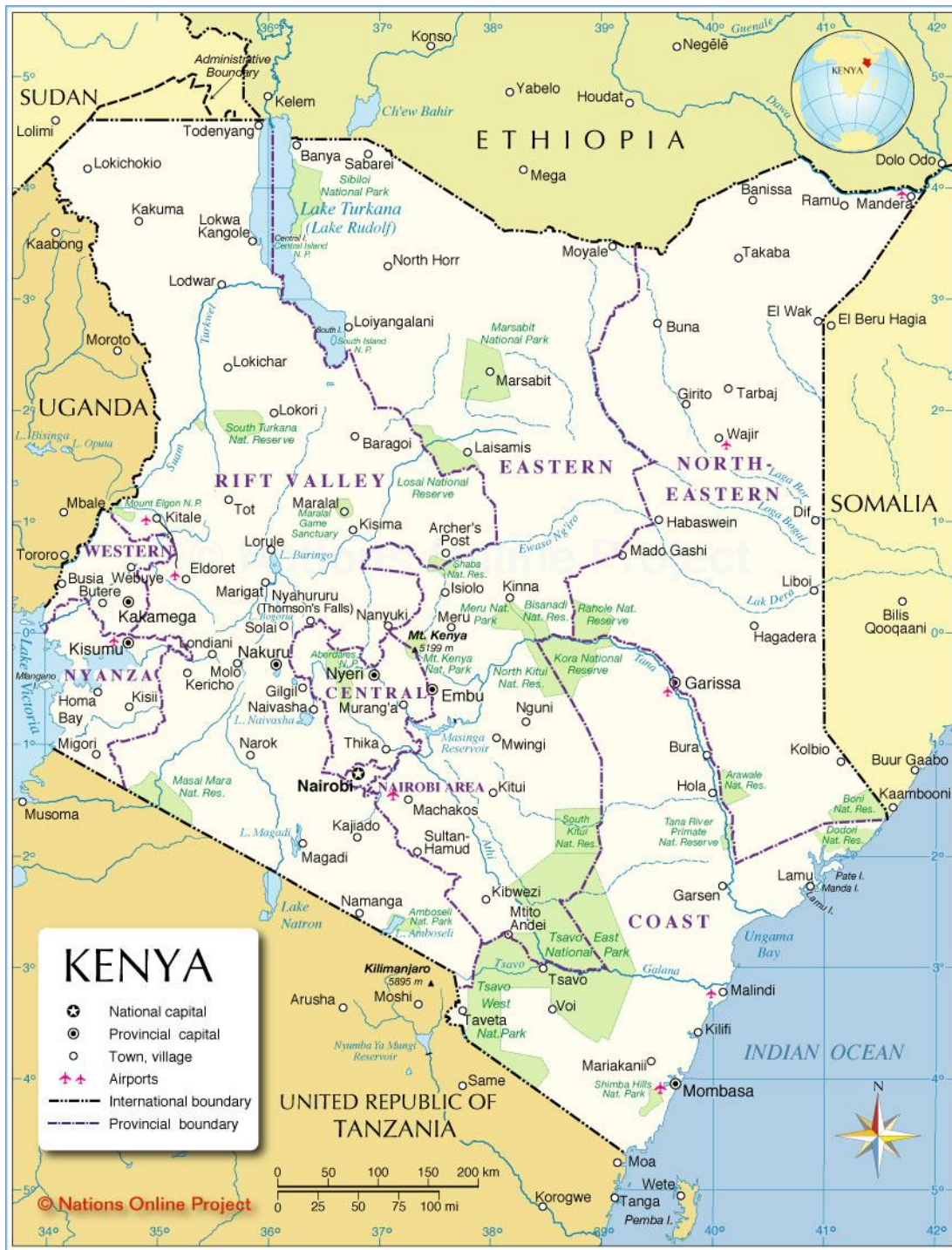
Příloha č. 2: Bývalé administrativní rozdělení Keni zahrnující provincii Pobřeží.