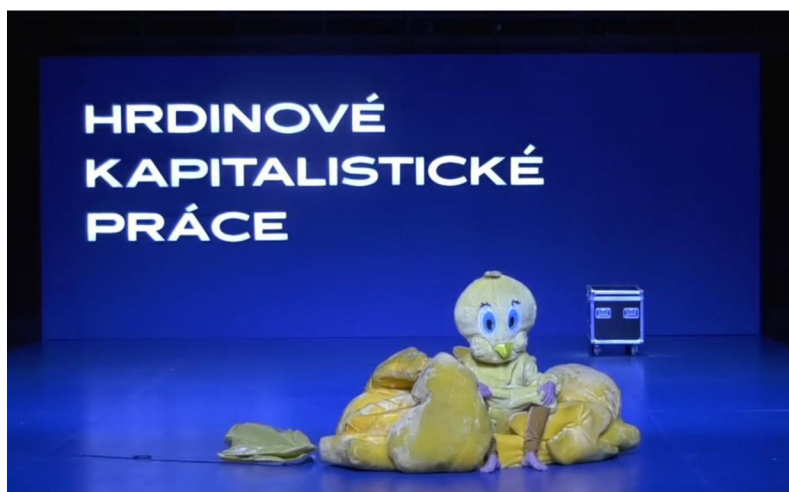
Obr. 4. Kostýmové určení práce v drůbežárně. I. Uhlířová. Záběr ze záznamu z představení.