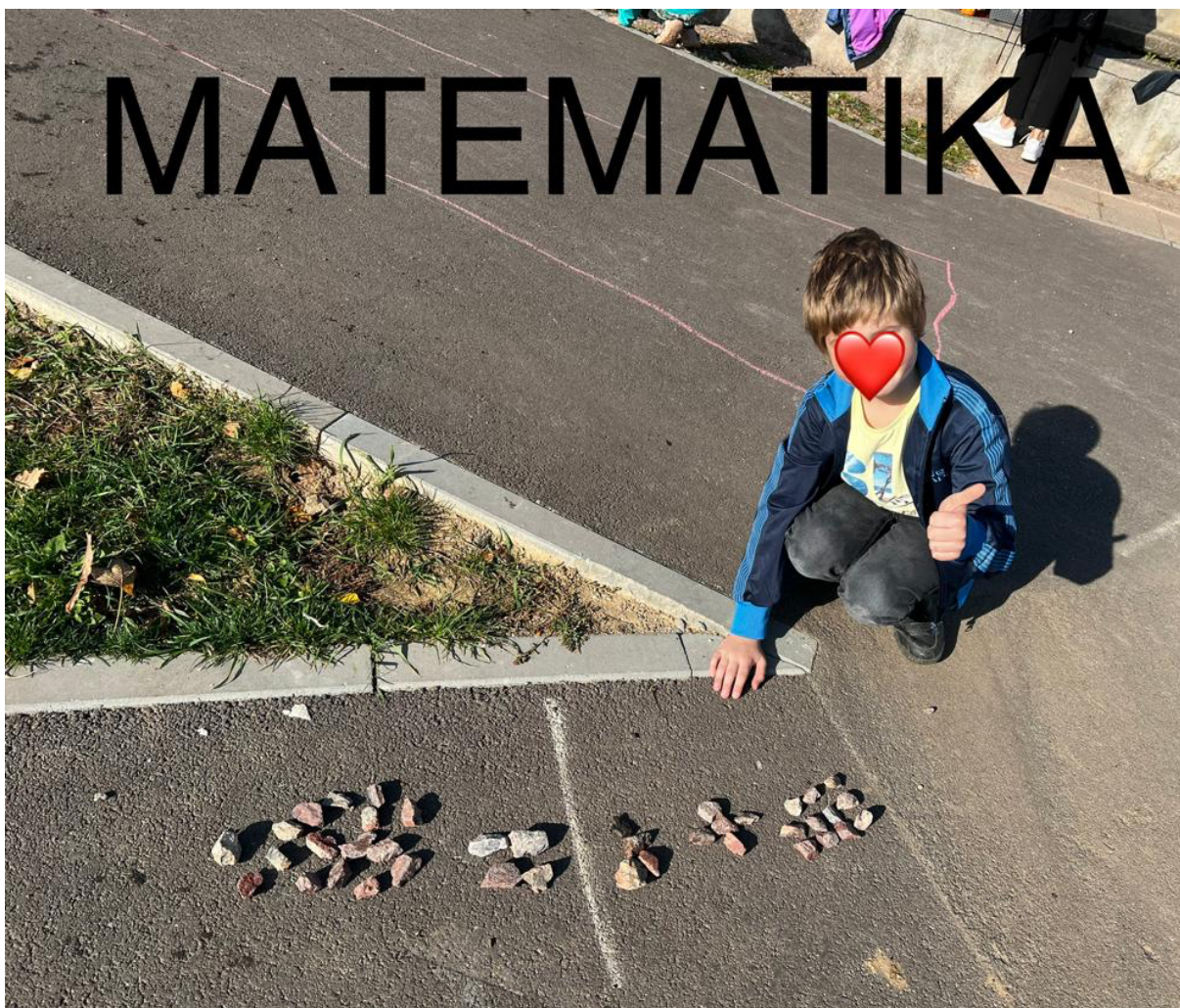
Obr. č. 2 – Žák školy v Lomnici při matematice

Třída, do které chodí oba respondenti, je poskládána z 6 žáků (2 chlapců, 4 děvčata). Ve třídě je přítomen asistent pedagoga, který se zaměřuje na pomoc dětem s výukou. Je dětem k dispozici nejen o vyučování, ale také o přestávkách. Sedí úplně vzadu a buďto děti obchází, nebo se zdržuje vzadu, pozoruje jejich výuku a děti se mu přihlásí v případě, že potřebují pomoc. Každý žák zde sedí sám v lavici.