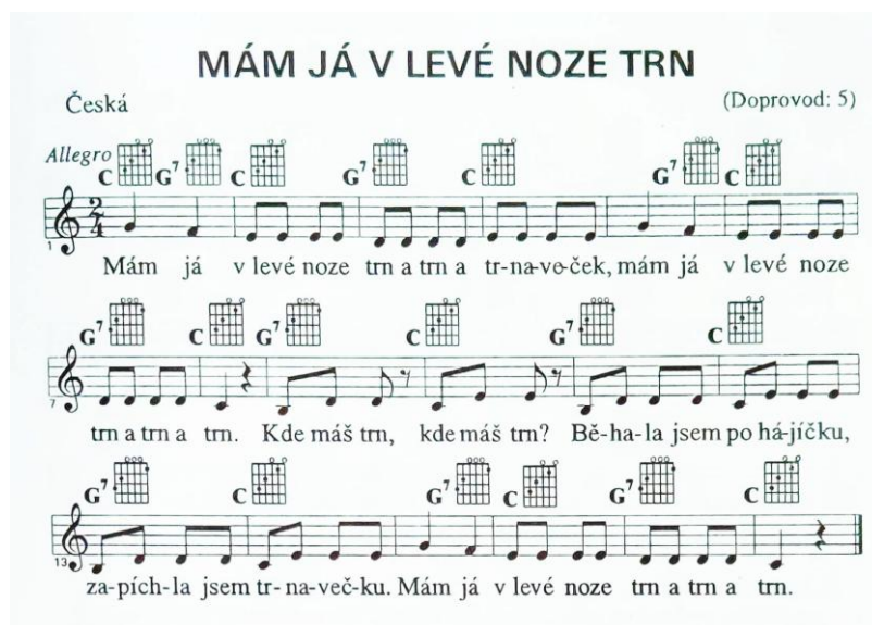
Obrázek 10: Notový záznam písně Mám já v levé noze trn (Jánský, 1994, s. 39)

Lidová píseň: Mám já v levé noze trn (česká lidová píseň)