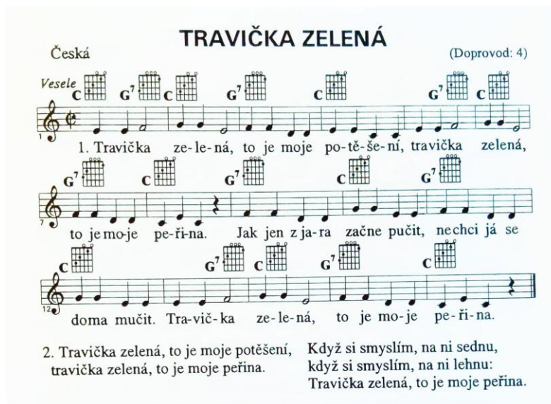
Obrázek 12: Notový záznam písně Travička zelená (Jánský, 1994, s. 71)

Lidová píseň: Travička zelená (česká lidová píseň)