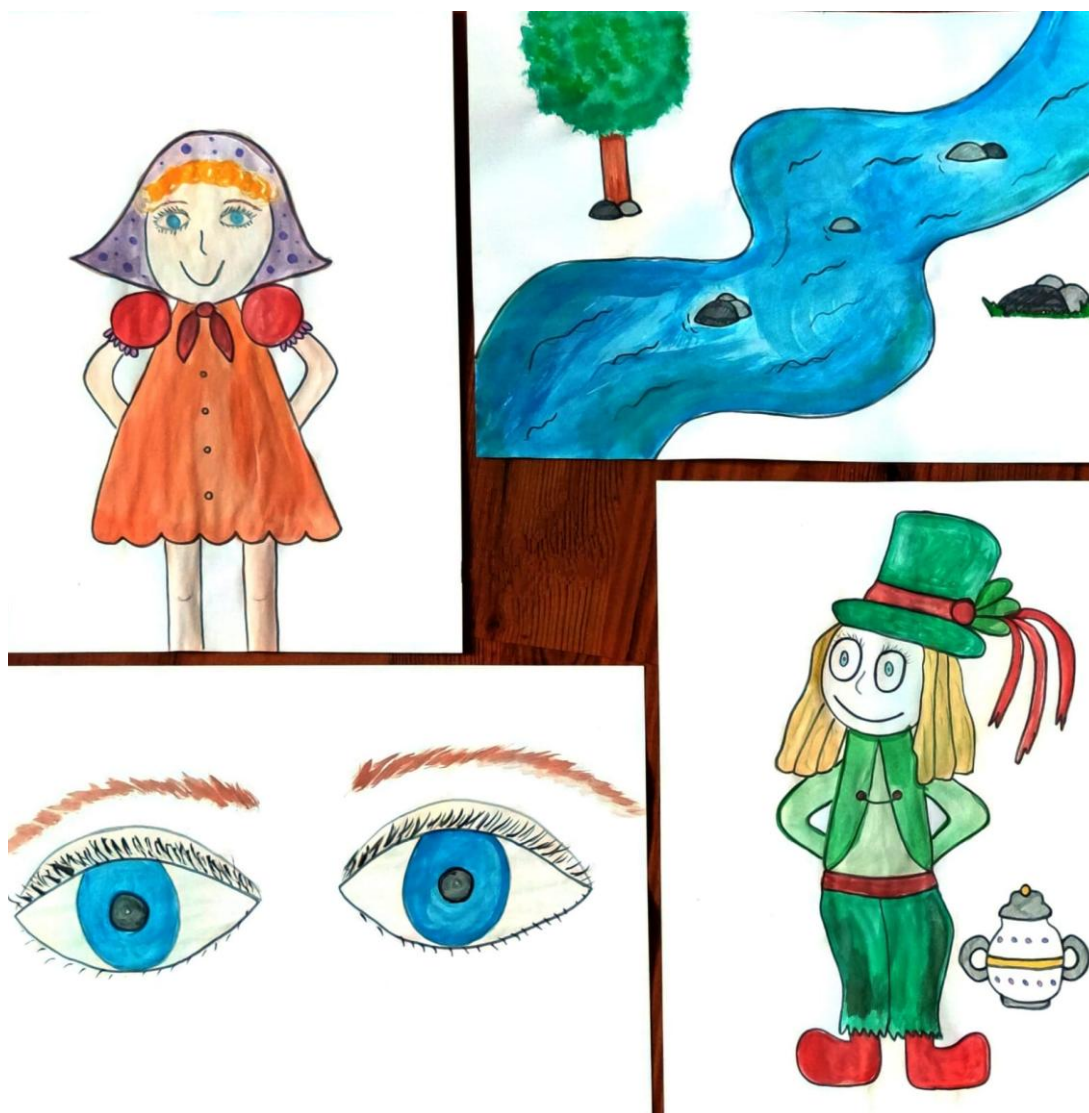
Obrázek 6: Pomůcky (Hra na detektiva s obrázky), Liberec, 20.3.2021

Pomůcky: tematické obrázky z písňe (vhodnější na větším formátu), klavír