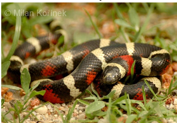
Obrázek 17 – Korálovka pruhovaná