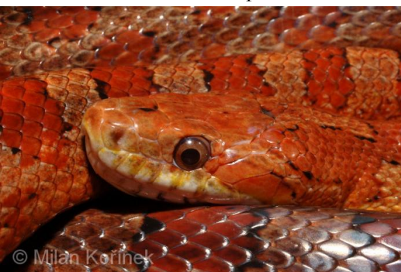
Obrázek 21 – Užovka červená