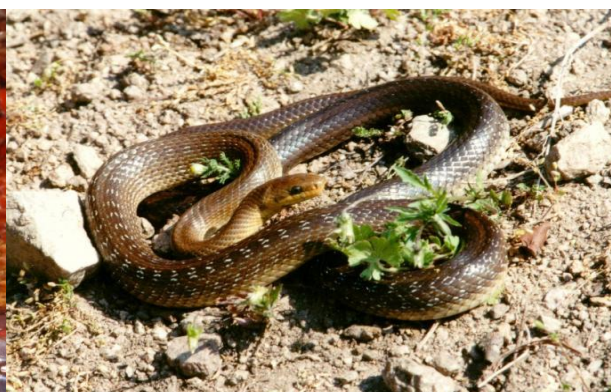
Obrázek 22 – Užovka stromová