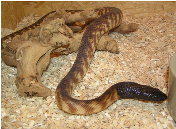
Obrázek 9 – Krajta černohlavá