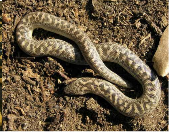
Obrázek 8 – Hroznýšek turecký