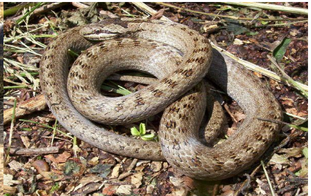
Obrázek 14 – Užovka hladká