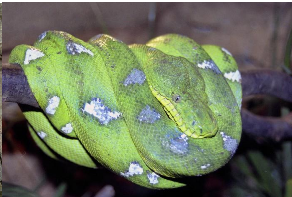
Obrázek 4 – Psohlavec zelený