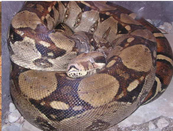
Obrázek 2 - Hroznýš královský