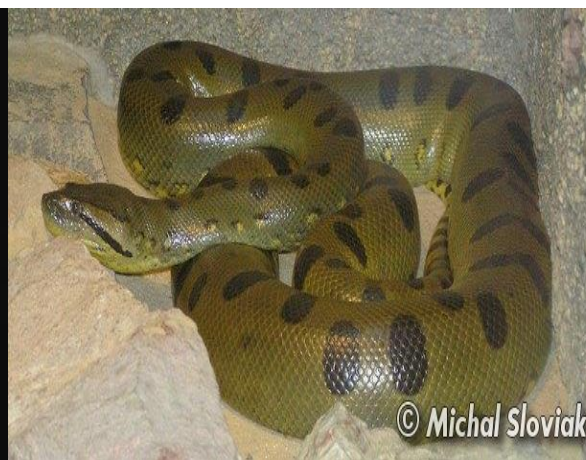
Obrázek 6 – Anakonda velká