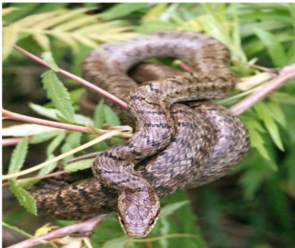
Obrázek 15 – Užovka stepní