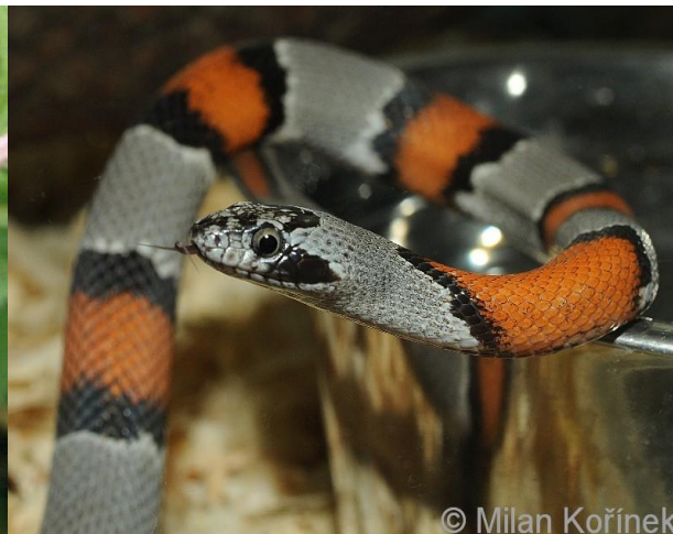
Obrázek 16 – Korálovka šedá