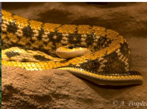
Obrázek 20 – Užovka tenkoocasá