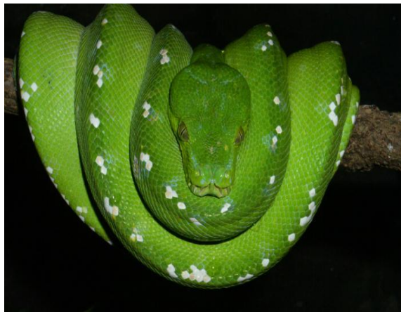
Obrázek 11 – Krajta zelená