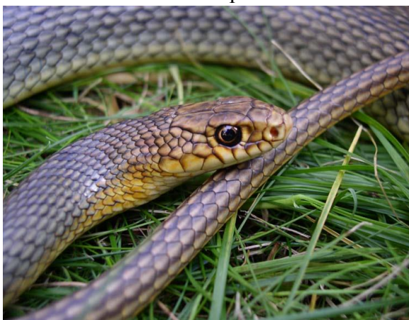
Obrázek 19 – Štíhlovka kaspická