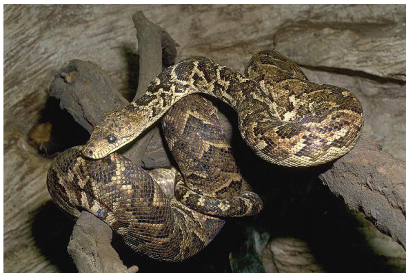
Obrázek 3 – Hroznýšovec kubánský