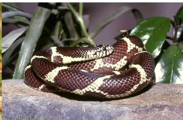
Obrázek 18 – Korálovka sedlatá