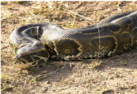
Obrázek 13 – Krajta písmenková