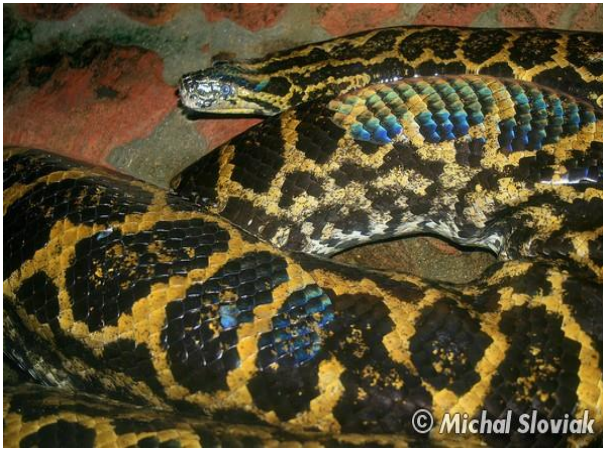
Obrázek 7 – Anakonda žlutá