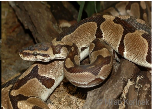
Obrázek 12 - Krajta královská