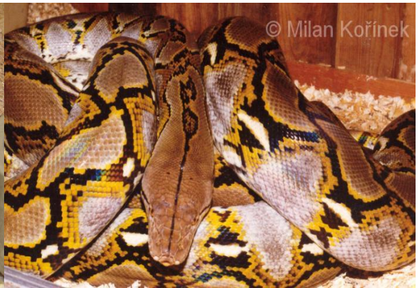
Obrázek 10 – Krajta mřížkovaná