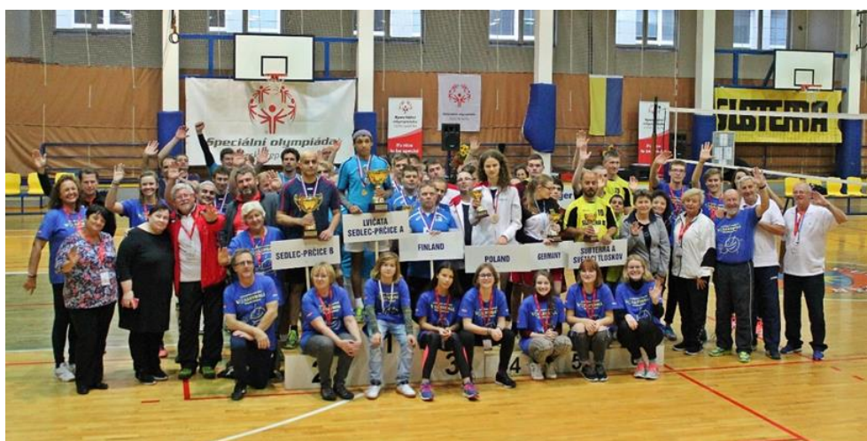
Zdroj: Foto autorka práce, 2022