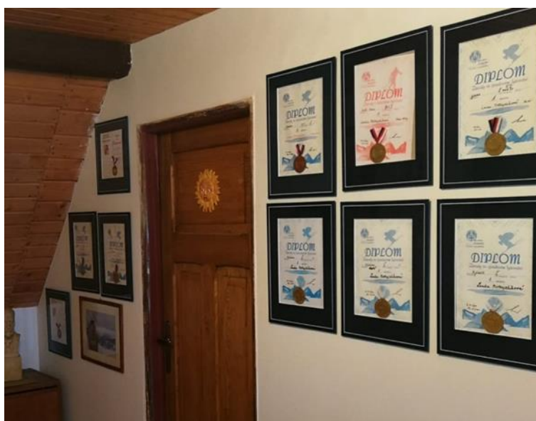
Zdroj: Foto Lenka (viz případová studie)