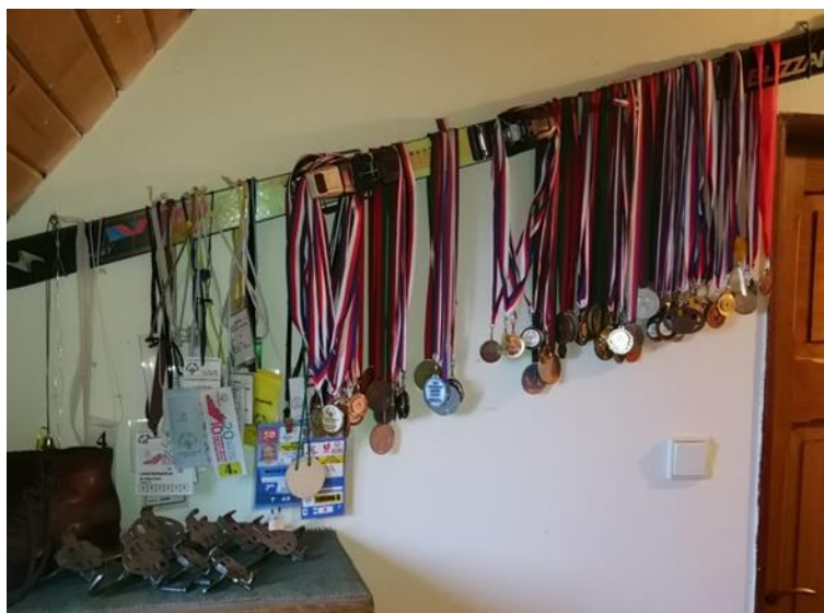
Zdroj: Foto Lenka (viz případová studie)