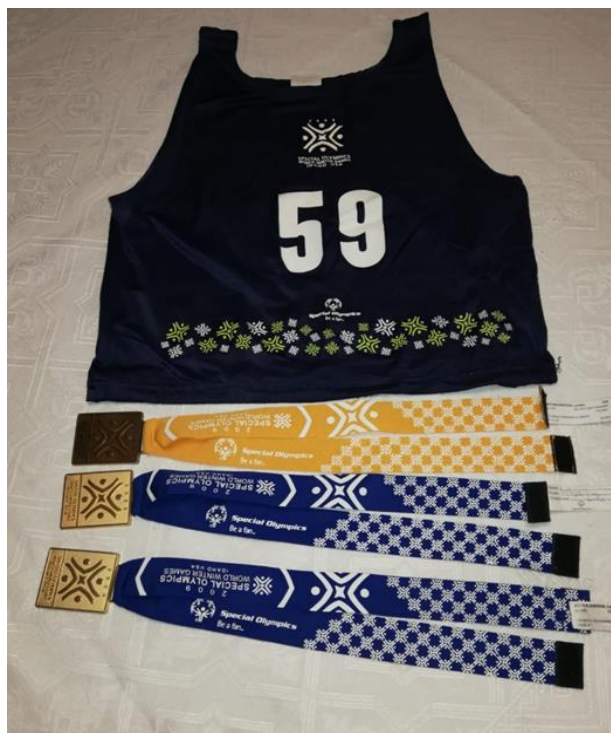
Zdroj: Foto Lenka (viz případová studie)