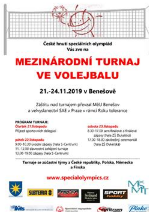
Zdroj: Foto autorka práce, 2022