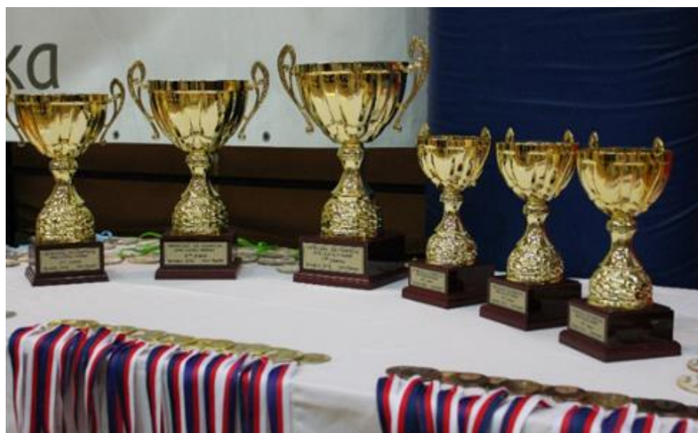
Zdroj: Foto autorka práce, 2022