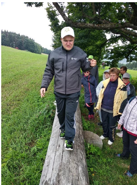
Obrázek č. 13