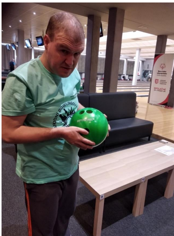
Obrázek č. 12