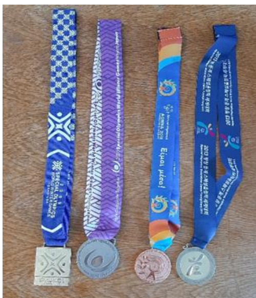
Obrázek č. 3 – Úspěchy SK Sedlec – Prčice