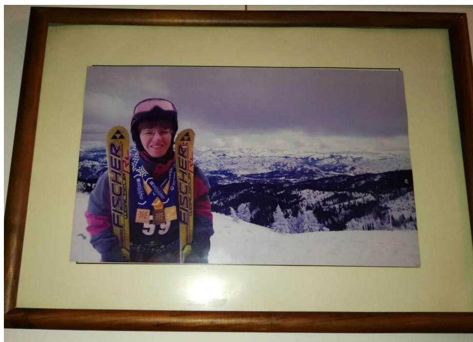
Zdroj: Foto Lenka (viz případová studie)