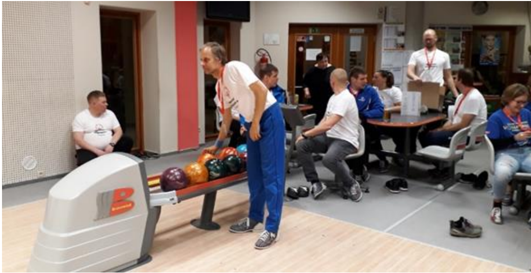
Obrázek č. 28 – Bowling