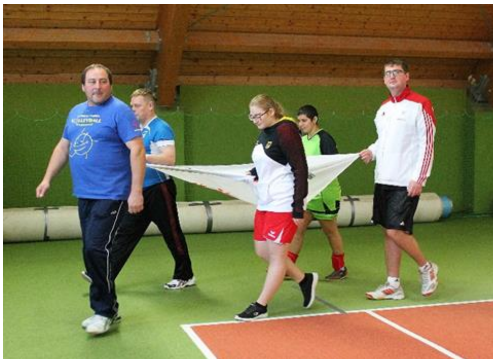
Obrázek č. 16 – Vlajka Special Olympics Česká republika