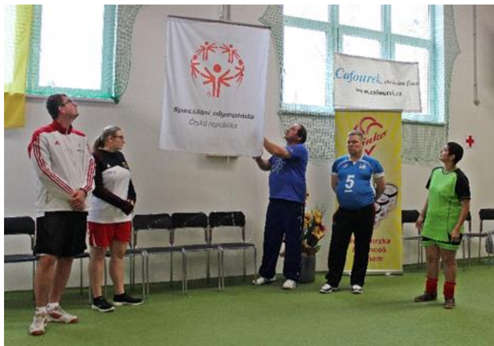
Obrázek č. 17 – Vztyčení vlajky SO Česká republika