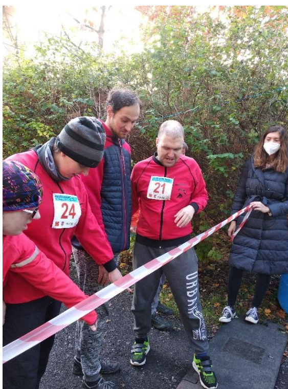
Zdroj: Foto Olda (viz případová studie)