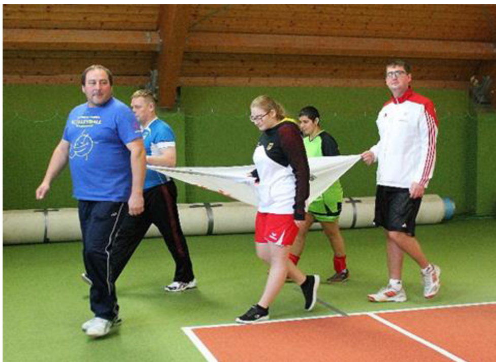
Obrázek č. 16 – Vlajka Special Olympics Česká republika