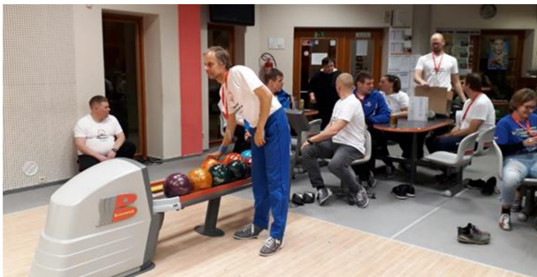
Obrázek č. 28 – Bowling