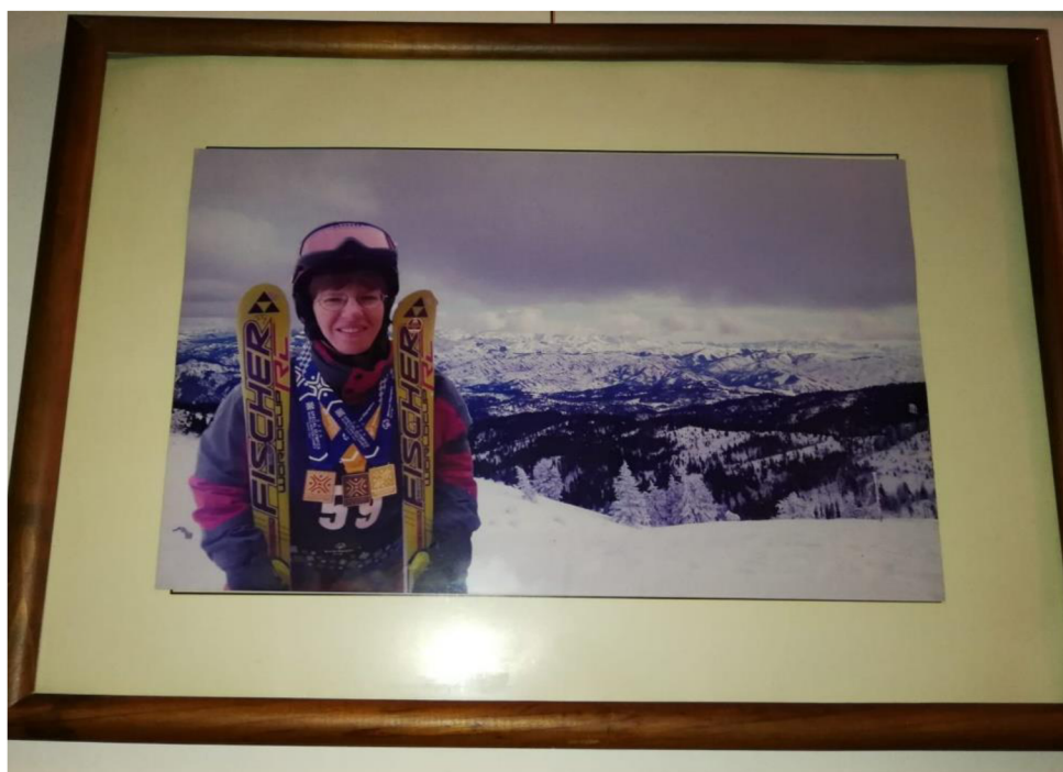
Zdroj: Foto Lenka (viz případová studie)