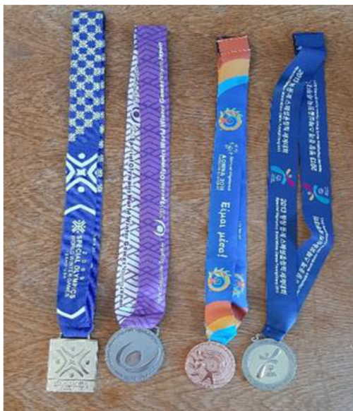
Obrázek č. 3 – Úspěchy SK Sedlec – Prčice