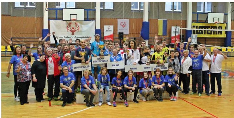
Zdroj: Foto autorka práce, 2022