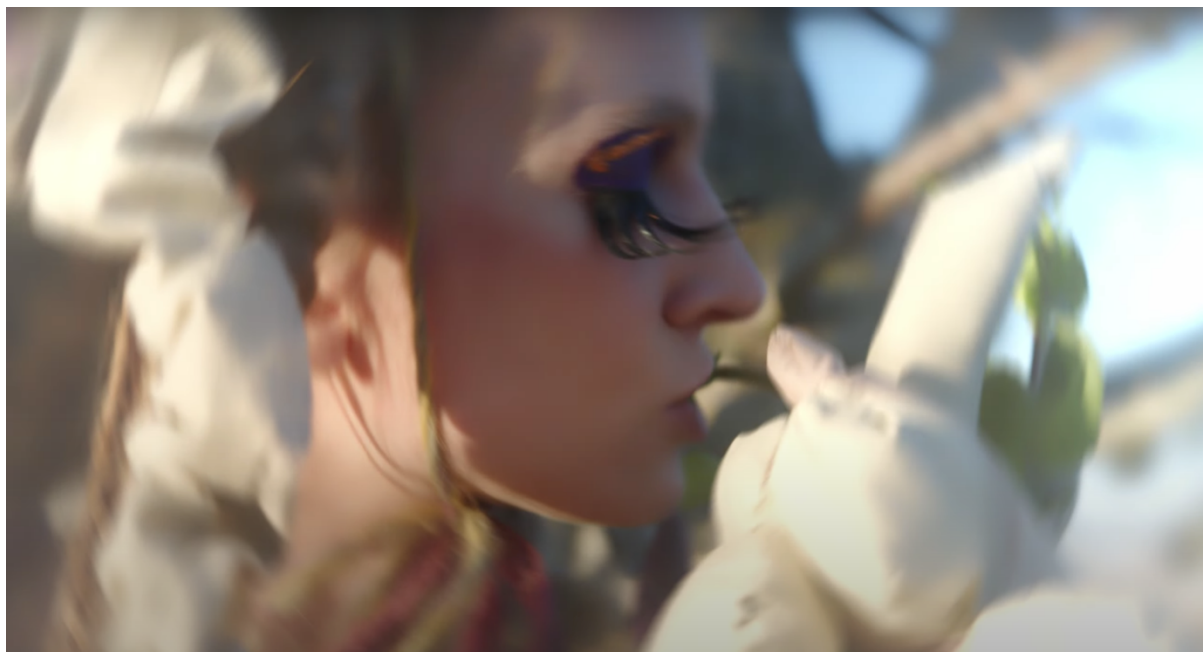
Kouzlo nevyřčeného slibu, ukázka č.7, 22 min.