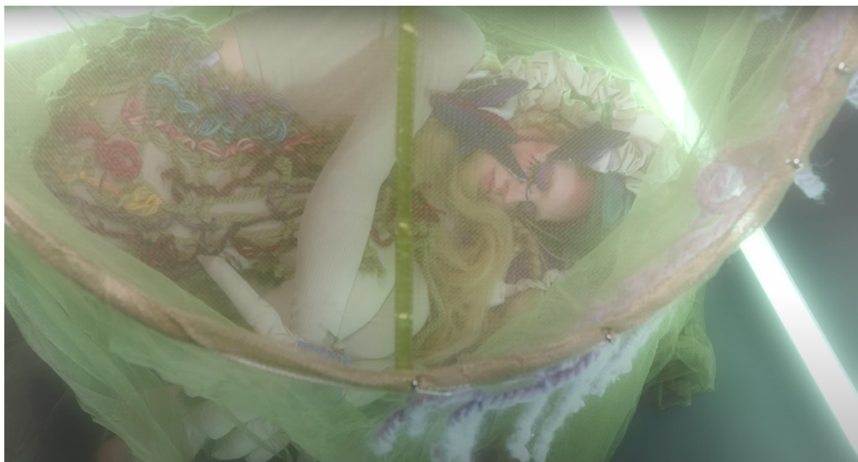
Kouzlo nevyřčeného slibu, ukázka č.6, 22 min.