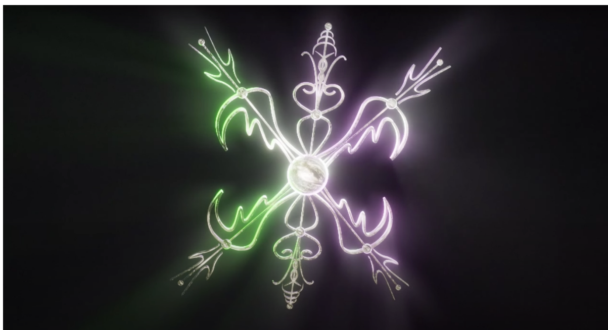
Kouzlo nevyřčeného slibu, ukázka č.7, 22 min.