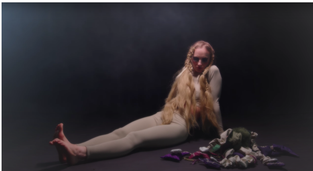
Kouzlo nevyřčeného slibu, ukázka č.2, 22 min.