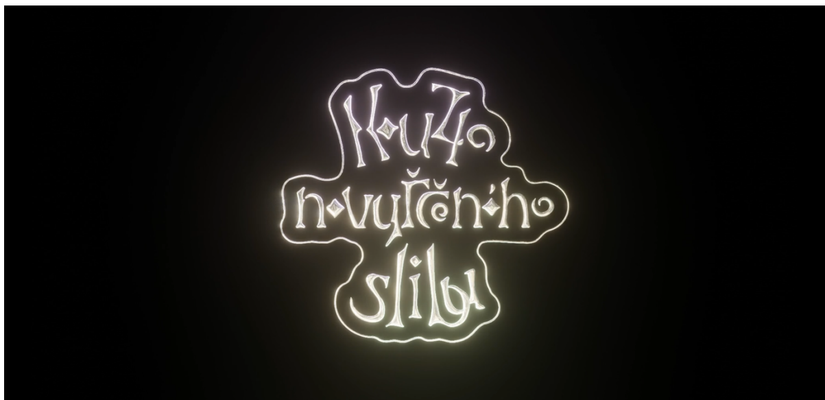
Kouzlo nevyřčeného slibu, ukázka č.1, titulka, design Pavel Homolek, 22 min.