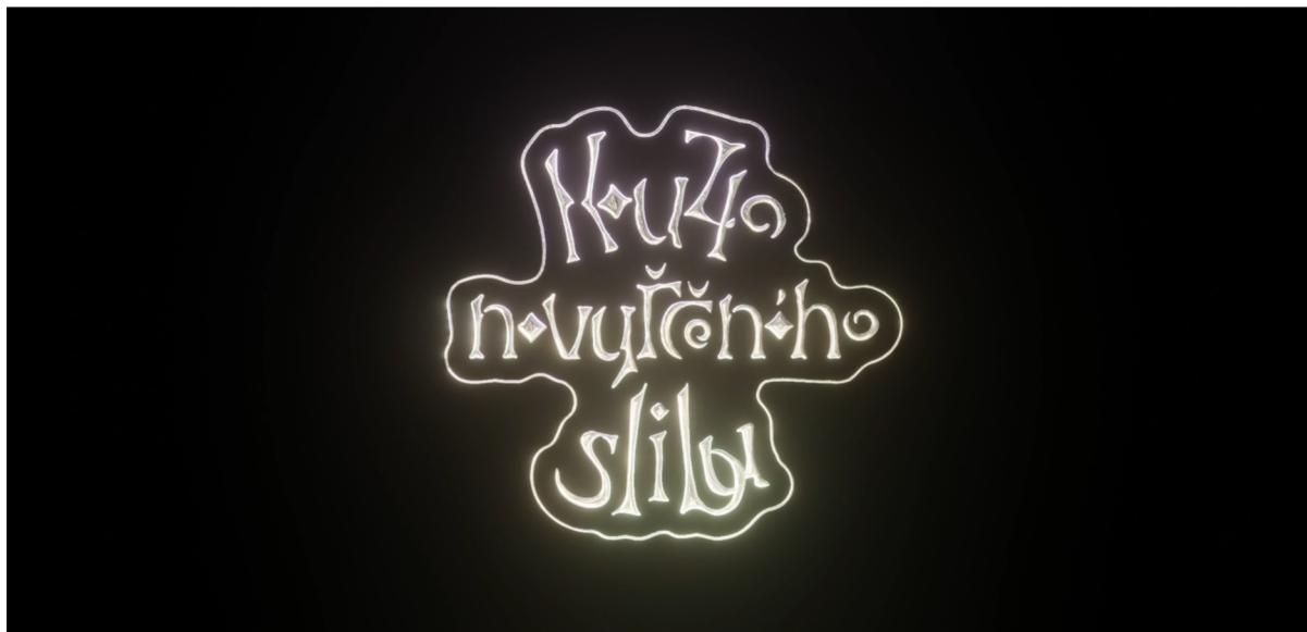
Kouzlo nevyřčeného slibu, ukázka č.1, titulka, design Pavel Homolek, 22 min.