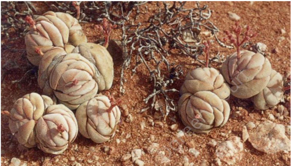
Obrázek 3: Crassula alstonii nápadně se tvarem podobající trusu kopytníků.

Druhý princip, na kterém může rostlina stavět ochrannou maškarádu, předpokládá, že rostlina může svým vzhledem napodobovat jiný, pro herbivora však nezajímavý, rostlinný orgán, jako je například uschlá větévka či umírající list, nebo může vypadat (např. díky panašování), jako by již byla dříve napadena fytofágním hmyzem, a tak být pro „dalšího“ herbivora (jak hmyzího, tak obratlovčího) nezajímavá. Tento jev však Lev-Yadun (2016) zařazuje jak mezi defenzivní maškarádu, tak přímo mezi rostlinné mimikry (či automimikry), jež představují v dalších částech práce. Bílá variegace v listech (pozorovaná například u ostropestřce mariánského ( Silybum marianum ), či bodláku syrského ( Notobasis syriaca ) by podle Smitha (1986) a Lev-Yaduna (2003) mohla v očích herbivorů připomínat poškození, jež listům způsobují pasoucí se housenky různých druhů minujícího herbivorního hmyzu (např. dvoukřídlí čeledi Agromyzidae či drobní motýli čeledi Gracillariidae, Nepticulidae, Coleophoridae aj.) (Lev-Yadun 2003; Soltan et al. 2009). Tento vzhled může sloužit jako dostatečná záminka pro herbivora se těmito „poškozeným“, „již ochutnaným“, „nutričně nebohatým“, a tedy na pohled