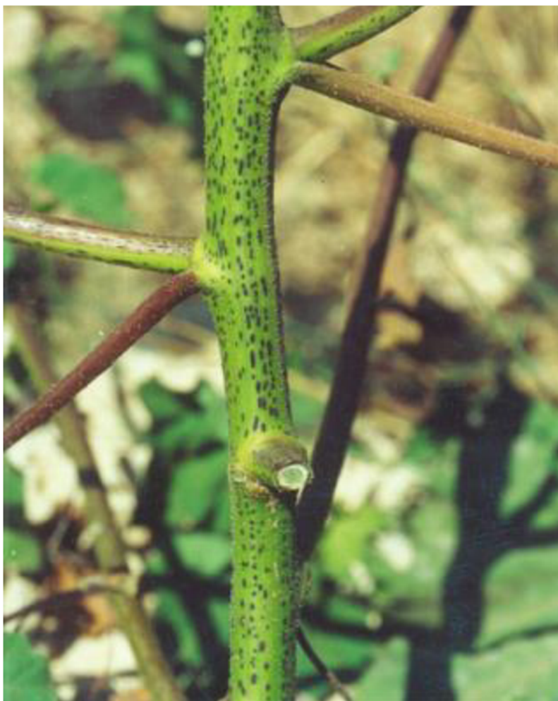
Obrázek 7: tmavé fleky na stonku repeně durkomanu ( Xanthium strumarium ) připomínající mravence. (Foto: S. Lev-Yadun).

2009a), jenž může být pro rostlinu možná nakonec ještě efektivnější, neboť výměnou za ochranu, jež rostlině mimikry mravenců poskytuje, nemusí skutečným mravencům obětovat žádné zdroje. Mimikry mravenců můžeme též pozorovat na stoncích a řapících křivušky obecné ( Arisarum vulgare ) (Lev-Yadun & Inbar 2002).