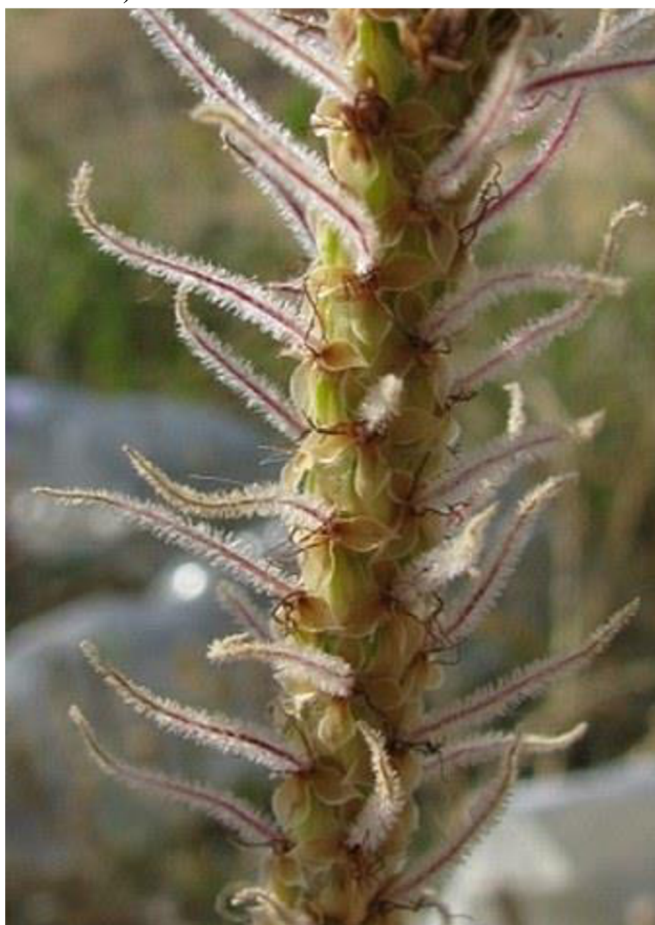
Obrázek 4: jitrocel bělavý ( Plantago albicans ) s výraznými kontrastujícími bílými trichomy.