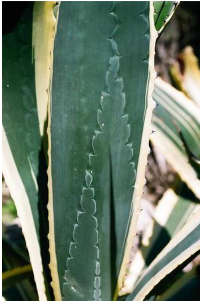
Obrázek 5 : list Agave sp. s důvěryhodnými obtisky trnů uvnitř listové plochy (automimikry).

Speciálním případem (Batesova) mimikry jsou „automimikry“, kdy jedinec napodobuje jednou neškodnou částí svého vlastního těla nějakou jinou, nebezpečnou. Jev můžeme pozorovat na trnitých rostlinách introdukovaných do izraelské flóry a dodnes masivně pěstovaných v Negevské poušti – Agave . Okraje listů agáve jsou od báze až po distální konec zubaté a aposematically zbarvené (bíle, červeně, fialově...) (Lev-Yadun 2001). Vznik tohoto automimikry je prostý - nově rostoucí listy jsou k sobě těsně semknuté a jejich trnitě okraje tlačí na listové plochy, což nakonec na listech zanechá bezbarvou otlačeninu těchto trnů (viz Obrázek 5 ). Listy následně vypadají jako by se trny nacházely též „uvnitř“ jejich listové plochy a posilují tak svou výstražnou signalizaci zdánlivě ještě nebezpečnějším vzhledem s větším počtem prvků mechanické ochrany (Gentry 1982; Lev-Yadun 2001).