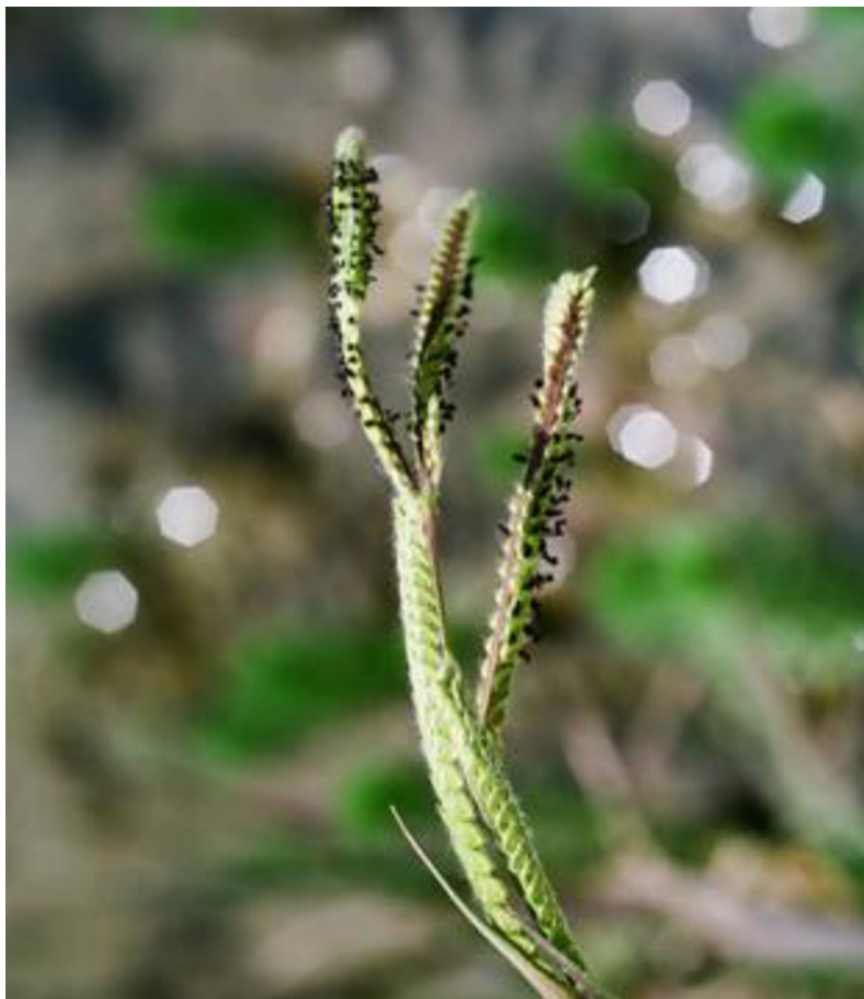
Obrázek 6: prašníky pasapalu obecného ( Paspalum paspaloides ) vizuálně připomínající mšice. (Foto: S. Lev-Yadun).