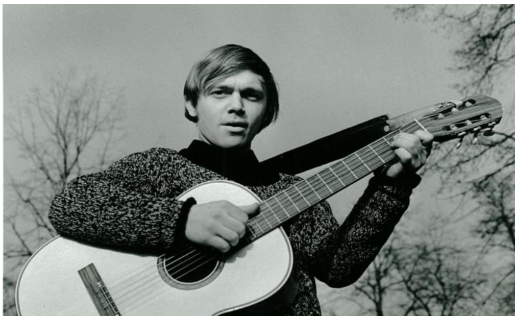
Obr. 10: Karel Kryl 97

Roku 1969 byl Kryl pozván, aby vystoupil na festivalu písničkářů v Západním Německu. K opuštění Československa použil doložku z Filmové a televizní fakulty Akademie múzických umění v Praze (FAMU), kde studoval dramaturgii. Od té doby se do pádu komunismu v Československu domů nevrátil. Žil v exilu v Mnichově, kde vydával své další desky s protestsongy mířenými proti komunistickému systému. Po celou dobu exilu byl sledován agenty StB. 96