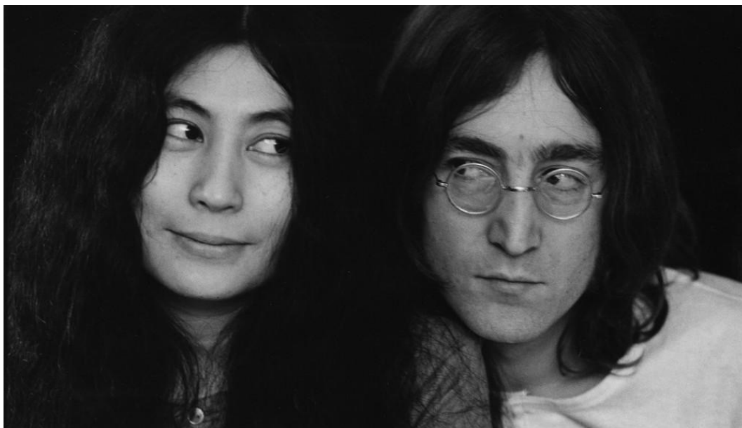
Obr. 6: Yoko Ono (vlevo) a John Lennon (vpravo) 52

Roku 1969 vydal Lennon první sólovou píseň Give Peace a Chance . Po rozpadu Beatles v roce 1970 se přestěhoval do New Yorku s manželkou Yoko Ono, kde založil skupinu Plastic Ono Band s Ericem Claptonem, Klausem Voormanem a Alanem Whitem. V USA se stal politicky angažovanou osobností. Královně Alžbětě II. vrátil Řád britského impéria, kvůli vyjádření odporu proti politické podpoře amerického zásahu ve Vietnamu Velkou Británií. Ve spolupráci s producentem Philem Spectorem vznikly skladby Power To The People , Happy Xmas (War Is Over) , LP Imagine a LP Plastic Ono Band . Během pobytu v USA se soudil o zrušení deportace ze země, která mu hrozila. Yoko Ono se podílela na vzniku Lennových písní a byla součástí Plastic Ono Band. Během své sólové kariéry vydal 13 LP desek. LP Some Time In New York City , bylo nejvíce politicky inspirované album aférami prezidenta Spojených států Richarda Nixona. V lednu 1984 byl zastřelen v New Yorku při návratu z nahrávacího studia, před hotelem Dakota, Markem Davidem Chapmanem. John Lennon se stal osobností působící jak v hudebním průmyslu, tak i ve společenské a geopolitické sféře. 51