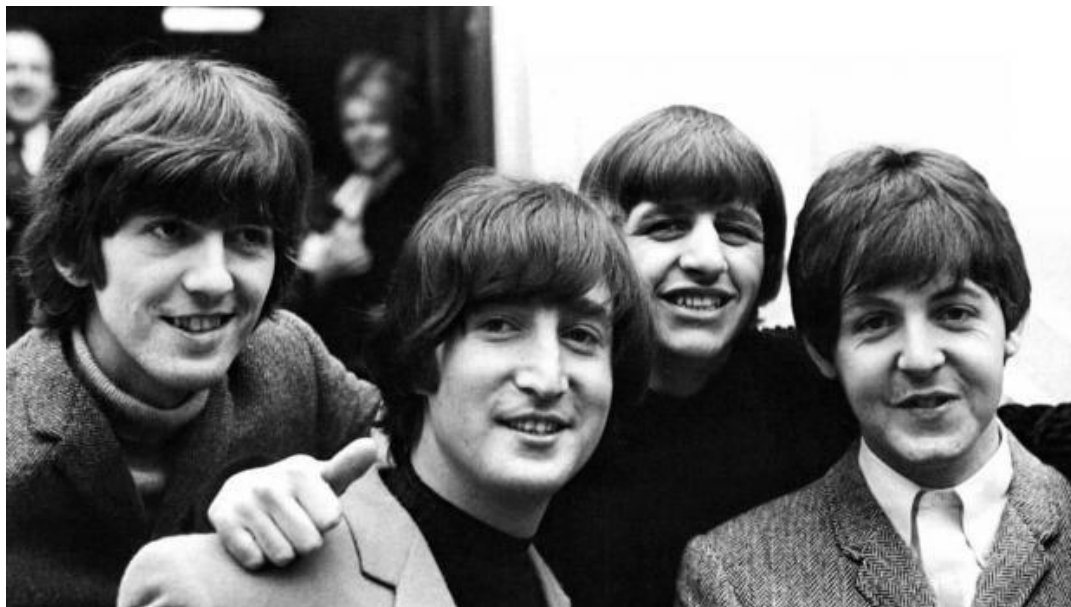
Obr. 1: The Beatles (zleva George Harrison, John Lennon, Ringo Starr a Paul McCartney) 14

Následovaly desky A Hard Day's Night , Beatles For Sale , Help! , Rubber Soul , Revolver , Sgt. Pepper's Lonely Hearts Club Band , The Beatles , Yellow Submarine , Abbey Road a Let it be . Každé z těchto alb bylo stylově odlišné. Beatles a George Martin neustále experimentovali a přicházeli s novými myšlenkami, postupy a nápady. The Beatles se stali prototypem rockové skupiny, který následovala většina skupin na světové scéně. Svou tvorbou a deskami udávali hudební trendy, které ovlivňovaly vývoj nonartificiální hudby i po jejich rozpadu roku 1970. 13