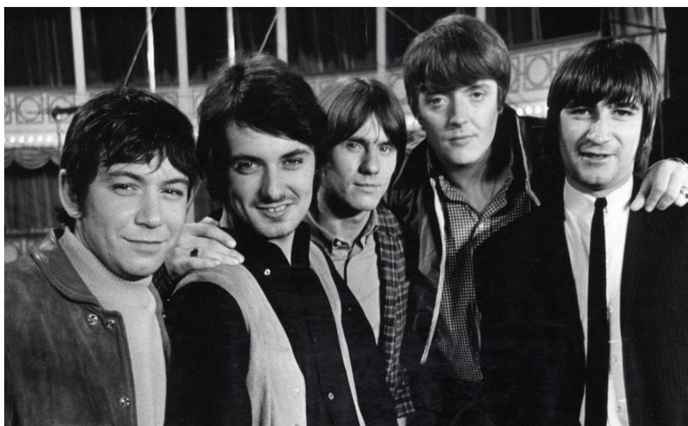
Obr. 5: The Animals (zleva Eric Burdon, Alan Price, Hilton Valentine, John Steel a Dawe Rowberry) 47

Výsledky odborné studie provedené na americké Univerzitě Wisconsin-Madison ve státě Wisconsin roku 2006 dokázaly, že singl We've Gotta Get Out Of This Place vydaný v roce 1965, se stal hymnou vojáků a veteránů bojujících ve Vietnamu. Každá skupina hrající v armádních klubech musela tuto píseň zařadit do svého pravidelného repertoáru. Podle Adriana Cronauera, diskžokeje v armádním rádiu Armed Forces Radio, We've Gotta Get Out Of This Place byla nejoblíbenější a nejžádanější skladbou v rozhlasovém vysílání rádia. The Animals nahráli dvě verze této písně. Alternativní americká verze We've Gotta Get Out Of This Place se stala populárnější a skupiny 20. století ji převzaly do svého repertoáru. 46