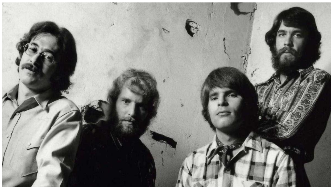
Obr. 4: Creedence Clearwater Revival (zleva Stu Cook, Tom Fogerty, John Fogerty a Doug Clifford) 41