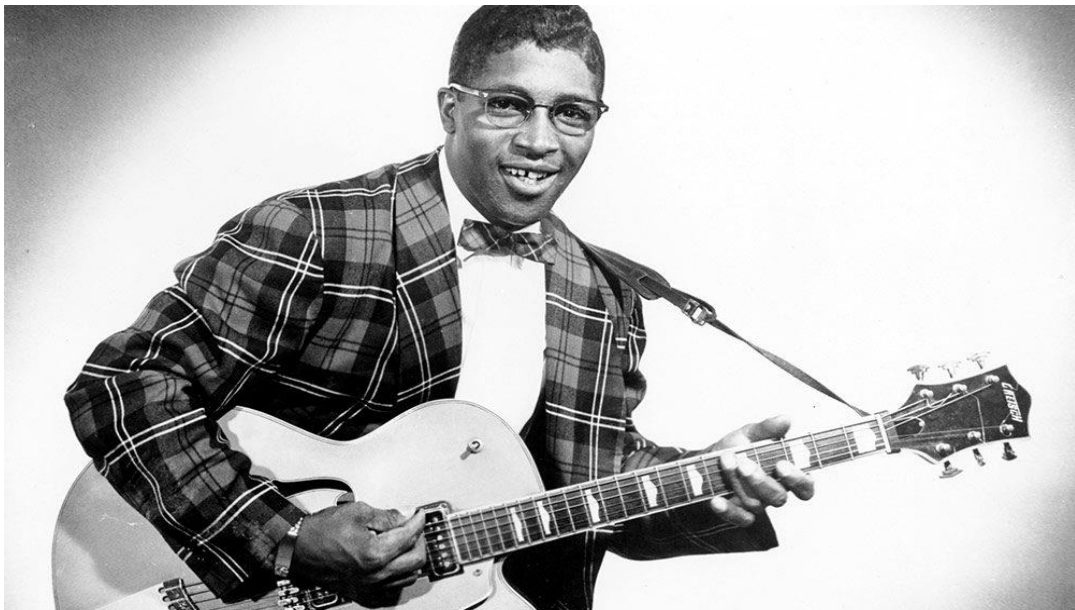
Obr. 2: Bo Diddley 17

Jeho první píseň Bo Diddley vydaná pod uměleckým pseudonymem Bo Diddley, nahraná ve Chess-Checker records v Chicagu, se stala hitem v rockové a R&B kultuře. Alan Freed, americký diskžokej propagující R&B hudbu v rádiu, zařadil Diddleyho píseň do svého vysílání a pomohl Bo Diddleymu se stát hudebním vzorem pro následující generaci umělců. Mezi jeho nejznámější písně se řadí Bo Diddley , I'm a Man , Mona , Crackin' Up , Road Runner nebo You Can't Judge a Book by the Cover . Během své kariéry nahrál 11 LP desek a dostával se pravidelně na vrchní příčky amerických hitparád. 16