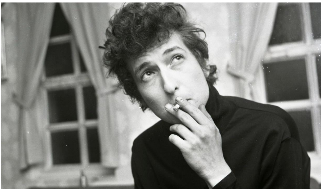
Obr. 8: Bob Dylan 74