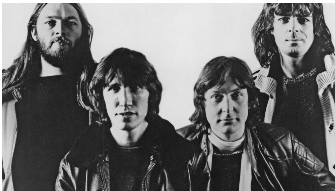
Obr. 3: Pink Floyd (zleva David Gilmour, Roger Waters, Nick Mason a Rick Wright) 27

Anglická skupina Pink Floyd se nejvíce proslavila experimentováním s elektronickými zvuky a filozofickými texty poukazujícími na společenské problémy 60. a 70. let. Začínala v éře psychedelického rocku a stala se představitelem nastupujícího progresivního rocku. Díky používání elektronických efektů v hudbě ovlivnili vývoj nonartifciální hudby. Jejich pozdější vliv na hudební průmysl je znatelný v mnoha věcech. Roger Waters, Nicky Mason a Rick Wright byli součástí skupiny od jejího založení roku 1964 až do rozpadu v roce 1985. Hlavního kytaristu a skladatele Syda Baretta vystřídal v roce 1968 David Gilmour, kvůli Baretově závislosti na LSD. Užívání LSD bylo jedním ze znaků poloviny 60. let a 70. let. Mezi jejich nejznámější alba se řadila Dark Side of the Moon , Ummagumma , Meddle , Wish you were here a The Wall . 26