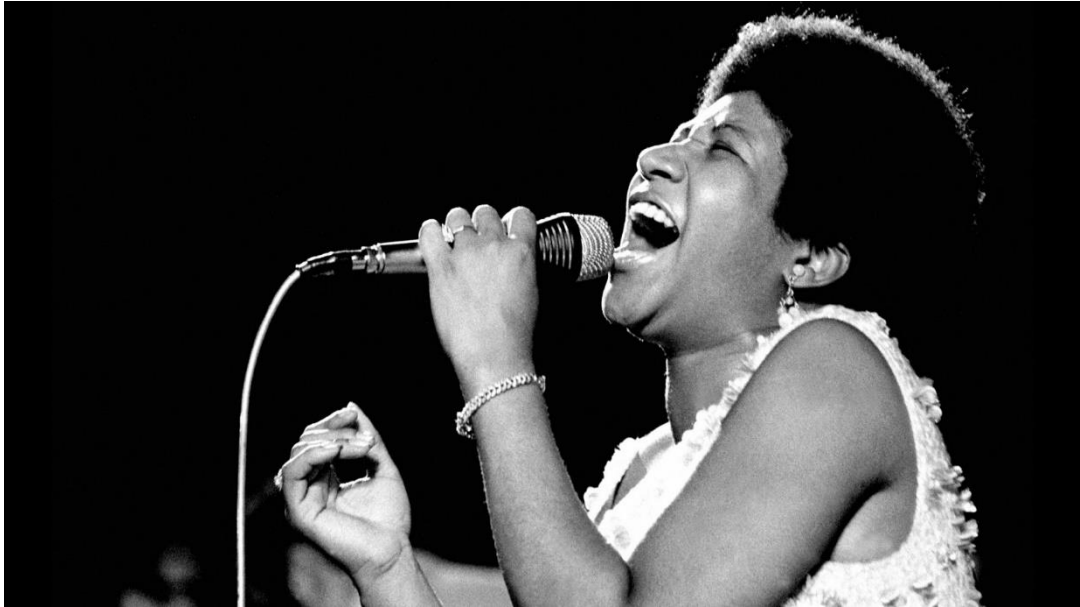
Obr. 9: Aretha Franklin 86