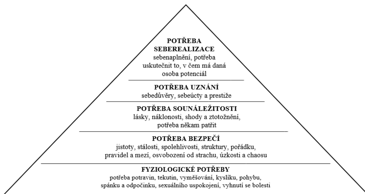
Obrázek č. 2 Maslowova pyramida lidských potřeb (zdroj: Dvořáčková, 2012, s. 41)

V nejnižší části se nachází fyziologické potřeby, výše je zobrazena potřeba bezpečí, potřeba sounáležitosti a následně potřeba uznání a nejvýše na pomyslném vrcholu potřeba seberealizace (Dvořáčková, 2012, s. 40).