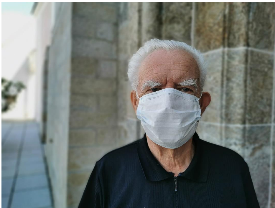
Obrázek č. 1 Senior s rouškou

„Roušku, dej si roušku, nestyd' se, chráníš mě a já zas tebe. Roušku, dej si roušku, mysli na druhé, a ne jenom na sebe.“