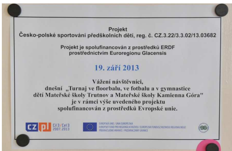
Obr. č. 21 Plakát na společnou akci v Trutnově 19. 9.2013