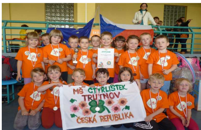
Obr. č. 19 Sportovní olympiáda v Kamienniej Górze v květnu 2013