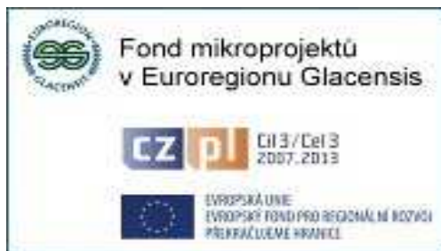
Obr. Č. 3: Logo Fondu mikroprojektů v Euroregionu Glacensis