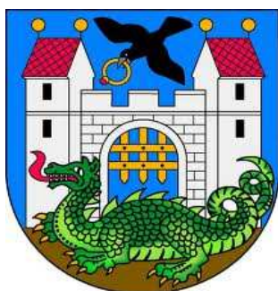
Obr. č. 6: Logo města Trutnova