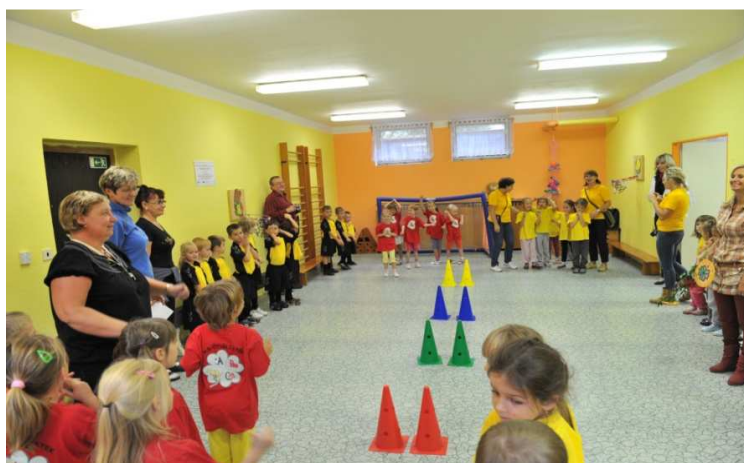
Obr. č. 22 Česko – polské sportování v tělocvičně MŠ Čtyřlístek v září 2013