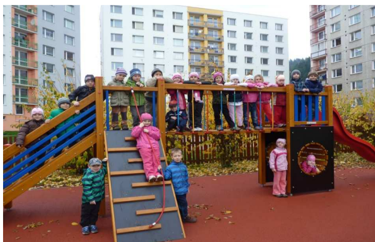
Obrázek č. 14 Prolézací dráha v říjnu 2013