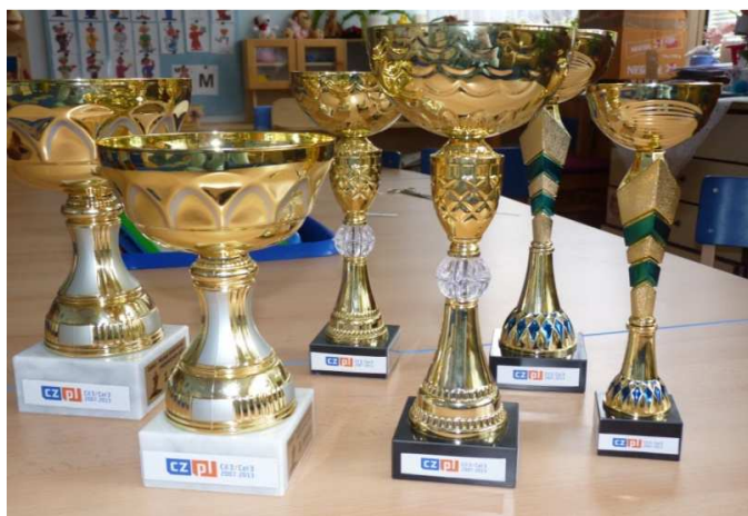
Obr. č. 25 Poháry pro skupinové sporty fotbal, florbal, gymnastika, 2013