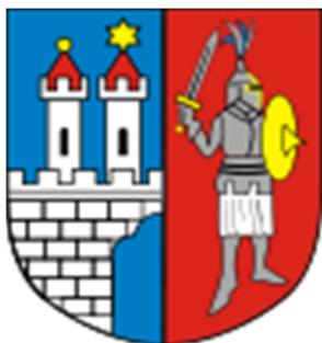
Obr. č. 7: Logo města Kamienna Góra