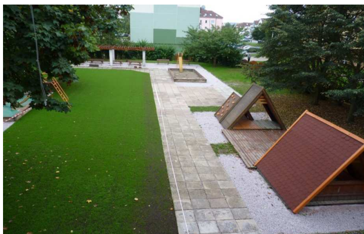
Obrázek č. 12 Upravená plocha zahrady v srpnu 2013