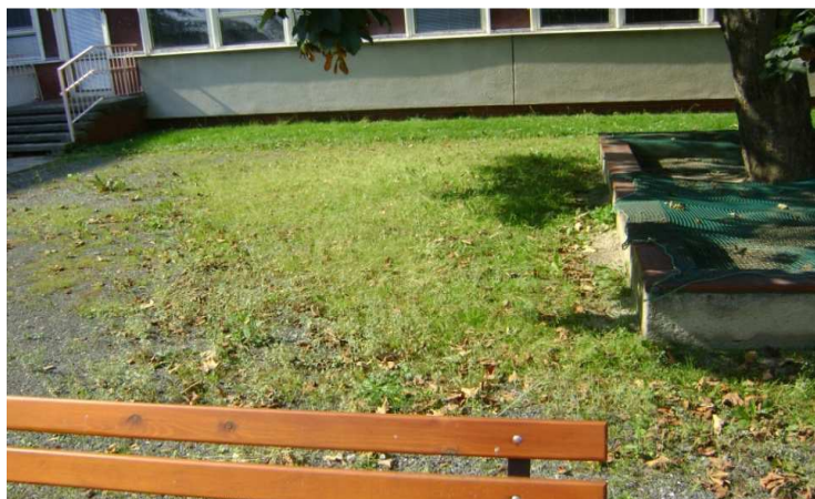
Obr. č. 8 Původní vzhled zahrady MŠ Čtyřlístek před rokem 2011