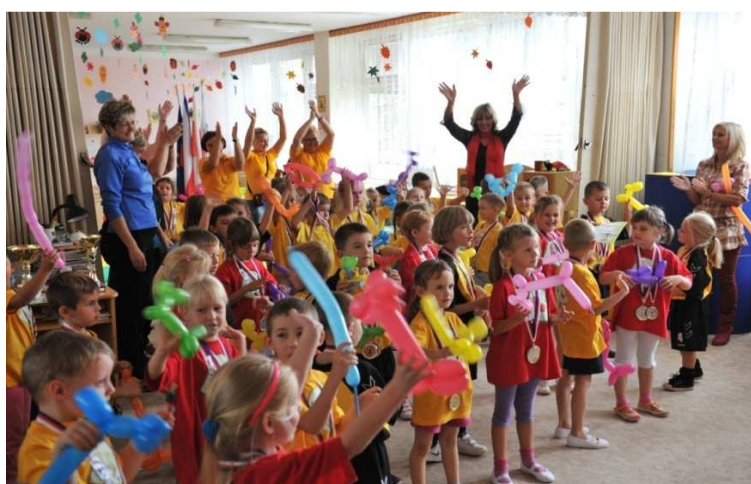
Obr. č. 26 Společná slavnost v Trutnově v září 2013