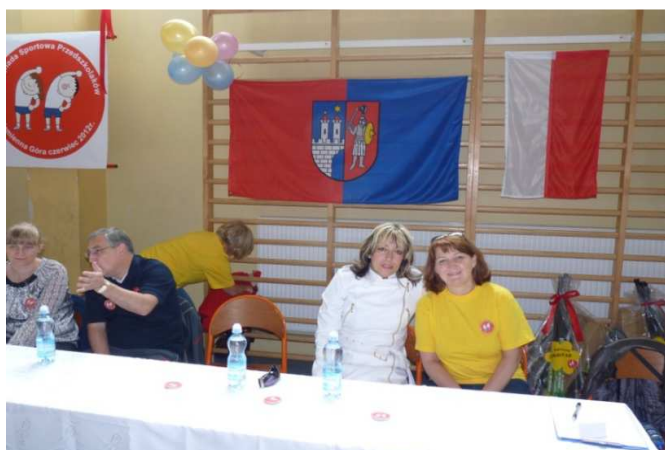
Obr. č. 16 Mezinárodní olympiáda v Kamiennej Górze 2012