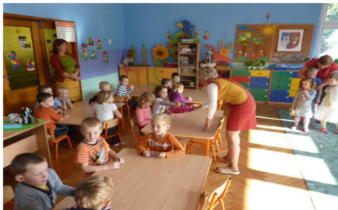
Obr. č. 17 Návštěva českých dětí v Mateřské škole v Polsku v dubnu 2012