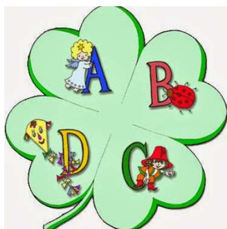
Obr. č. 4: Logo Mateřské školy Čtyřlístek.