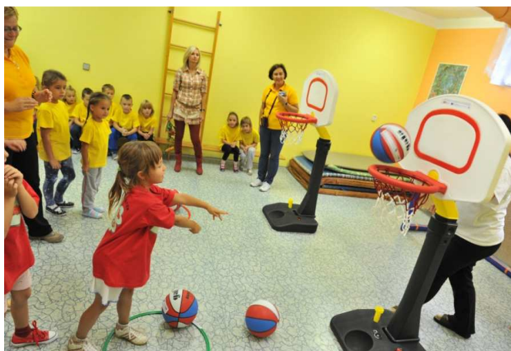
Obr. č. 23 Akce v Trutnově v září 2013 - Hod na koš