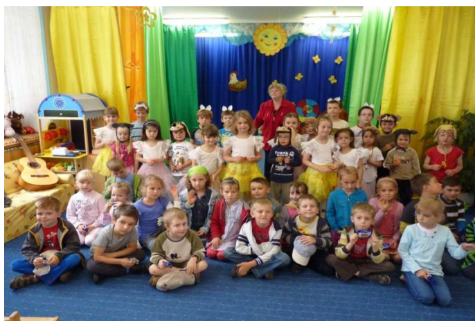
Obr. č. 18 Setkání Čechů a Poláků v Trutnově v MŠ Čtyřlístek v červnu 2012