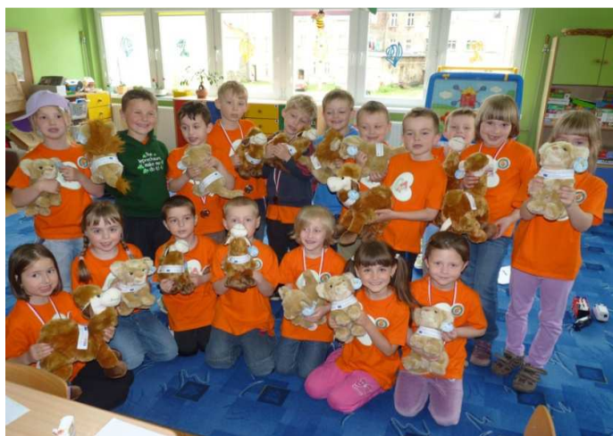
Obr. č. 20 Návštěva polské mateřské školy v květnu 2013