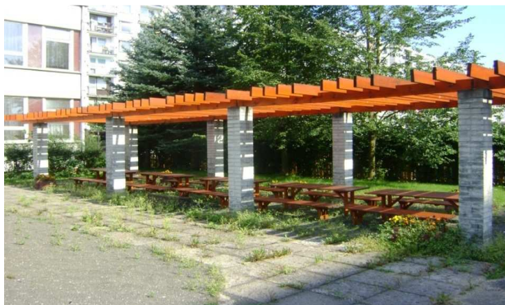
Obr. č. 10 Původní vzhled zahrady MŠ Čtyřlístek před rokem 2012