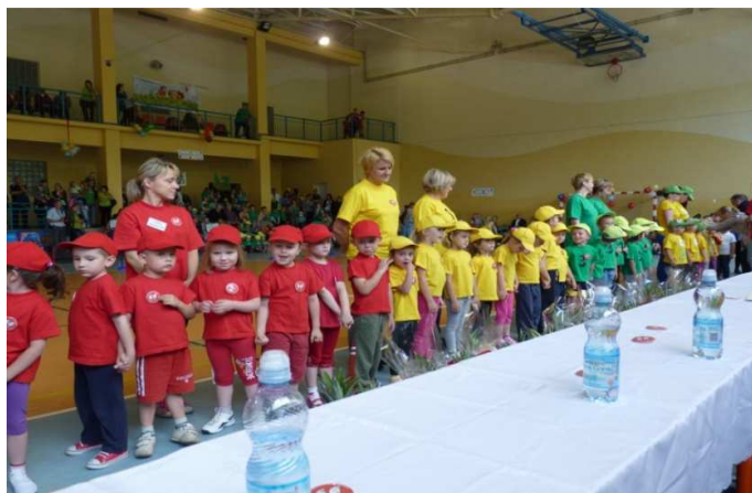
Obr. č. 15 Mezinárodní olympiáda v Kamiennej Górze 2012