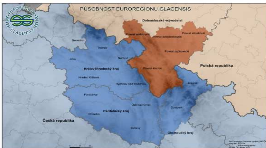
Obr. č. 2: Územní vymezení Euroregionu Glacensis.