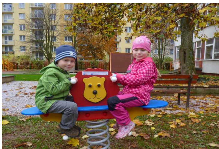
Obrázek č. 13 Hra dětí na herním prvku v říjnu 2013