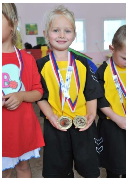
Obr. č. 24 Medaile z EU pro vítěze Česko – polských her, 2013