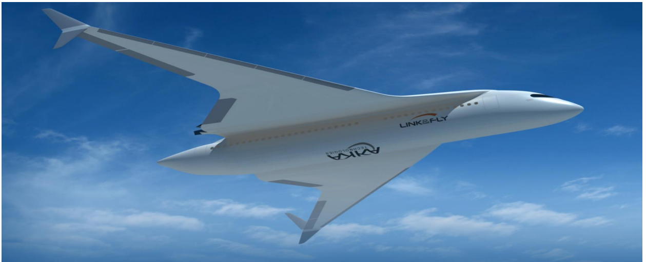
Létající vlak“ AKKA Link & Fly

Klíčovým parametrem moderního letadla je hospodárnost. Konstruktéři se snaží optimalizovat každý detail stroju, přesto se stále drží v mantinelech dříve definovaného uspořádání.