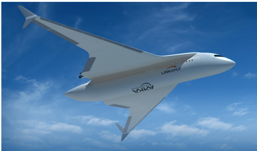
“Flying train” AKKA Link & fly.

At first glance, transport aircraft have not changed in decades – the cylindrical fuselage, two to four engines under the wings or on the tail. From the inside, however, they are different from those starting the era of modern civil aviation after the war. They have communication and navigation systems that only a few people could have imagined in the 1950s. Security systems on board and on the ground have also seen progress. Composite materials in the engines have significantly reduced the weight of aircraft. What comes next?