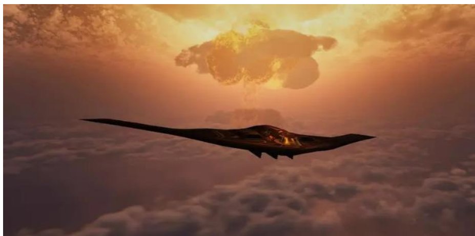
Bombardér Northrop Grumman B-2 Spirit

Samokřídlo by proto mohlo být výrazně hospodárnější než konvenční stroje, do obřího trupu by zřejmě šlo dostat i více cestujících. Jenže by se musela od základů přebudovat letiště, která by měl letoun obsluhovat. Dnešní vzdušné přístavy jsou dimenzovány pro stroje do 80 metrů délky a šířky.