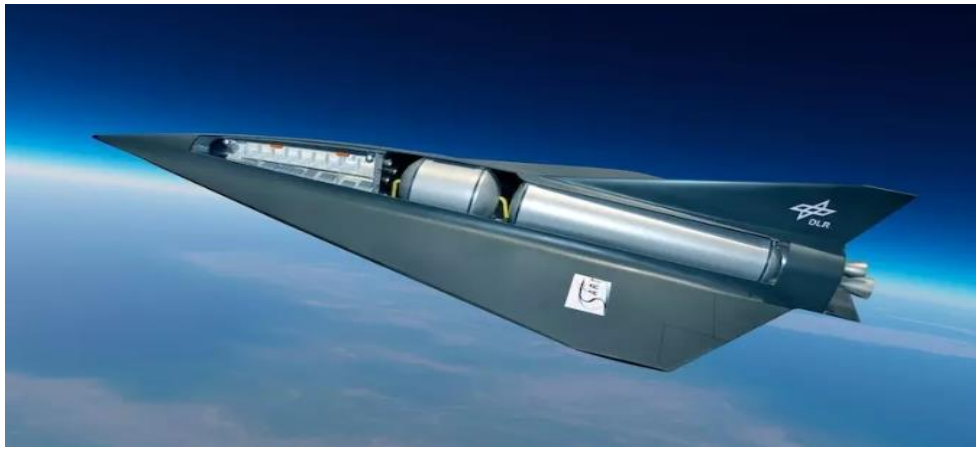
Illustration of the SpaceLiner suborbital aircraft.

The SpaceX Corporation of a quirky American visionary Elon Musk is also planning transportation use for its Big Falcon Rocket (BFR) carrier, but it is a more distant future.