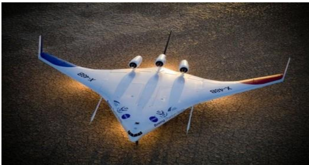
Letoun X-48B, koncept Blended Wing Body

Dálkově řízený model v měřítku 1:12 se poprvé vznesl v létě roku 2007, v letech 2012 a 2013 pak probíhalo testování druhého modelu s jiným uspořádáním motorů. Přestože byl program ukončen, zkoušky probíhaly slibně a oba partneři se dohodli na vývoji stroje ve skutečné velikosti.