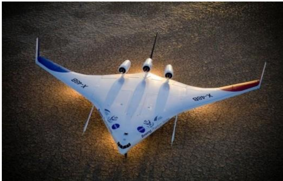
X-48B aircraft, Blended Wing Body concept.

A certain intermediate stage between the classic aircraft design and the self-wing is the Blended Wing Body concept, loosely translated as a "fuselage in combination with the wing". For several years, the U.S. National Aeronautics and Space Administration (NASA) and The Boeing Company have been working on a similar X-48B machine.