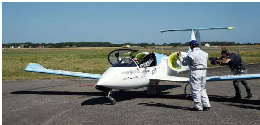
Elektroletoun E-Fan od Airbusu

Výroba však byla brzy zastavena, protože se firma rozhodla soustředit na hybridní pohon a vývoj jím vybaveného dopravního letounu pro kratší vzdálenosti, který má začít létat s pasažéry v roce 2030.