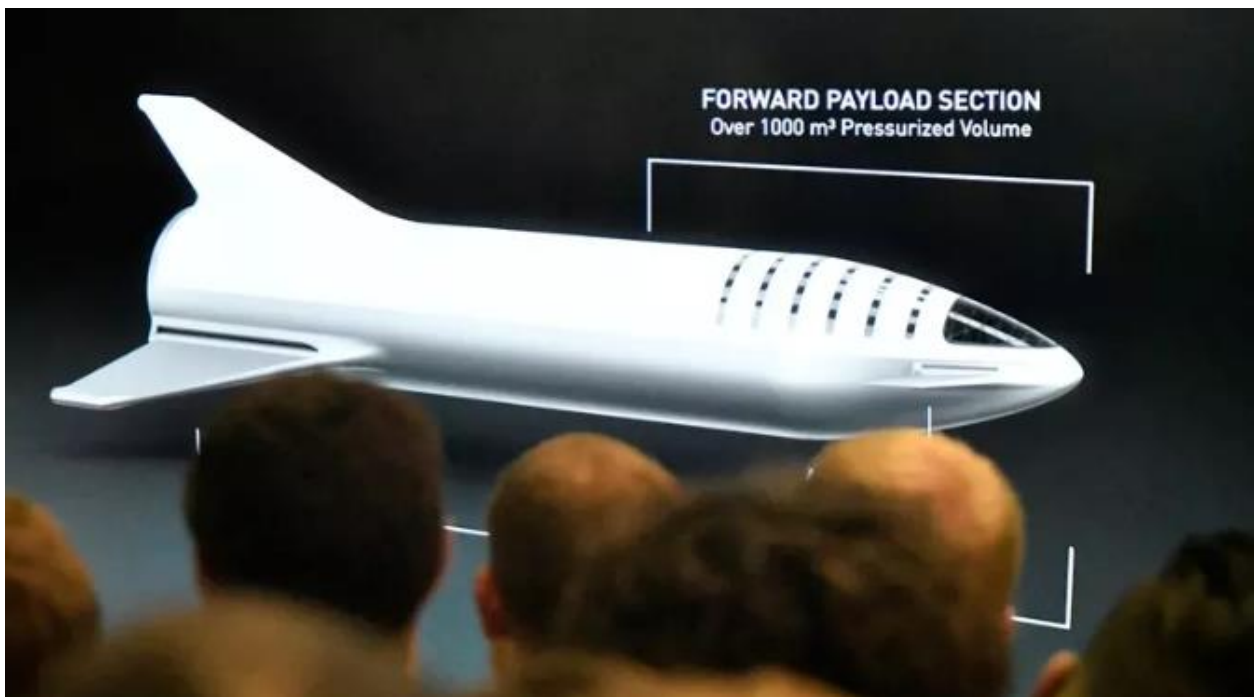
Elon Musk představuje raketoplán BFR (Big Falcon Rocket).

Zkrátka nestačí jen vyvinout samotný stroj, ale je třeba vymyslet a postavit celou infrastrukturu kolem jeho provozu. To právě do jisté míry brzdí inovace leteckého provozu, každá větší změna navíc vyžaduje přepsání bezpečnostních pravidel a mechanismů.