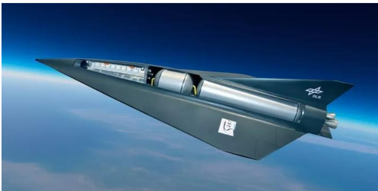
Ilustrace suborbitálního letounu SpaceLiner

Mezi studie suborbitálního letounu patří SpaceLiner Německého střediska pro letectví a kosmonautiku (DLR), který ale nyní nemá zajištěno financování.