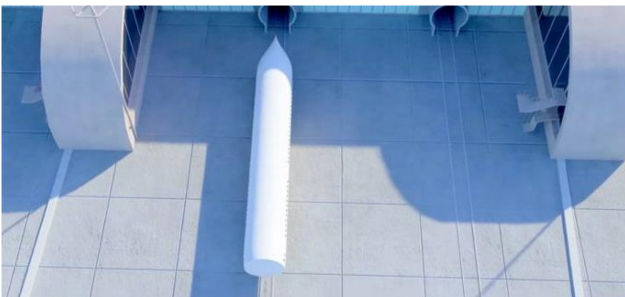
Zařízení má nejprve objíždět město na kolejích.