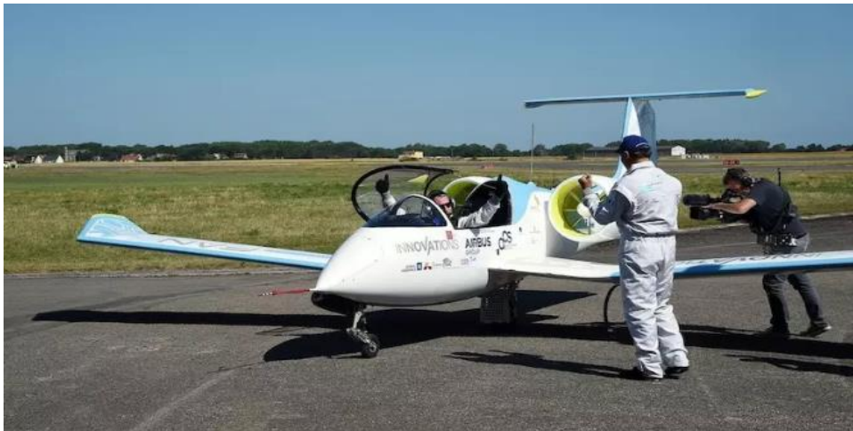
Airbus E-Fan electric plane.

The limit of the use of electric propulsion in aviation is the weight of batteries. The most widely used lithium-ion batteries have approximately three times higher the energy density compared to older cells. A similar technological leap would require electric propulsion to become practically applicable in air transport.