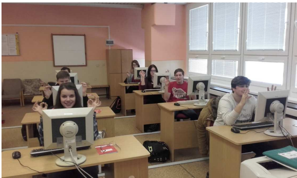
Obrázek č. 4 Fotografie žáků - cvrnkání