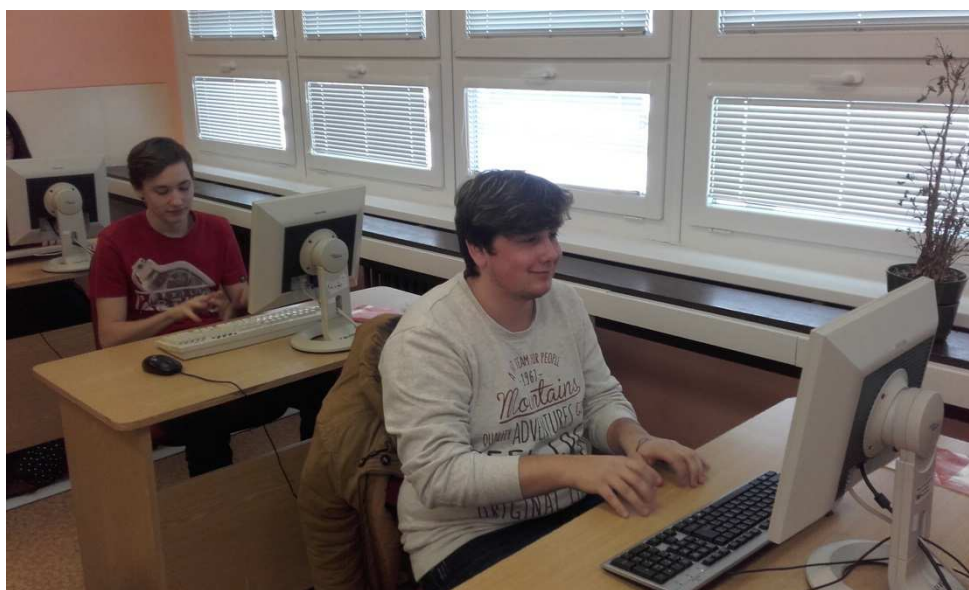
Obrázek č. 5 Fotografie žáků - ťukání prsty