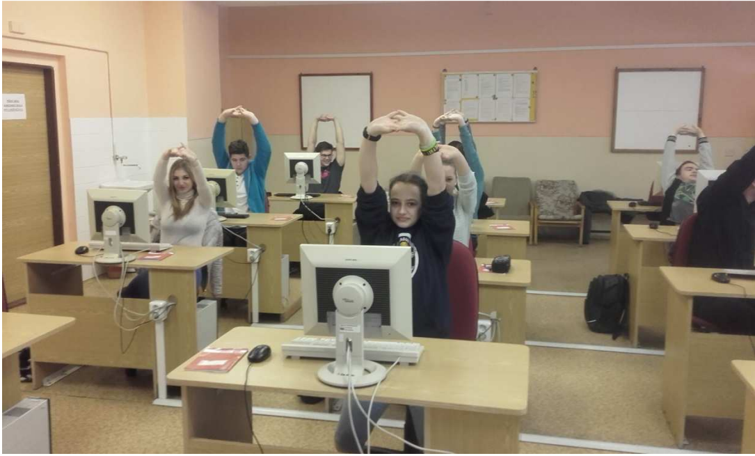
Obrázek č. 8 Fotografie žáků - protahování prstů a dlaní