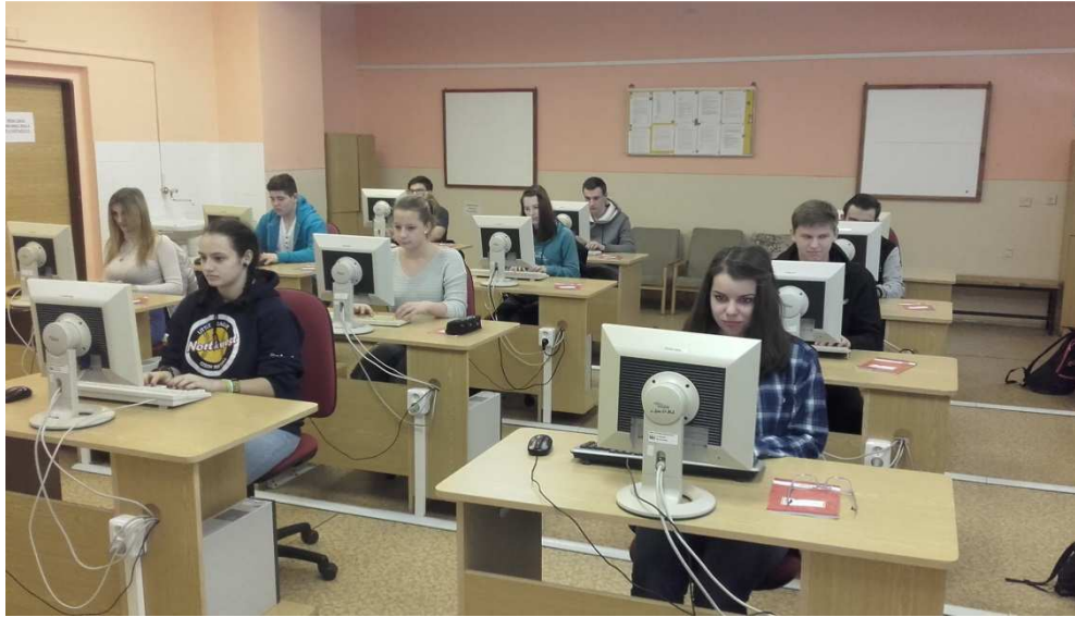
Obrázek č. 1 Fotografie žáků při psaní na klávesnici deseti prsty