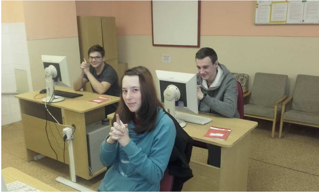
Obrázek č. 6 Fotografie žáků - balet prstů