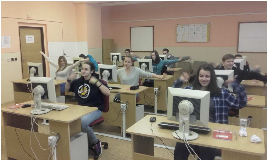
Obrázek č. 9 Fotografie žáků - kroužení