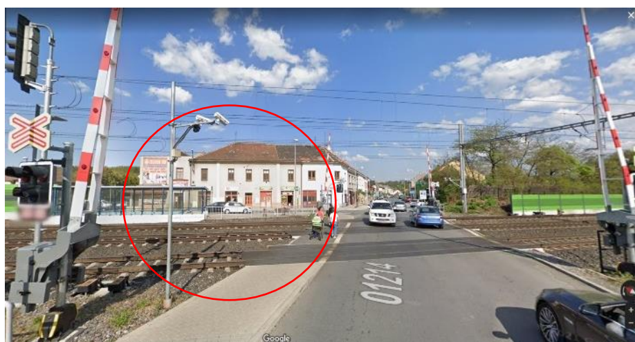
Obrázek 4 – kamera na železničním přejezdu Úvaly

Po zkušebním provozu na železničním přejezdu v Úvalech u Prahy (viz. obrázek č. 4) 33 , začíná od května roku 2020 docházet k instalaci speciálních kamerových zařízení.