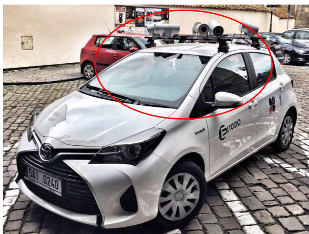
Autor: Lukáš Prchal

V případě zjištění neoprávněného stání odesílají data na centrální server městské policie, ta podklady zpracuje a ověří validitu dodaných dat. Samotný systém je velmi propracovaný a odpověď, zda na konkrétním místě vozidlo s načtenou SPZ parkuje oprávněně, se do systému počítače vrací z registru během pár sekund. Nezbytnou součástí je práce s mapovými podklady. Pokud jsou dostupné podklady dostačující, předává je městská policie místní části Prahy, kde úředníci celý proces zajištění přestupku na základě objektivní odpovědnosti provozovatele vozidla postoupí dále a zmíněného provozovatele obeznámí.