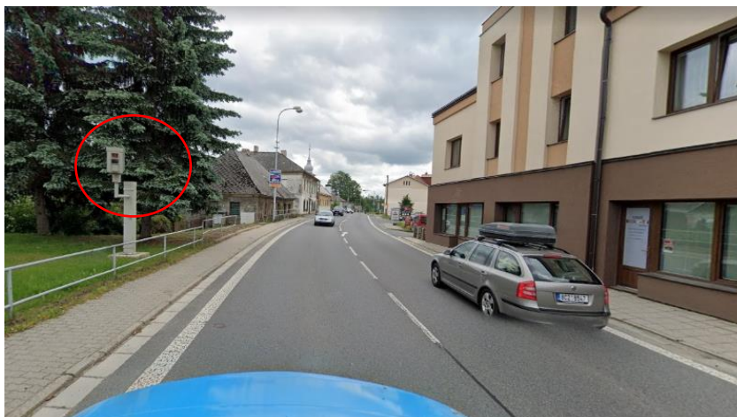
Obrázek 1 - stacionární radar Trhová Kamenice

U těchto prostředků je v první řadě důležité zmínit, že k prokázání viny za přestupek je nutné, aby byla změřena a zaznamenána rychlost vozidla.