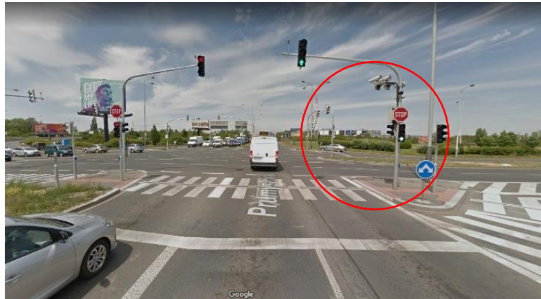
Obrázek 3 – semaforové kamery, Praha ul. Průmyslová

V neposlední řadě se můžeme setkat s kamerami na tzv. dynamických semaforech, které snímají rychlost vozidel pro potřeby usměrnění provozu. Průjezd na červenou tedy nemusí nutně znamenat provázání tohoto jednání směrem ke správnému orgánu. Vzhledem k finanční náročnosti pořízení podobného zařízení se správci komunikací uchylují k nákupu pro potřeby exponovaných křižovatek velkých měst, kde se jedná o jedinou efektivní metodu, jak předcházet kolizním situacím v křižovatkách, a tím i komplikacím v dopravě.