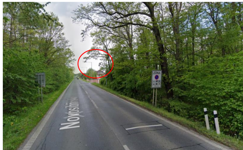
Obrázek 2 - úsekové měření Praha Klánovice

Další důležitou podmínkou k uplatnění objektivní odpovědnosti je, aby „ porušení pravidel bylo zjištěno prostřednictvím automatizovaného technického prostředku používaného bez obsluhy. “ 29 Ani tento pojem není nikde přesně definován nebo vymezen. V praxi se bude ve většině případu jednat o takové technické prostředky, které jsou trvale a pevně nainstalovány na určitém místě. K jejich správné funkci není třeba žádná obsluha nebo dozor a tento prostředek pracuje zcela autonomně. ATP je však před použitím na toto místo nutné nainstalovat a nastavit jeho základní funkce nezbytné pro správné fungování. Tím ale není dotčena povaha automatizovaného prostředku používaného bez obsluhy, jak je uvedeno v ustanovení § 125f odst. 2 písm. a) zákona o silničním provozu.