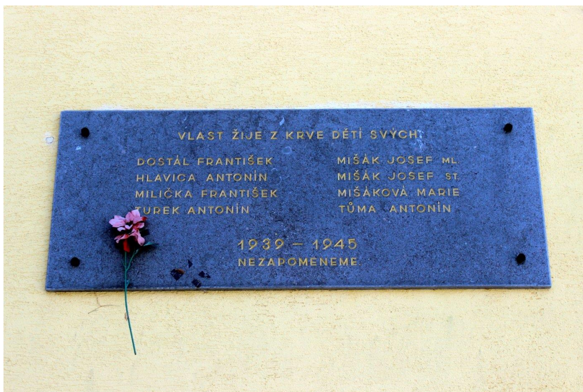
Obr. 10: Pamětní deska na budově sokolovny Olomouc – Nové Sady