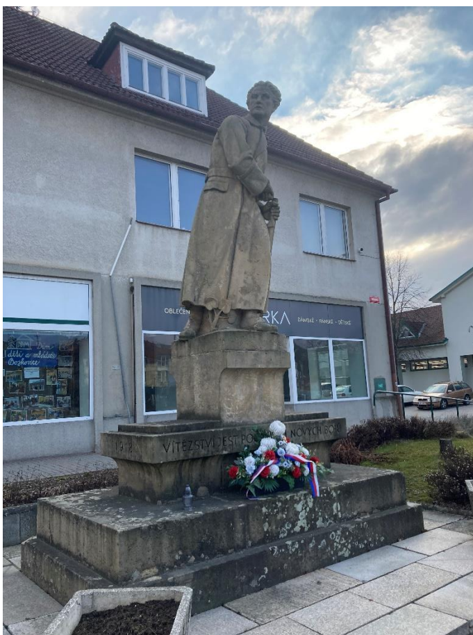
Obr. 8: Socha Svobody v Bojkovicích