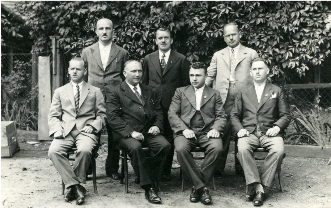
Obr. 7: Výbor Československé obce legionářské v Bojkovicích