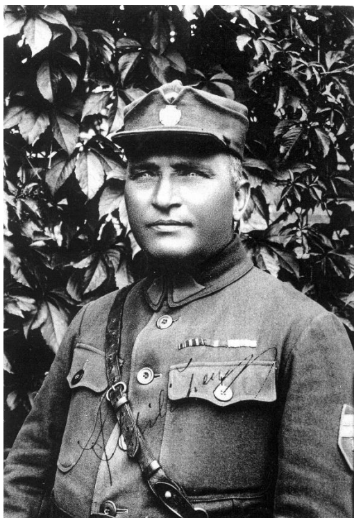
Obr. 1: Portrétní foto v legionářské uniformě