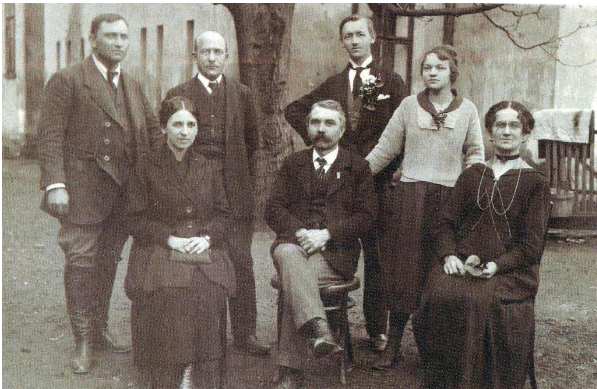
Obr. 6: Učitelský sbor Bojkovice 1920/1921