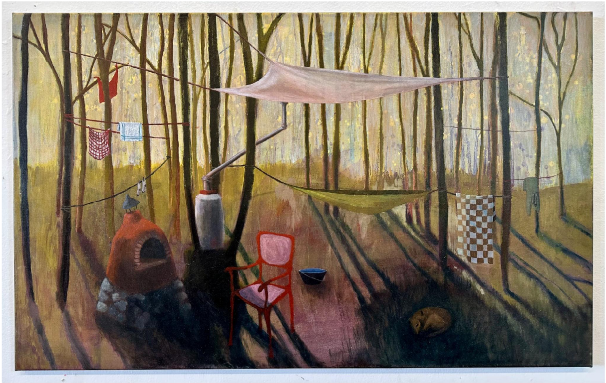
obr. č.4: Manifestační obraz , olej na plátně, 120 x 74 cm, 2024