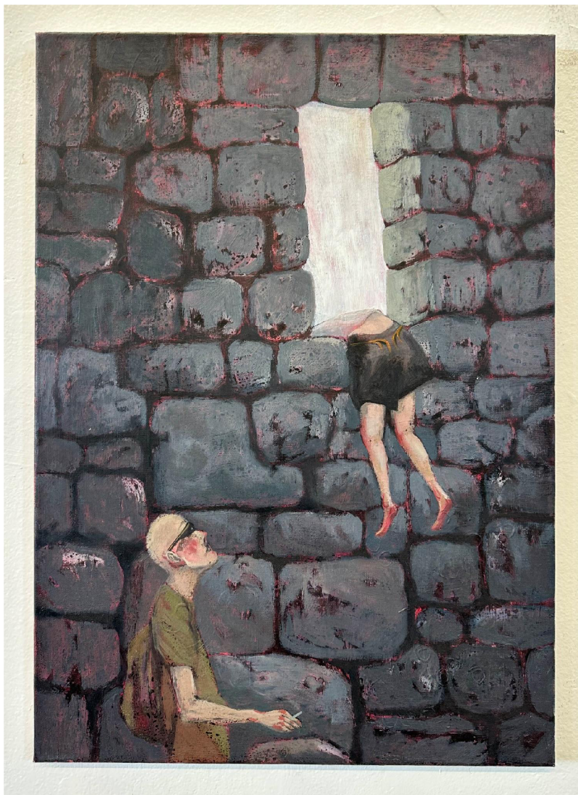
obr. č.6: Raveři, zloději, squateři , olej na plátně, 70 x 50 cm, 2024