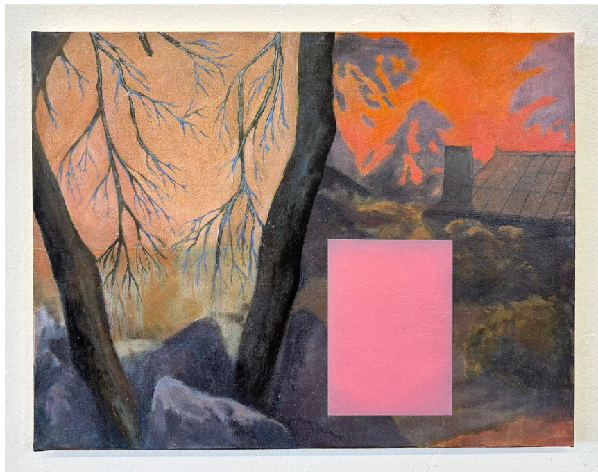
obr. č.5: Krajiny , olej na plátně, 65 x 50 cm, 2024