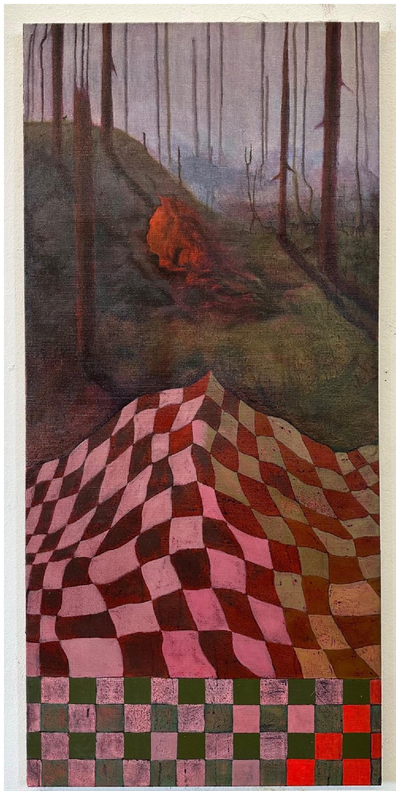
obr. č.1: Party , olej na plátně, 140 x 65 cm, 2024