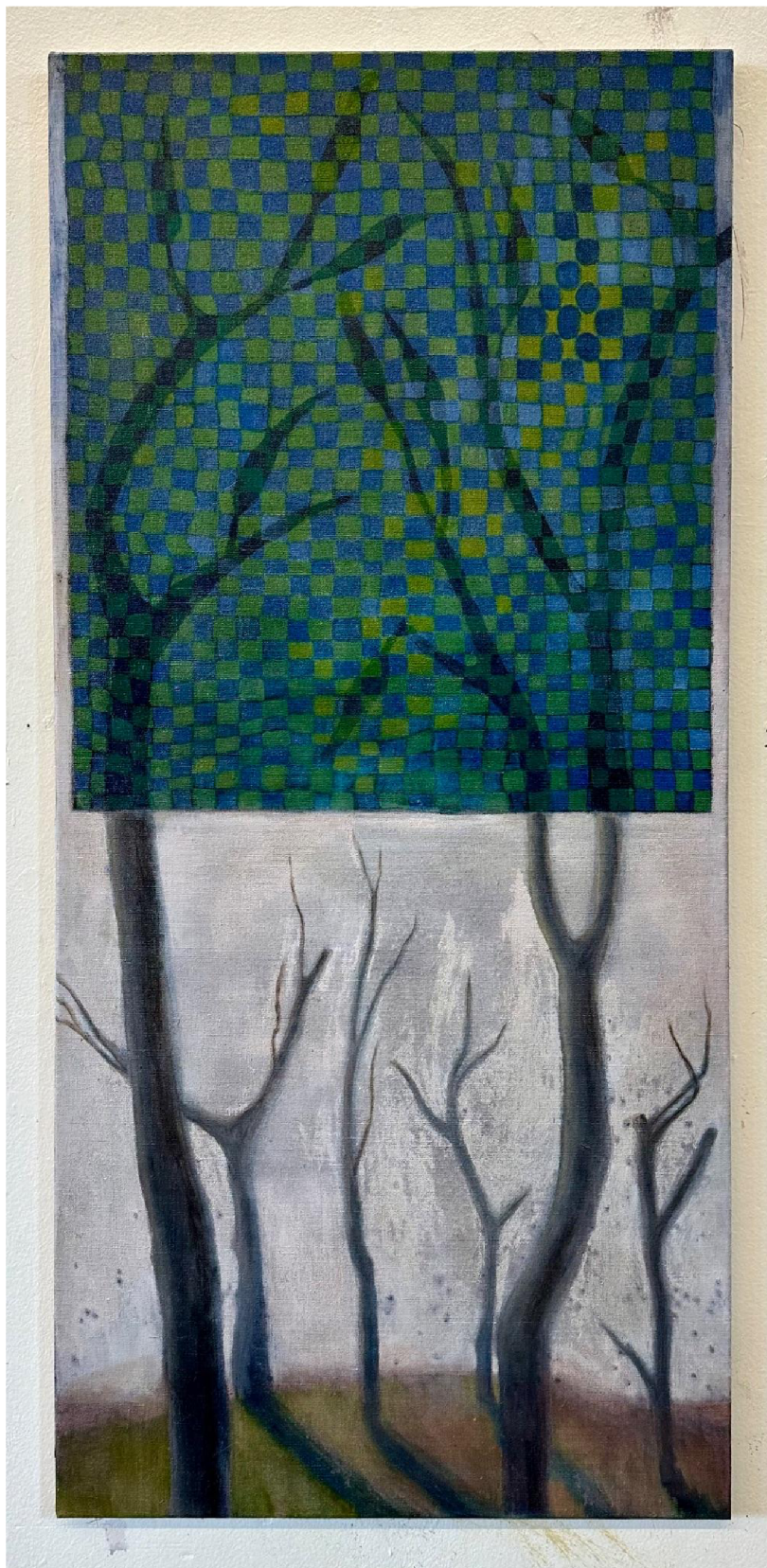
obr. č.1: Hvězdné nebe , olej na plátně, 140 x 65 cm, 2024