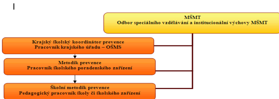
Tabulka č. 1: Organizační systém prevence

„MŠMT je resortem, který koordinuje v rámci ČR aktivity v oblasti primární prevence rizikového chování u dětí a mládeže. Tuto koordinaci zabezpečuje ve spolupráci s krajskou institucionální úrovní - krajskými školskými koordinátory prevence, na úrovni bývalých okresů prostřednictvím pedagogicko-psychologických poraden - metodiků prevence a zároveň v úzké vazbě na činnost samotných primárních uživatelů a realizátorů programů primární prevence rizikového chování škol a školských zařízení - školních metodiků prevence. Díky takto nastavenému vertikálnímu systému vedení má MŠMT vytvořen stabilní systém koordinace a řízení od úrovně státní, přes samosprávné, až po úroveň místní. V rámci celé ČR má ve spolupráci s kraji vytvořeny koordinační a metodické články na krajské, bývalé okresní a místní (školní) úrovni. Při své činnosti primárně vychází z dokumentů národní povahy, a to zejména platné legislativy a národních strategií – Národní strategie protidrogové politiky na příslušná období a Strategie prevence kriminality taktéž na příslušná období.“ (Národní strategie primární prevence rizikového chování dětí a mládeže na období 2013 – 2018)