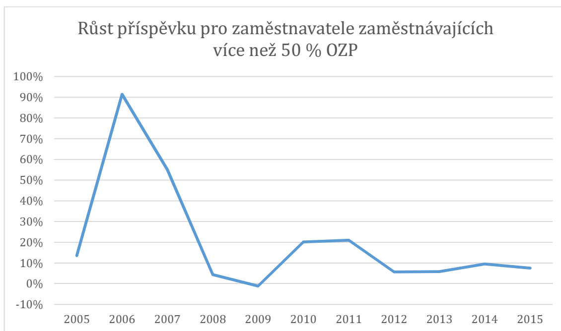
Graf č. 2: Znárodnění kolísání velikosti poskytnutých příspěvků pro zaměstnavatele zaměstnávajících více než 50 % osob se zdravotním postižením

Protože se zvyšuje velikost poskytovaných prostředků, musí zákonitě růst i počet nových chráněných míst, počet zřízených míst zobrazuje tabulka č. 5. Za posledních 10 let rostl počet chráněných pracovních míst průměrně o 883 ročně.