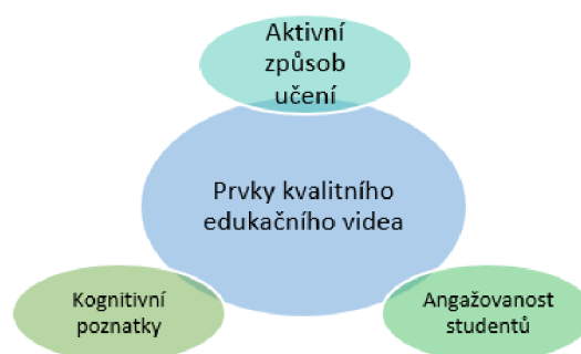
Obrázek 1 Prvky kvalitního edukačního videa dle J. Brame, zpracování vlastní. [26]

Jak již bylo zmíněno, kvalitní edukační video je podmíněno několika klíčovými aspekty, jež by měly z kvalitně zpracovaného edukačního videa vycházet. Dle J. Brame lze tyto aspekty rozdělit do tří dílčích kategorií: 1. kognitivní poznatky (zaměřené na zpracování prezentovaných informací), 2. aktivní způsob učení (vystihující nástroje umožňující pochopit prezentovanou látku maximálním způsobem, 3. angažovanost studentů s prezentovanou látkou (tzn. zapojení prvků, jež pomáhají co nejvyšším možným způsobem zahrnout studenty do dané problematiky). [26]