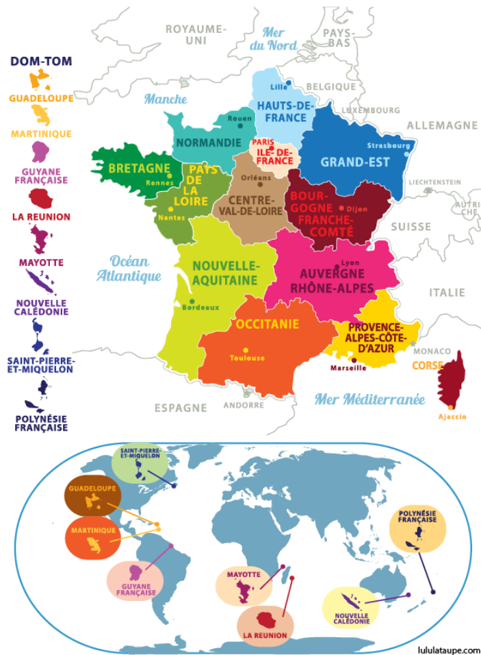
Schéma 1 : Carte de France et territoires d’outre-mer.