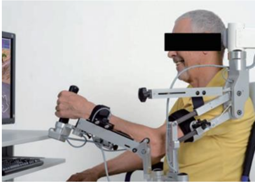
Obrázek 1 Simulace terapie prostřednictvím exoskeletonu Armeo (Chang a Kim, 2013)