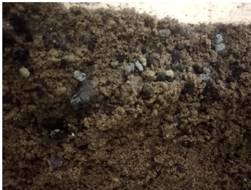
Obrázek 4 Nakladená vajíčka strašilky v písku

Vajíčka samice kladou do půdy (Obr. 4). Jejich velikost je zhruba 4 mm a mají soudečkovitý na jednom konci plochý a na druhém zašpičatělý tvar. Doba inkubace je zhruba 5 měsíců při teplotě okolo 25 °C, při nižších teplotách se tato doba prodlužuje. Z nymf se stávají dospělí jedinci ve věku 4 měsíců (Pecina, Kovařík, 2003).