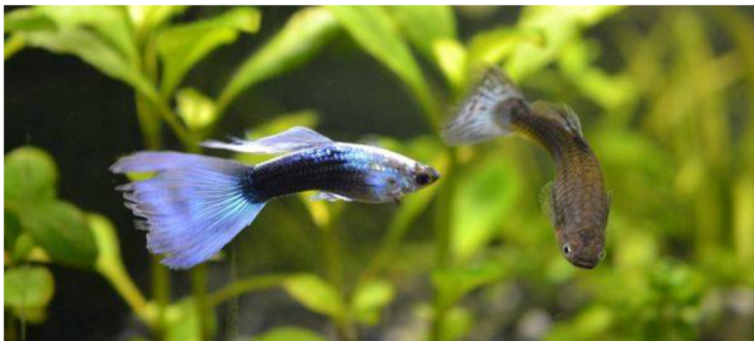
Obrázek 5 Živorodka duhová – samec a samice

Pro toto zbarvení jsou velmi často používaná krmiva, která jejich vybarvení zvýrazňují. U zbarvení Triangl výrazně zvětšená červená ocasní ploutev kontrastuje s černým tělem. Varianta Tuxedo je typická svým stříbrným hřbetem. Dalšími variantami Triangl je šedá japonská modrá, šedá variabilní, s výraznou kresbou na ocasní ploutvi, pestrá Tuxedo a zlatý Snakeskin, která se vyznačuje typickou kresbou, podobající se pokožce plazů. Zbarvení Snakeskin je vyšlechtěné také v bílé variantě. Posledním typem je Dvojmečik, šedá japonská modrá, pro tu jsou charakteristické dva protažené paprsky na ocasní ploutvi (Alderton, 2006).