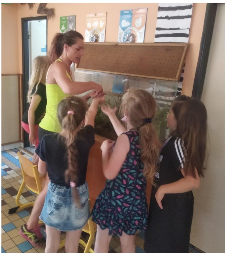
Obrázek 9 Chovatelský kroužek (zdroj: Dočkalová, 2021)

V pravidelném intervalu jednou do měsíce dochází do chovatelského kroužku výběr dětí ze všech oddělení, které se též o chovatelství zajímají. Náplní těchto hodin je mnou zajišťovaná přednášková činnost, která spočívá v seznámení s chovanými druhy, jejich základními potřebami a zajímavostmi. Součástí je také péče o zvířata, údržba jejich ubikací (Obr. 10) a jiná vzdělávací činnost (kvízy, hádanky, tematické dokumenty). V rámci kroužku je též navázána spolupráce s obchody s chovatelskými potřebami JK ZOO a Super ZOO, která spočívá v přednáškách o akvaristice a chovu terarijních zvířat, jež se nenachází ve školní družině. Náplní přednášek a diskuzí je předvedení konkrétních druhů, seznámení s potřebným vybavením, náročností a klady a zápory chovu. Dále jednou ročně děti absolvují též besedu a ukázkou s chovatelem plazů z Teracentra Dolní Černá.