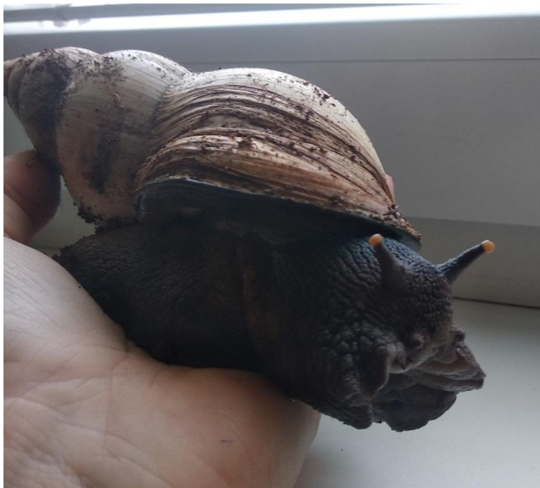
Obrázek 1 Oblovka žravá ( Achatina fulica ) (zdroj: Dočkalová, 2021)

V rámci rodu Achatina existuje mnoho druhů, které se liší jak velikostí, tak barvou. Chovatelé se již zaměřují na šlechtění konkrétních barevných variací, a to jak barvy samotného těla oblovky, tak i barvy ulity. Z toho důvodu se dnes můžeme setkat s mnoha různými varetami jednotlivých druhů. Momentálně se v chovatelském koutku nachází barevná varianta Achatina fulica hamillei rodatzki , která se vyznačuje převážně žlutou ulitou a šedě zbarveným tělem (Obr. 1). V mém chovu se také v minulosti nacházela velmi atraktivní barevná varianta Achatina fulica albino body , u které je typické bíle zbarvené tělo a tmavě hnědá ulita.