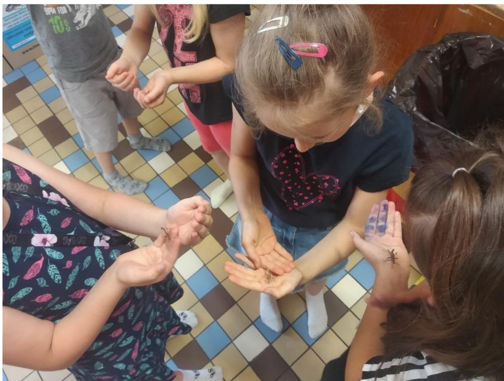
Obrázek 7 Zooterapie s využitím strašilek Sungaya inexpectata (zdroj: Dočkalová, 2021)