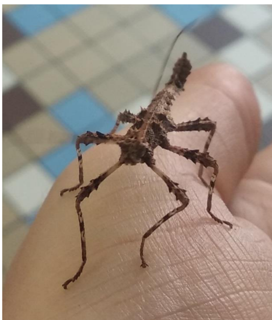
Obrázek 3 Strašilka Sungaya inexpectata