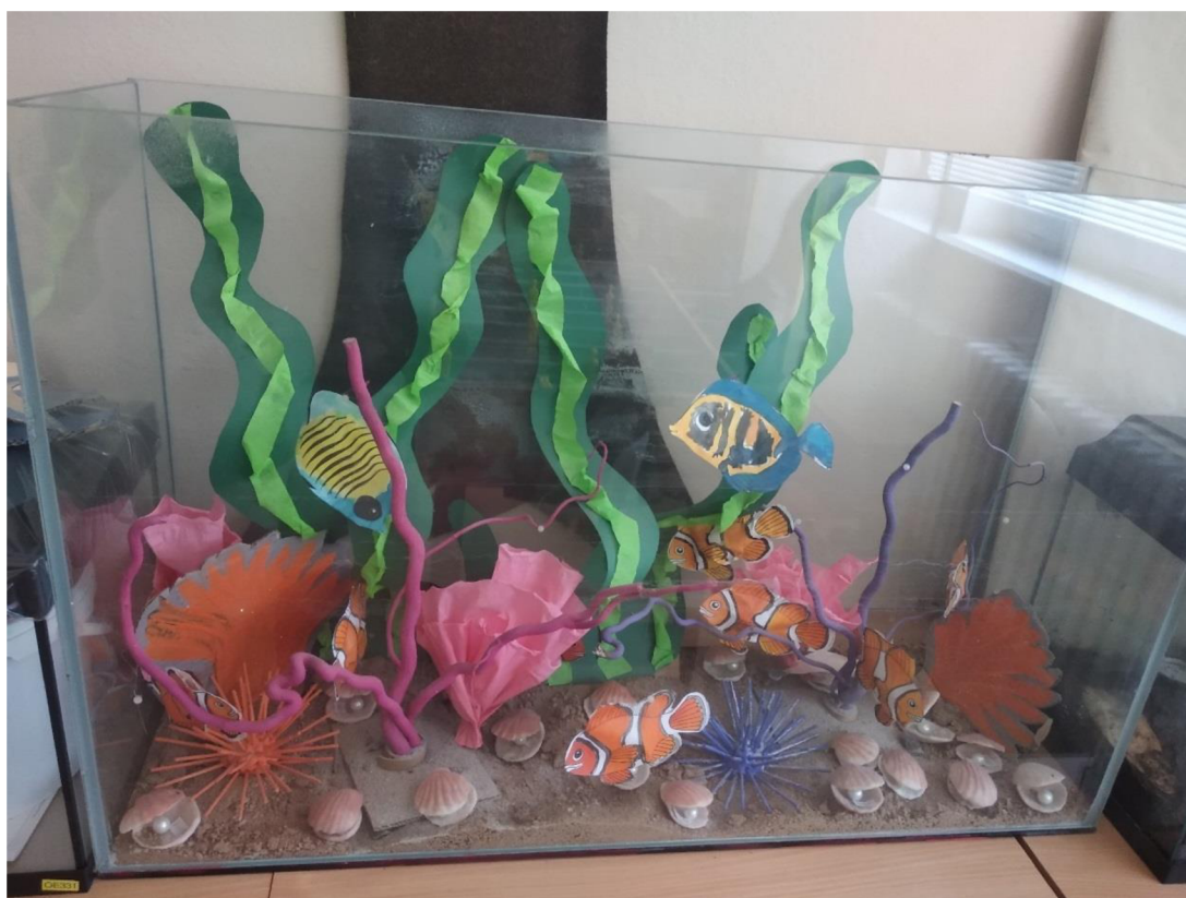
Obrázek 8 Ukázka práce v rámci projektu Cesta kolem světa

Dále je též pořádáno velké množství projektů, které nejsou vázány na roční období a jsou voleny či obměňovány dle aktuálních možností. Novinkou pro rok 2020/2021 je muzikoterapie, Cesta do pravěku, Život v našich vodách, Záchranáři, Animace a Komiks. V rámci družiny je již lety zavedený a ověřený projekt „Cesta kolem světa“ (Obr. 9), kdy každé oddělení tematicky zpracovává informace a poznatky o jednom světovém kontinentu. Výsledky práce jsou prezentovány formou výstavy pro rodiče a širokou veřejnost. Z bohatého výčtu dalších projektů zde například zmíním karneval, Družina má talent, zážitkový park Mamutík Dolní Morava, návštěva hřebčína Karlen v Dlouhé Třebové, .... Na oblíbenosti v posledních letech nabývají celodružinové tematické hry jako například Poklad pirátů, Putování vesmírem či Pevnost Boyard, při těchto hrách se osvědčilo využití terarijních zvířat z chovatelského koutku jako zdroj inspirace, poznání a překonání strachů a obav (Dočkalová, 2021).