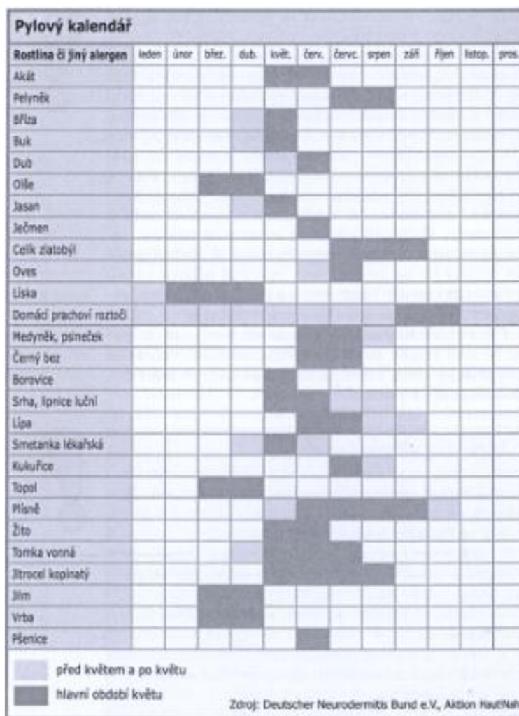
Obrázek 6 Pylový kalendář (zdroj: Astma, Schad, 2008)

Jde o alergickou reakci na pyly různých druhů rostlin (Obr. 6). U senné rýmy je běžné svědění v ústech, krku a očí, ucpaný nos, kýchání a slzící zarudlé oči. Při diagnostice, která obvykle probíhá formou kožních testů, se definuje konkrétní druh rostliny. Léčba probíhá formou tlumení příznaků antihistaminiky a cíleným vyhýbáním se danému alergenu (Gamlin, 2003).