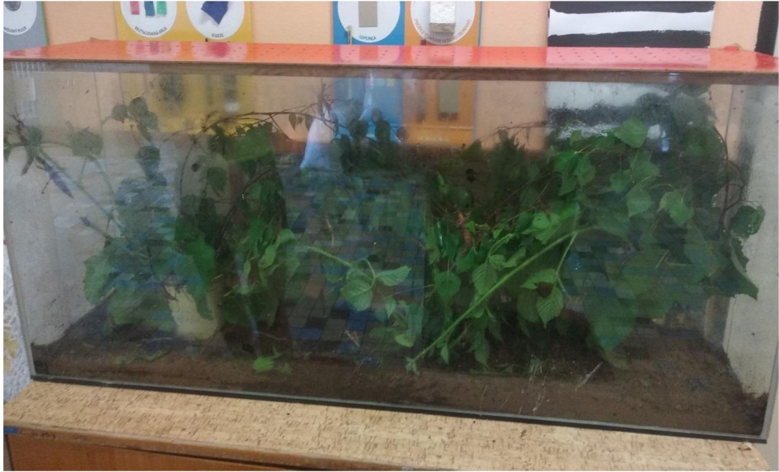
Obrázek 2 Zařízené terárium strašilek Sungaya inexpectata