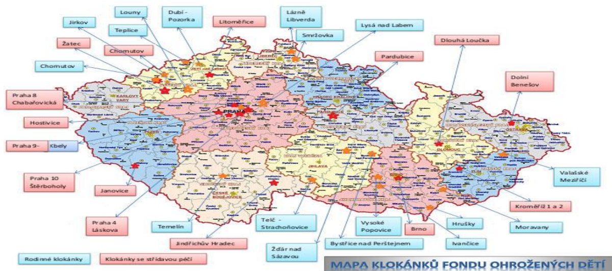
Obrázek 1. Přehled Klokánků v ČR