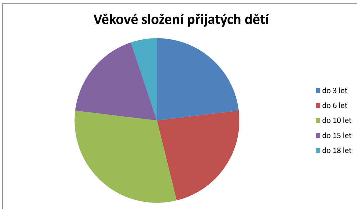
Graf č.1 : Věkové složení přijatých dětí

Dítě je přijato na základě rozhodnutí soudu usnesením o předběžném opatření nebo rozsudkem o svěřeni dítěte do péče zařízení vyžadující okamžitou pomoc. Dokladem pro tento příjem je záznam o přijetí dítěte předaného na základě soudního rozhodnutí jinou osobou než zákonným zástupcem. Při příjmu je nutné mít soudní rozhodnutí s sebou. Toto rozhodnutí zůstává v zařízení. Pracovníkovi soudu (soudními vykonavateli) se nevysvětluje nic o službě ani pravidlech, jelikož jen dítě přivedl – vykonává soudní rozhodnutí.