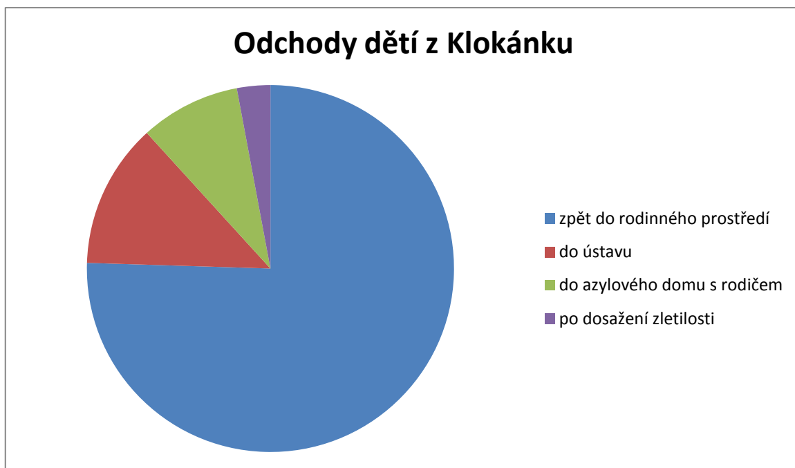
Graf č.3 : Odchody dětí z Klokánku