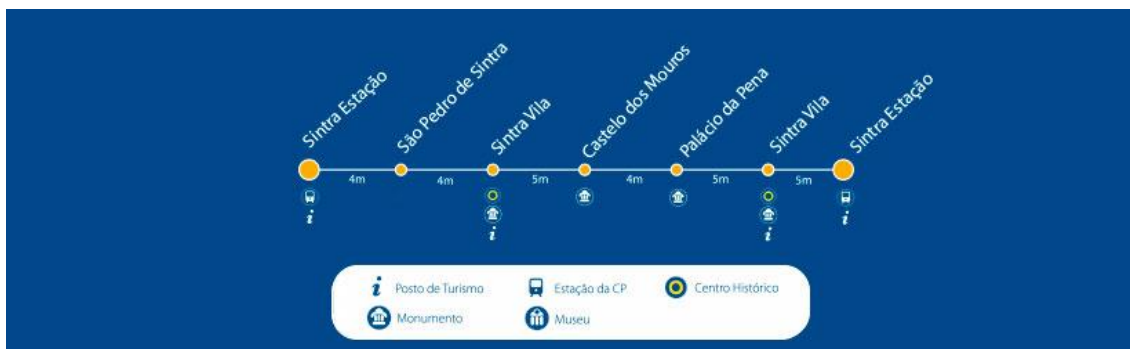
Obrázek 4: Trasa autobusu č. 434. [142]