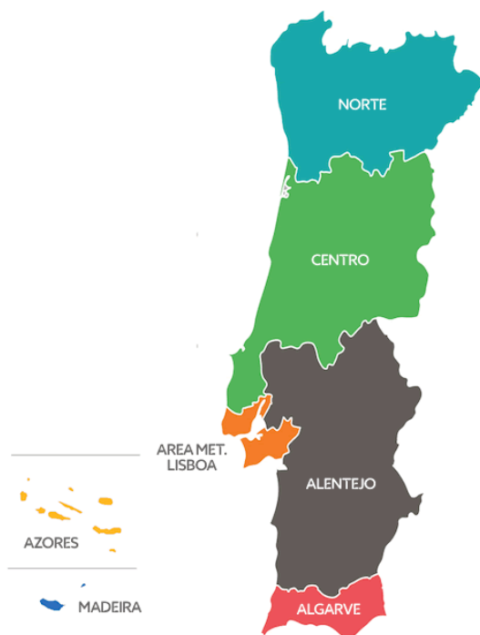
Obrázek 3: Regiony Portugalska podle systému NUTS II. [17]