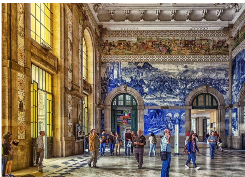
Obrázek 1: Azulejos v nádražní budově São Bento v Portu. [5]

Azulejos (z arabského al-zulaycha = vyleštěný kamínek) je výraz pro barevné malované keramické kachličky čtvercového tvaru, tradičně modro-bílé, které jsou tradičně rozmístěné ve větším počtu vedle sebe a dohromady tvoří jednotný obraz nebo vzor. Je to jeden z nejtypičtějších dekorativních prvků portugalské architektury a tyto azulejos můžeme najít nejen uvnitř budov různého typu (nádražní budovy, kostely, muzea, paláce), ale najdeme je také na fasádách obytných domů. Azulejos totiž kromě dekorativního účelu slouží také proti vlhkosti z vnější strany domů, proto je v současné době velice hojně využíváno.