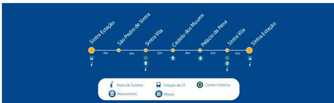
Obrázek 4: Trasa autobusu č. 434. [142]