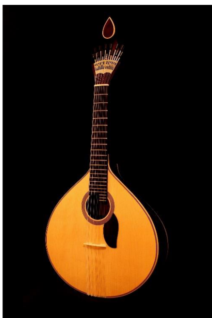
Obrázek 2: Portugalská guitarra typická pro fado. [7]

Fado je tradiční portugalská hudba, připomínající blues, s tradičně velice melancholickými texty písní, které jsou velice procítěně interpretovány. K fadu jsou většinou potřeba tři lidé – jeden zpěvák, jeden hráč na klasickou portugalskou dvanáctistrunnou kytaru nazývanou se guitarra, která svým tvarem připomíná mandolínu, a jeden hráč na kytaru klasickou. Portugalci dělí fado na dvě skupiny – fado z Lisabonu, které je tradičně zpíváno ženami, a fado z Coimby, které je více smutné a interpretují ho spíše muži. Hudba fado je zapsaná na seznam nehmotného kulturního dědictví UNESCO.