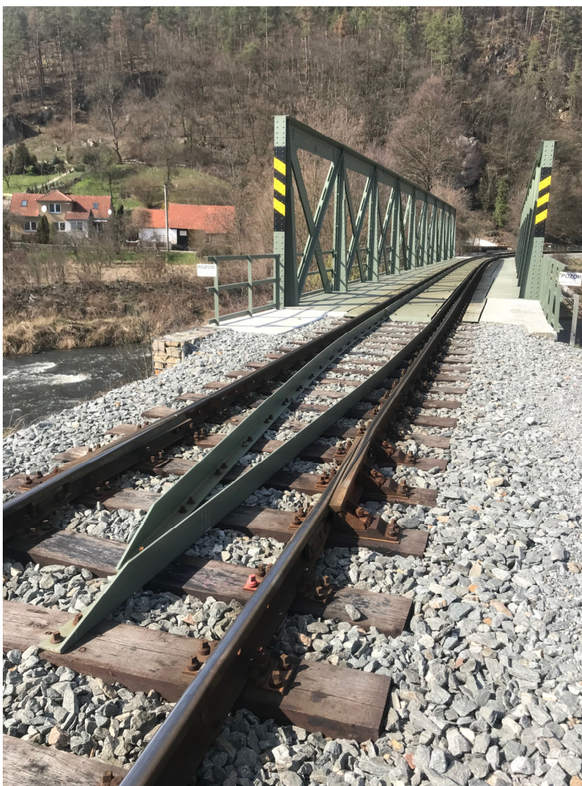
Kolejové malé dilatační zařízení, které bude odstraněno