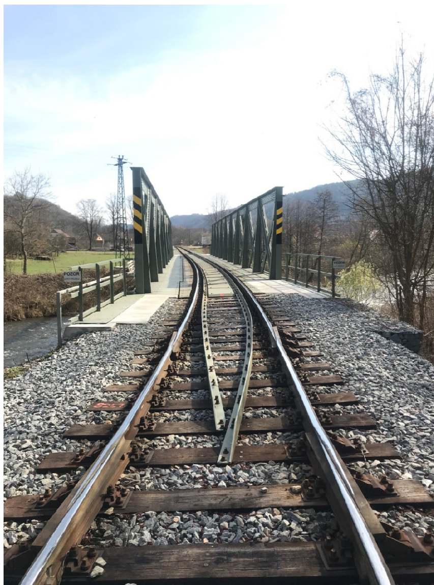
Kolejové dilatační zařízení na straně ložiska