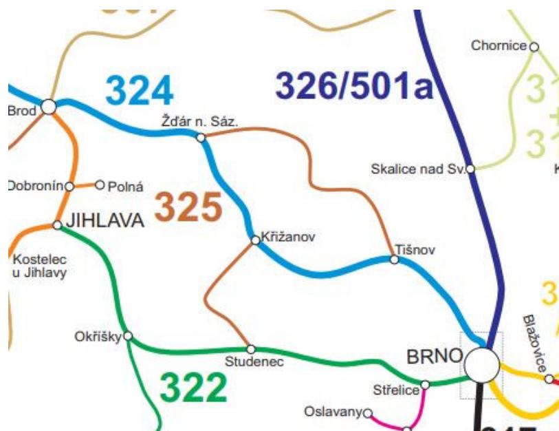
Obrázek č. 1 : Číslování trati podle nákrešných jízdních řádů

Železniční trať překonává komunikace různého významu devatenácti přejezdy. Na trati se nachází sedm železničních stanic: Nedvědice, Doubravník, Prudká zastávka, Prudká, Borač, Štěpánovice, Tišnov.