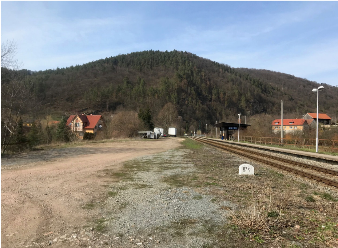
Prostor pro stavbu nástupiště a výhybku ve stanici Borač