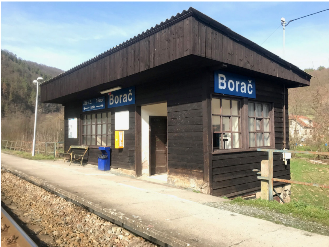
Dřevěný objekt sloužící jako přístřešek