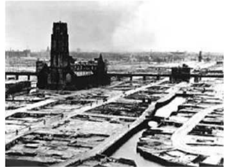
Rotterdam na het Duitse bombardement (p. 7)

Op 10 mei vielen de Duitse troepen Nederland binnen. De aanval bestond uit 2 hoofdstappen. Eerst doorbraken de Duitsers de posities langs de IJssel en in de Peel en de parachutisten probeerden de omgeving van Rotterdam, vooral het vliegveld Waalhaven en ook den Haag in handen te krijgen. Het laatste gedeelte van het plan was maar ten dele succesvol. Gemotoriseerde troepen hadden grote problemen met het waterrijke terrein en parachutisten zonder de nodige dekking werden