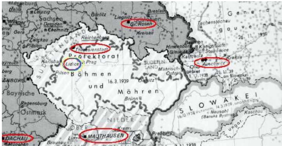
Tsjechië na München (de streepjeslinie tot de Slowaakse grens p.6)