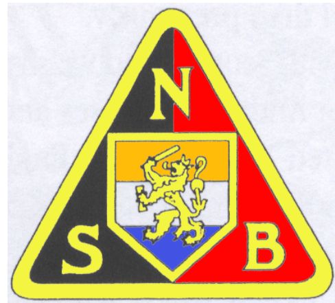
Wapen van de NSB (p.3)

Dit plan werd door de politieke leiding echter afgewezen. Het argument daarbij was dat de regering de werkplaatsen formeert. Meestal ging het om manueel werk waarbij mensen een goedkopere vervanging van mechanisatie waren. Door middel van deze acties werden er veel parken gerealiseerd. Veel mensen hadden het gevoel dat de meeste werklozen lui zijn en liever van een uitkering wilden leven. De situatie was in het jaar 1936 zo erg dat de Nederland