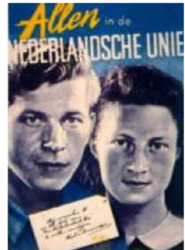
Manifest aan het Nederlandse Volk van de Nederlandse Unie (p. 8)