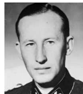
Reinhard Heydrich 1904-1942 Reinhard Heydrich (p.10)

Reinhard Heydrich was in de tijd van de Tweede Weereldoorlog de rechterhand van de tweede machtigste man in de nazistische hiërarchie Heinrich Himmler. Begin jaren dertig is deze man heel snel in de nazi-schaal opgeklommen. Hij werd het hoofd van de Sicherheitdienst en de Gestapo . In 1942 is Heydrich de plaatsvervangend Reichsprotector van het Protectoraat Bohemen en Moravië geworden waar hij Konstantin von Neurath verving. Zijn optreden tegen het Tsjechische verzet was