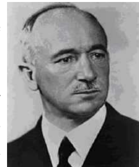
Edvard Beneš (p.4)

In 1935 trad T. G. Masaryk af en werd Edvard Beneš tot zijn opvolger gekozen. Tijdens de verslechtering van internationale situatie was Tsjechoslowakije één van de laatste democratische landen in Midden- en